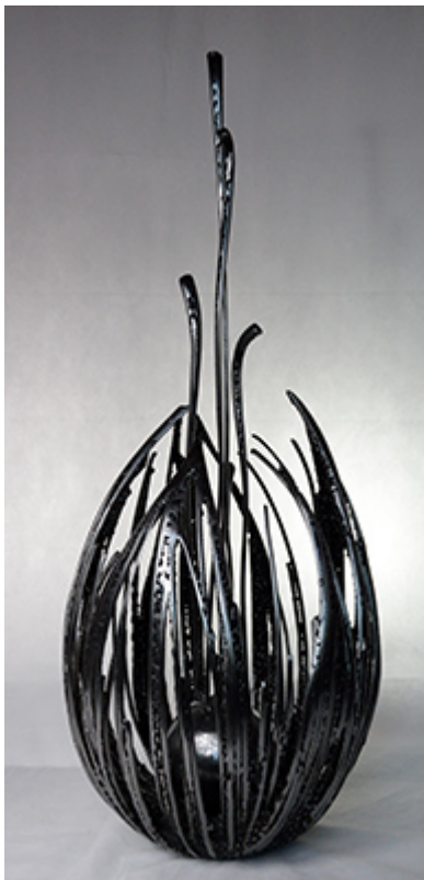
« BLOOM » Métal fusionné 85X40X40xcm