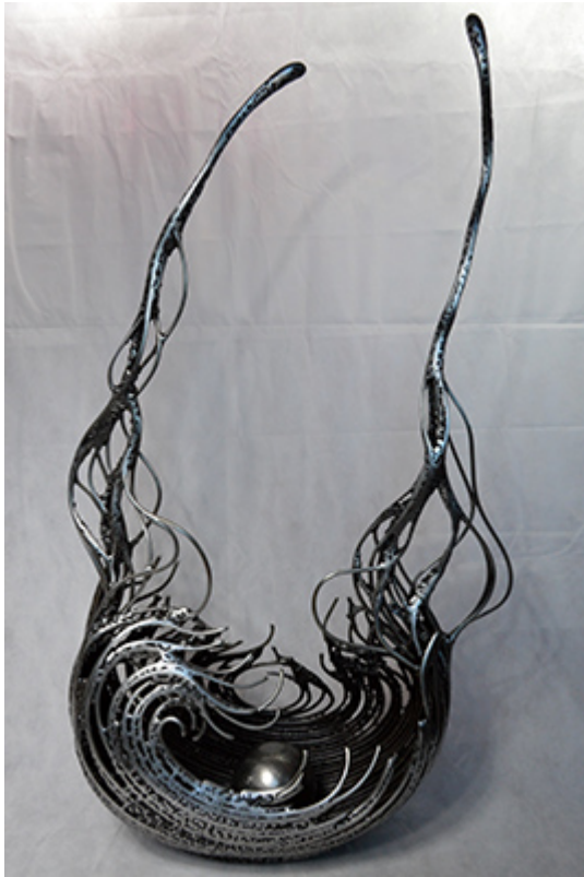
« VAGUE SISMIQUE » Métal fusionné 112X60X20cm