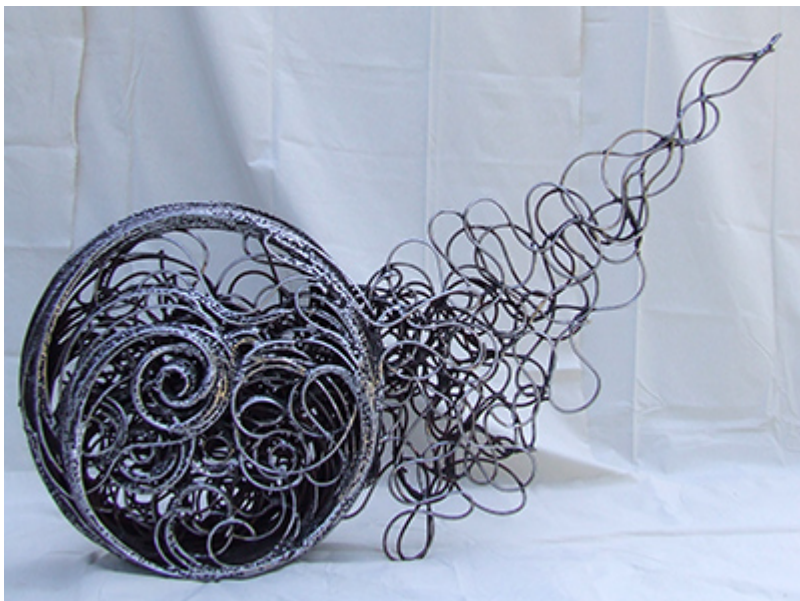
« ONDES GRAVITATIONNELLES » Métal fusionné 102X140X20cm