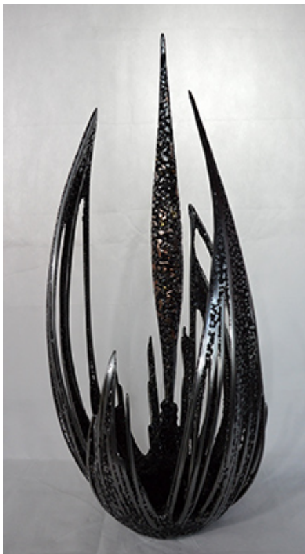
« AXIS MUNDI » Métal fusionné 71X30X30cm