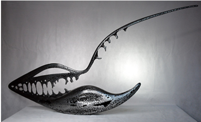
« DIATOMEES » Métal fusionné 70X140X15cm