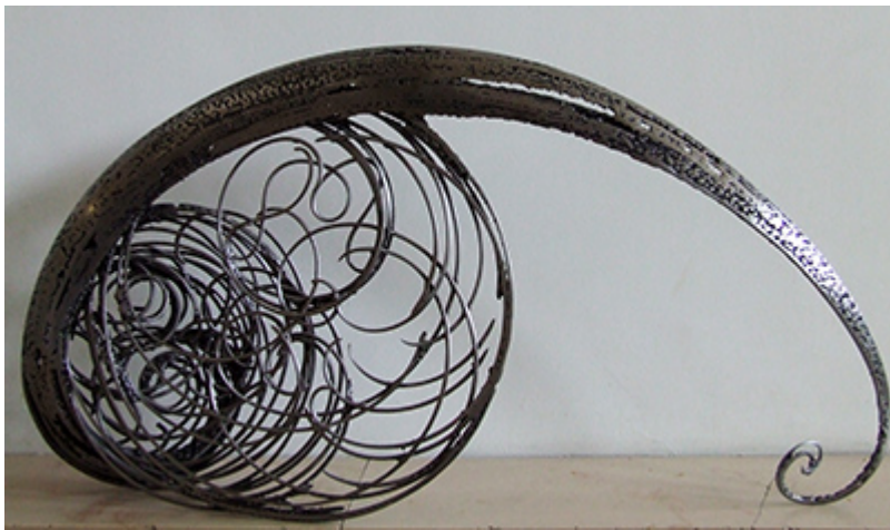
« EXPANSION UNIVERSELLE » Métal fusionné 60X120X20cm