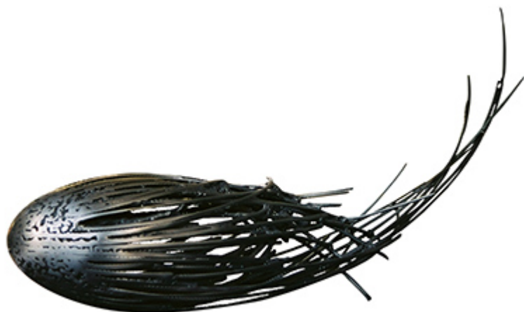
« ŒUF COSMIQUE » Métal fusionné 33X61X17cm