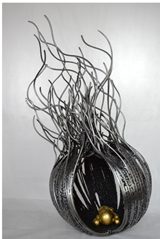
« ACTINIE GM » Métal fusionné et feuille d'or 110X50X50cm