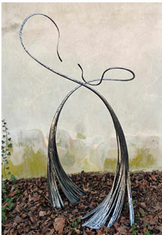
« DUEL TACTILE » Métal fusionné hauteur 170cm