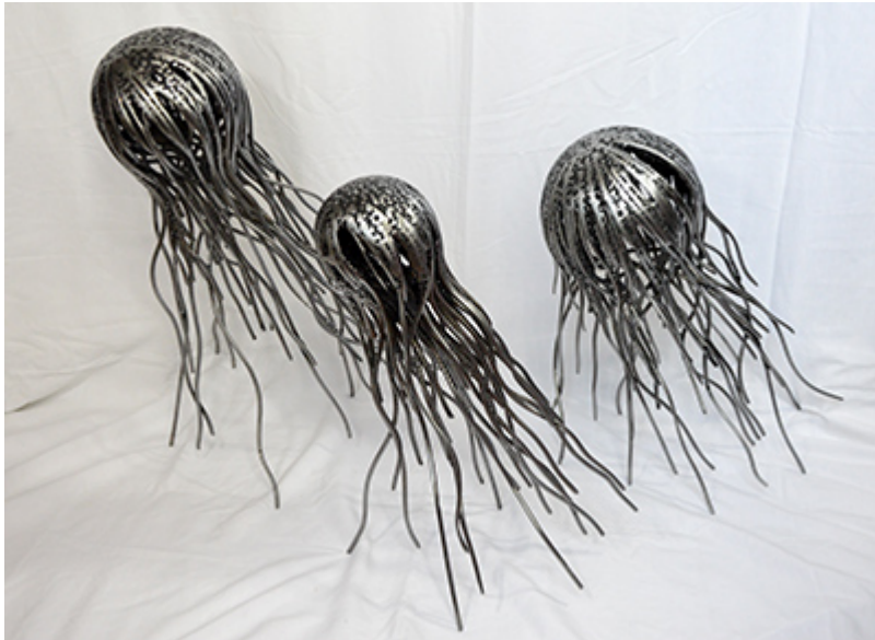
« ABYSSE TRIO » Métal fusionné hauteur 63cm