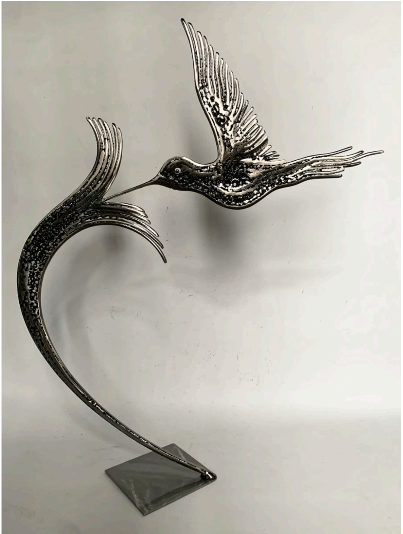
« COLIBRI » Métal fusionné 80X70X22cm