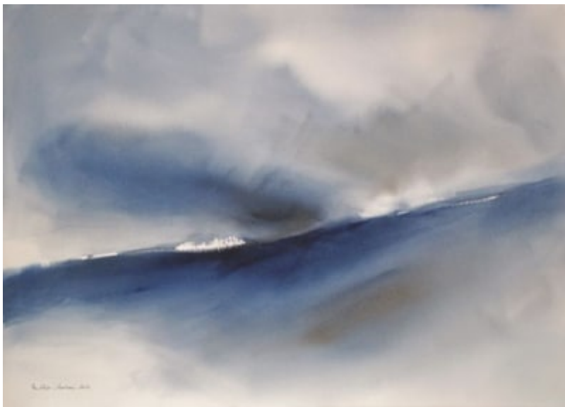
« Fil de vie » Aquarelle sur papier Arches 100 % coton 75x105cm