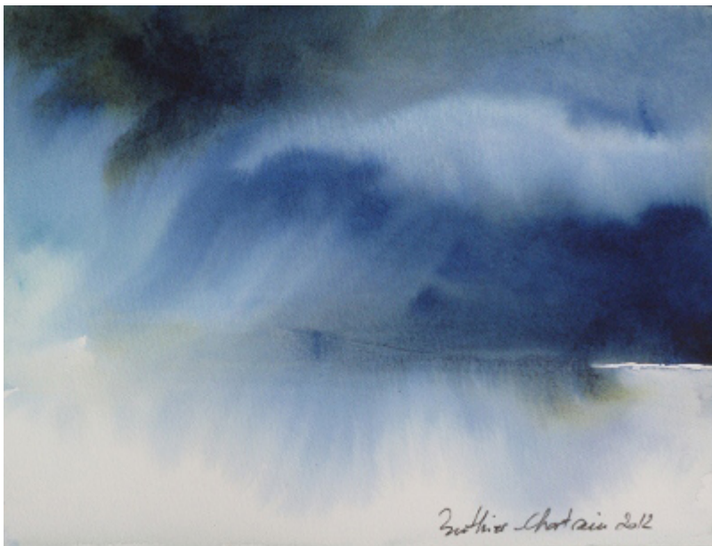
« Sérénité » Aquarelle sur papier Fontaine 100 % coton 17,5 x 23,5 cm