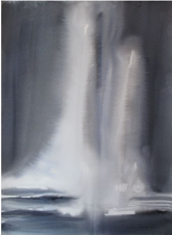
« La chute » Aquarelle sur papier whatman 100 % coton 56x76cm