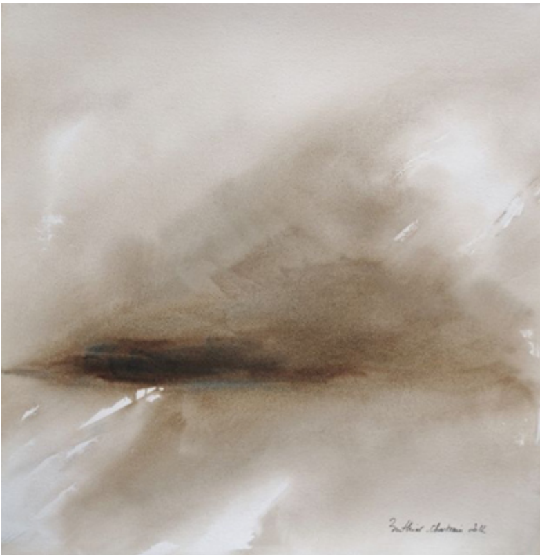
« You're coming back I » Aquarelles sur papier Whatman 100 % coton 56x56cm