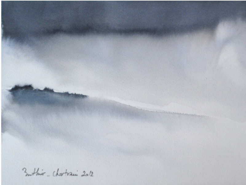
« Silence » Aquarelle sur papier Langton 100 % coton 22x29,5cm