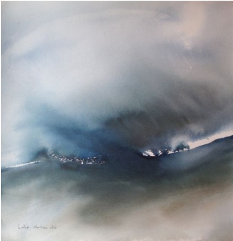
« The only way I » Aquarelle sur papier Whatman 100 % coton 56x56cm