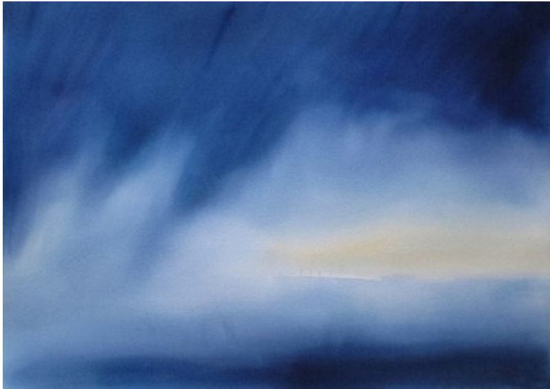
« Traces de vie II » Aquarelle sur papier Arches 100 % coton 75x105cm