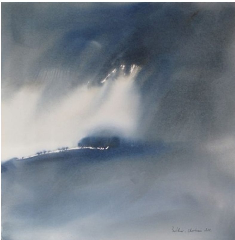
« The only way II » Aquarelle sur papier Whatman 100 % coton 56x56 cm