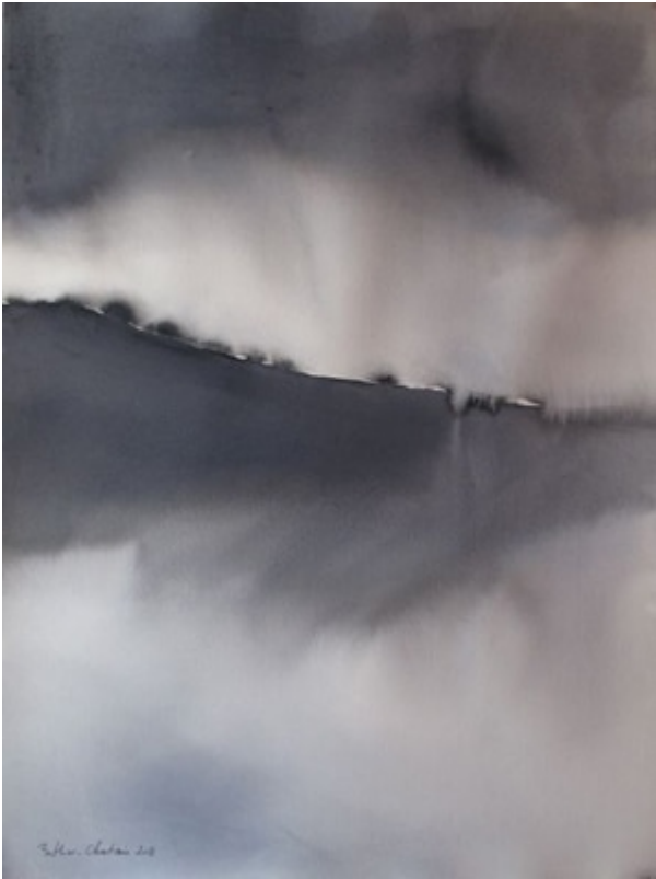
« Equilibre » Aquarelle sur papier Saunders Waterford 100 % coton 56x76cm