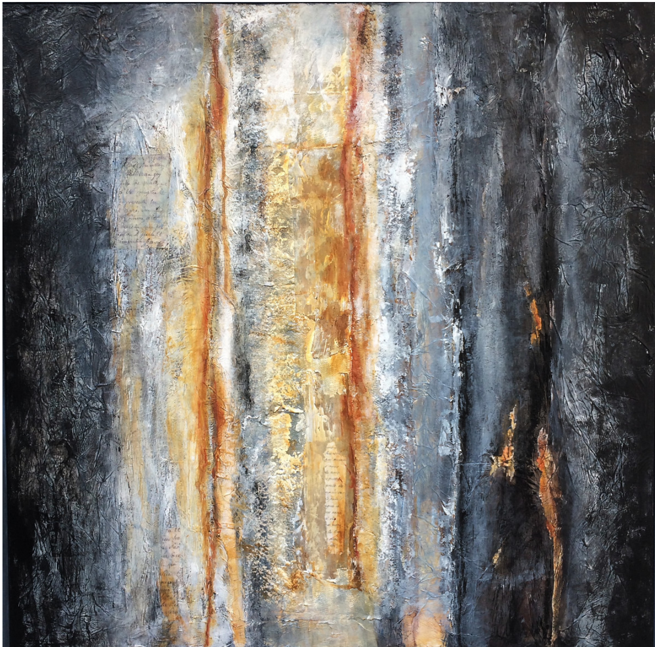
« Traces du temps II » 80x80cm