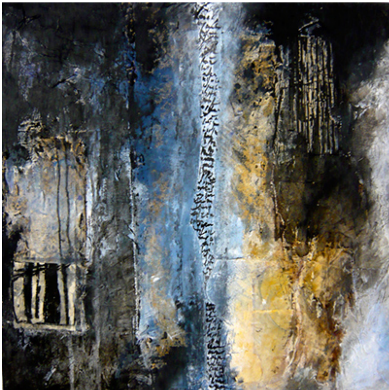
« Territoire cartographique » Technique mixte sur papier 60x60cm