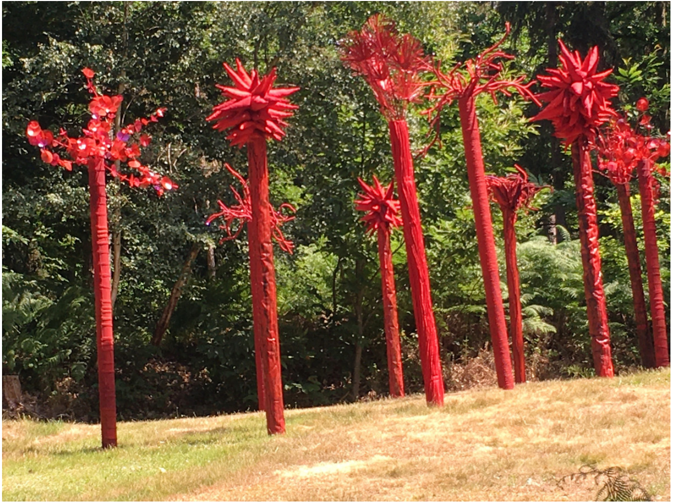
« Forêt des songes » installation Parc de Beaumontel