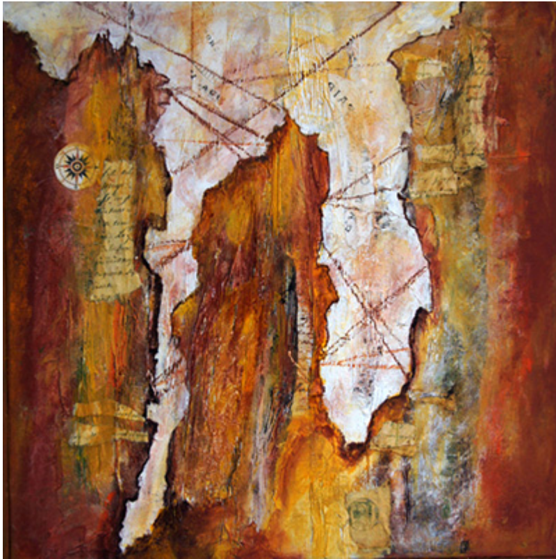
« Terra incognita » Technique mixte sur toile 50x50cm