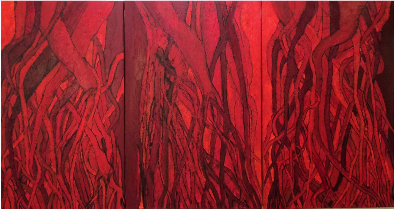
« Racines » Triptyque 3 tableaux de 100x65cm chacun