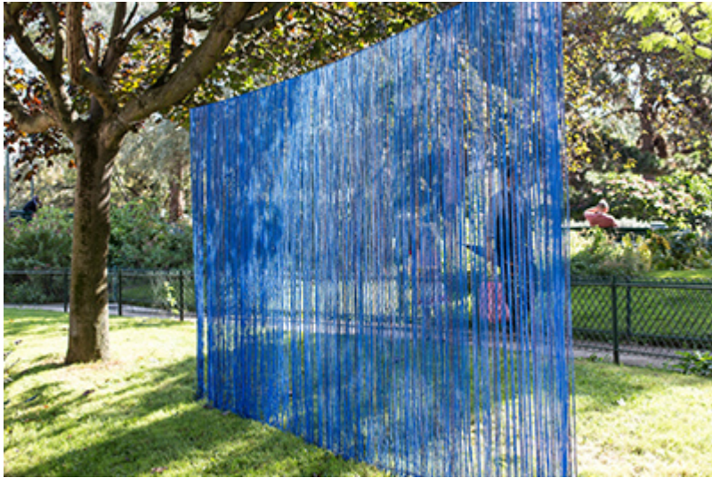
« Murmure de pluie » Installation Land'Art