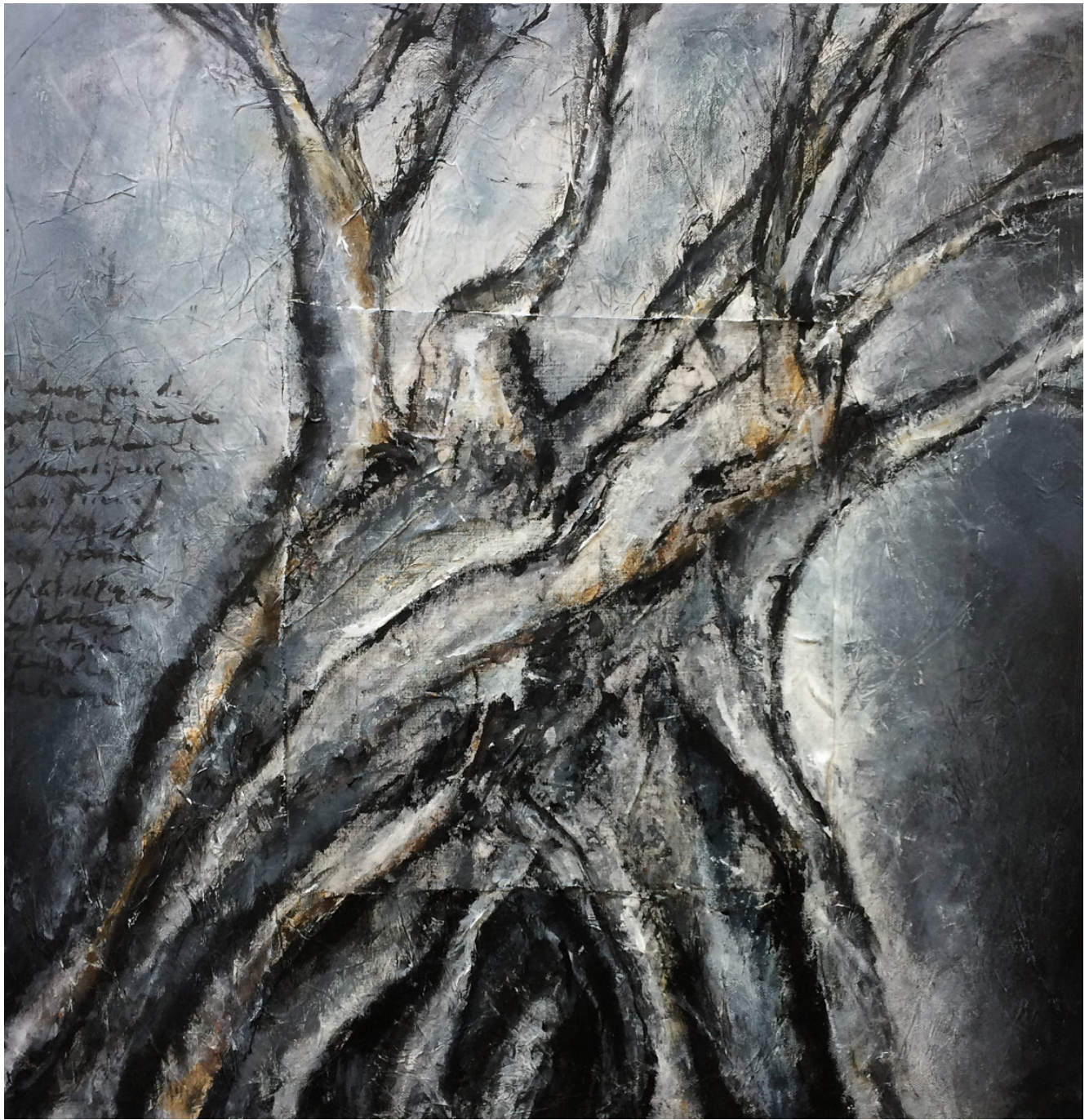
« Turbulence I » 60x60cm