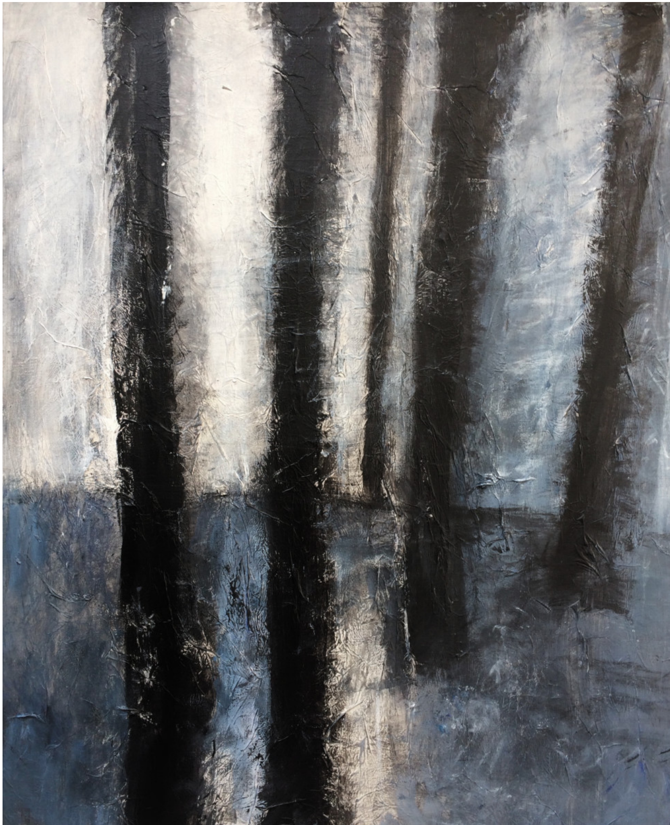
« Forêt bleue » 81x65cm