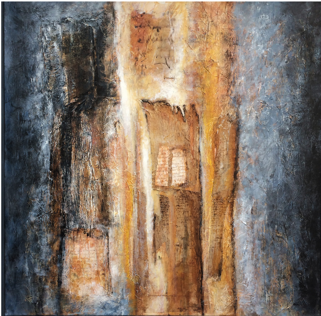
« Traces du temps I » 80x80cm