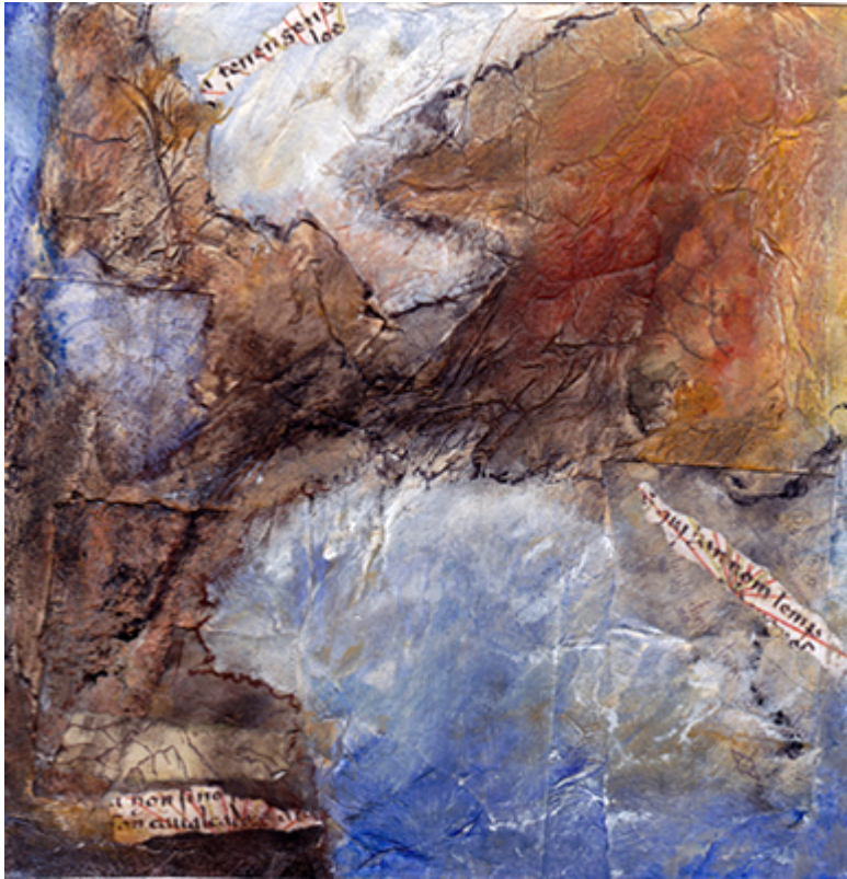
« Archipels » Technique mixte sur papier 20x20cm