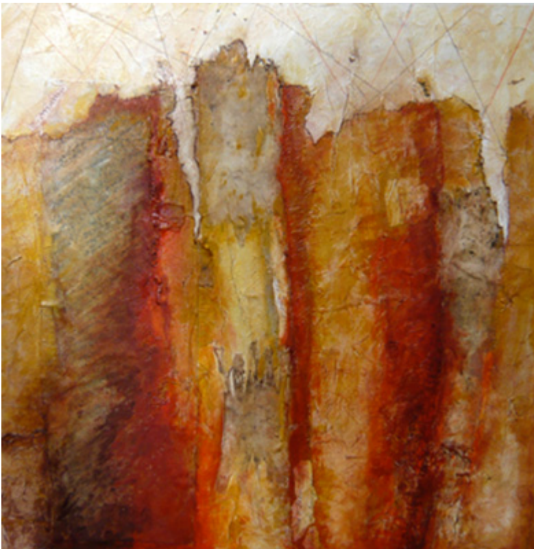
« Cartographie » Technique mixte sur toile 60x60cm