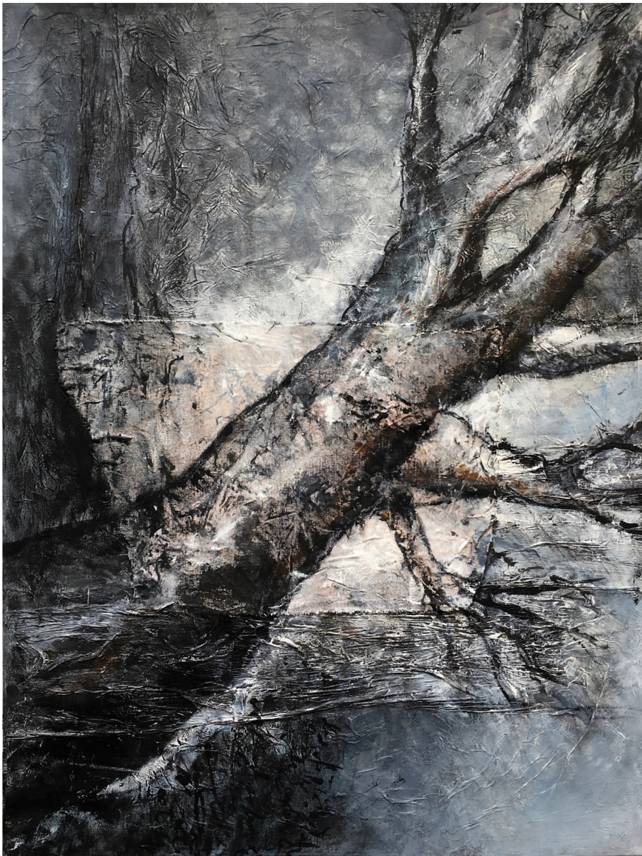
« Dans la tourmente I » 80x60cm