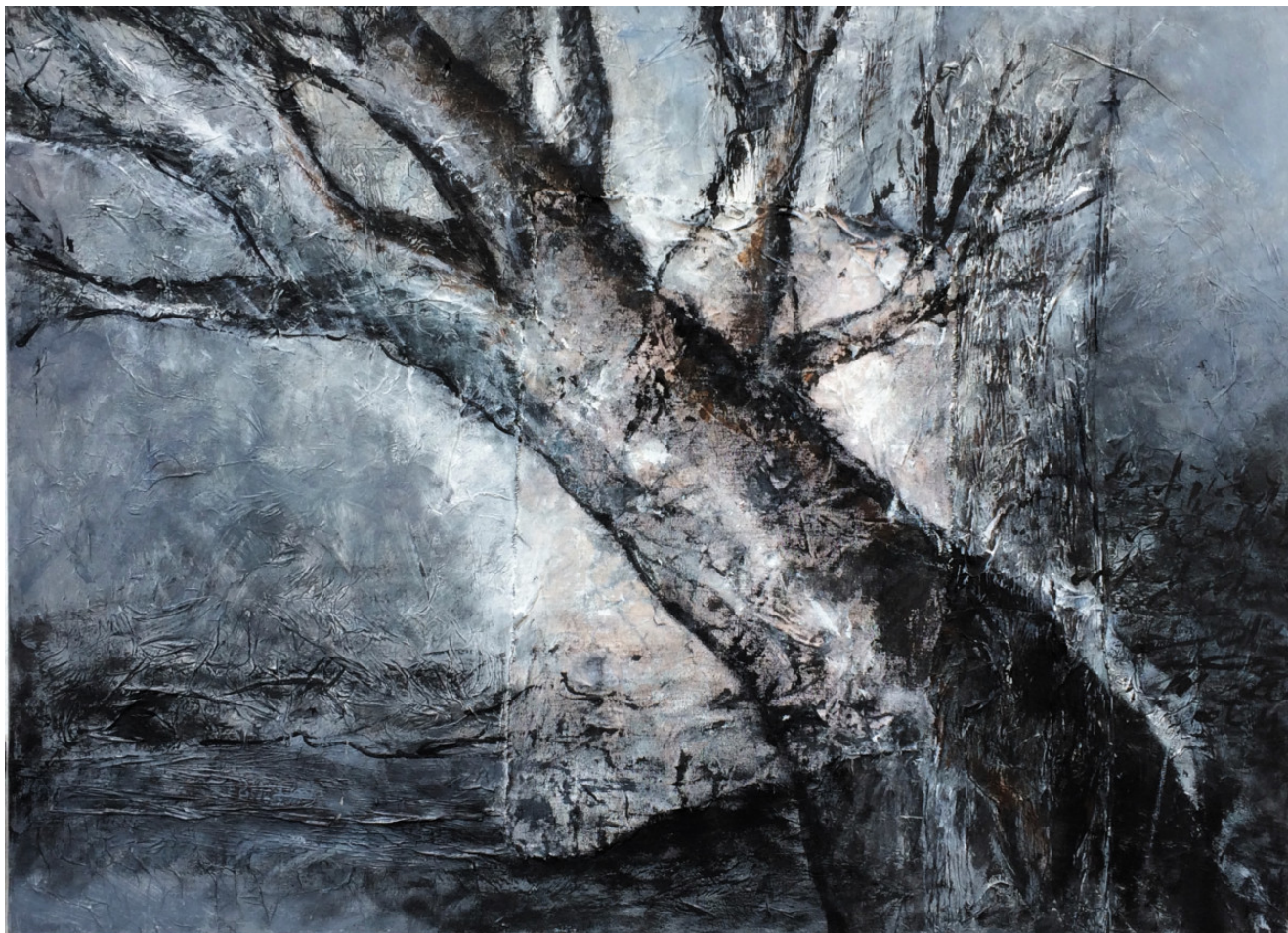
« Dans la tourmente II » 80x60cm