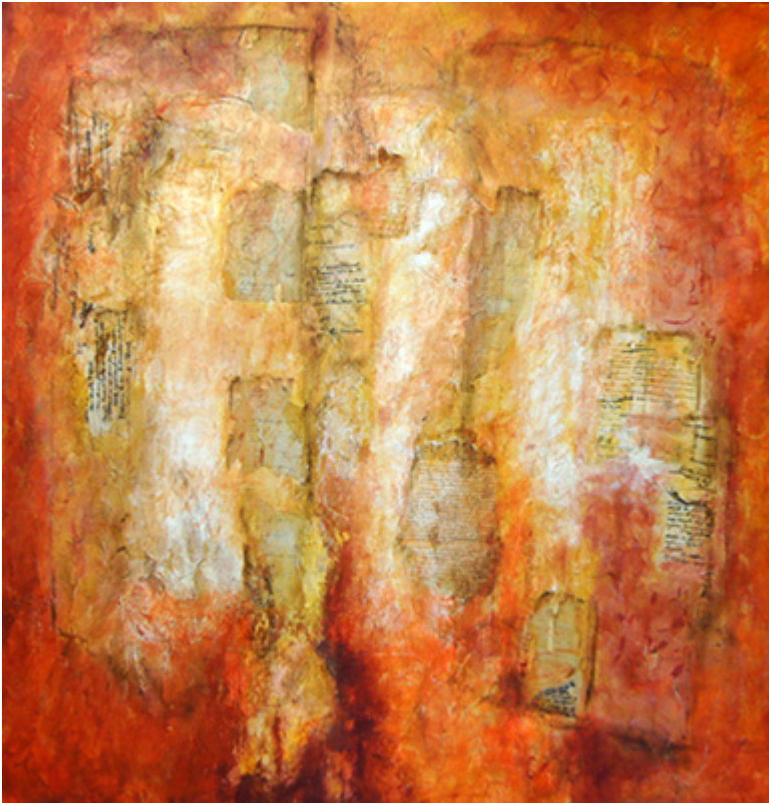
« Aux marges des écritures » Technique mixte sur toile 70x70cm