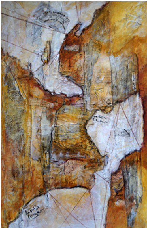
« Terra Nova » Technique mixte sur toile 65x100cm