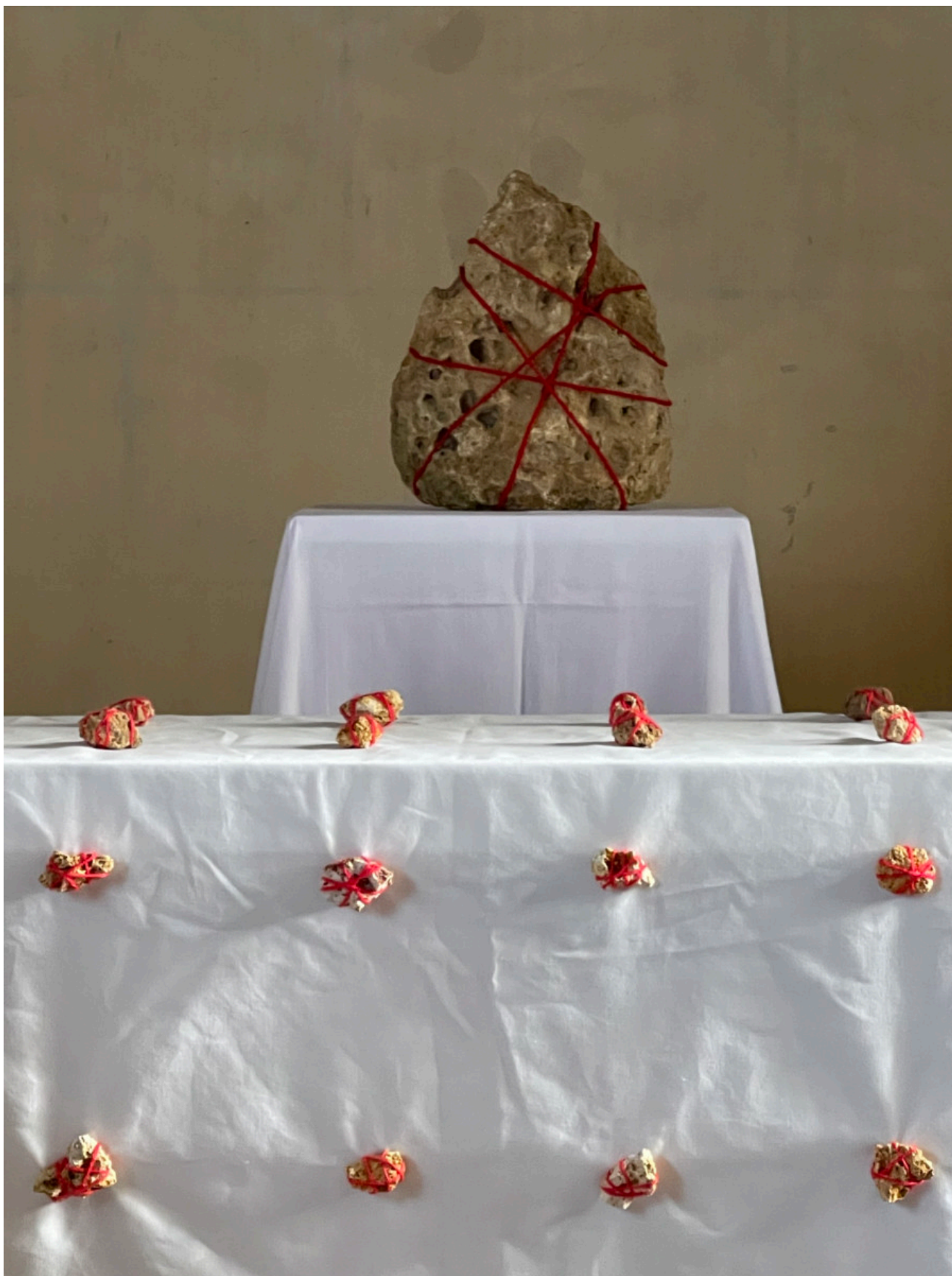
Installation Garden-Party château de la Lorie (49)