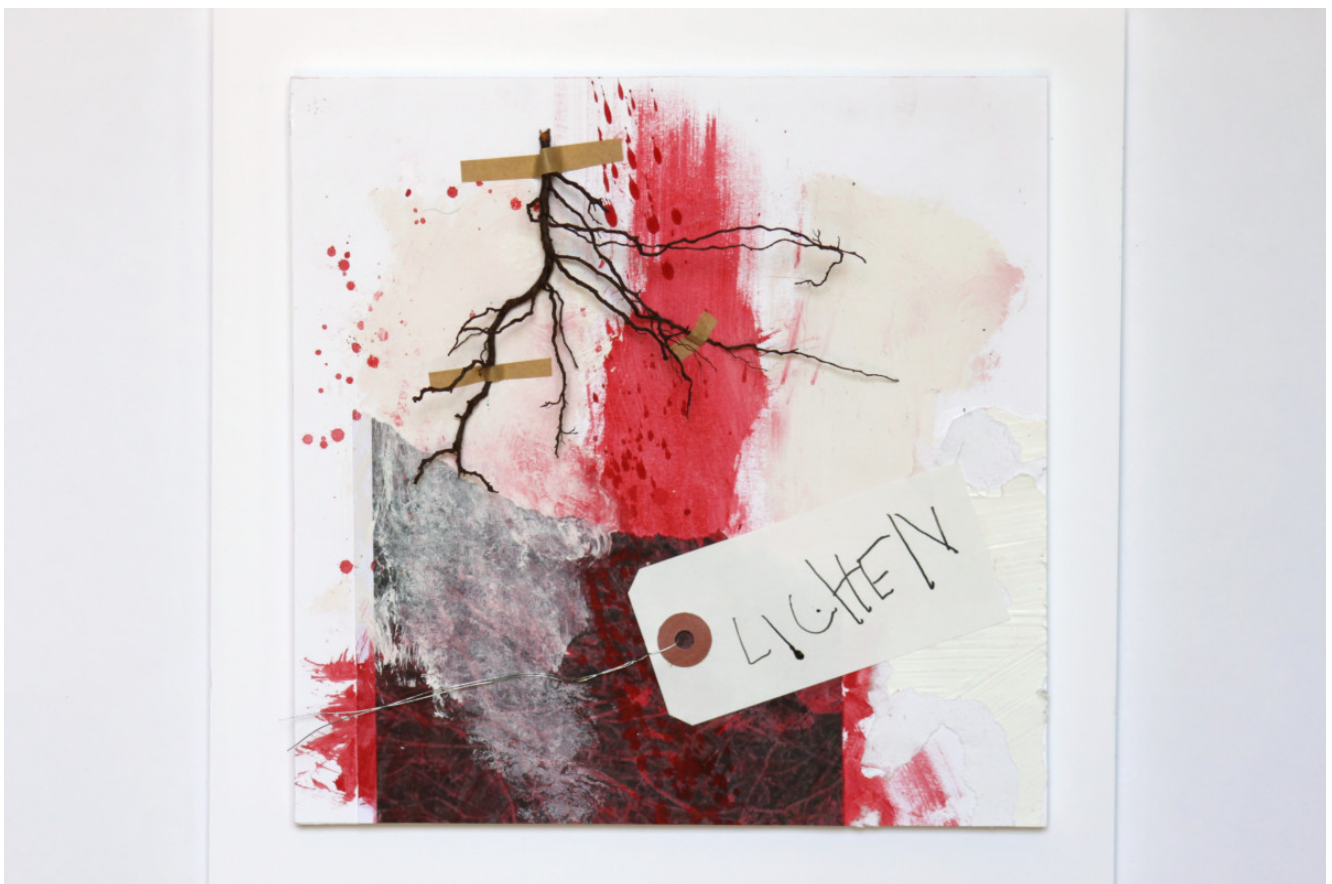
25x25 collage encre pigment