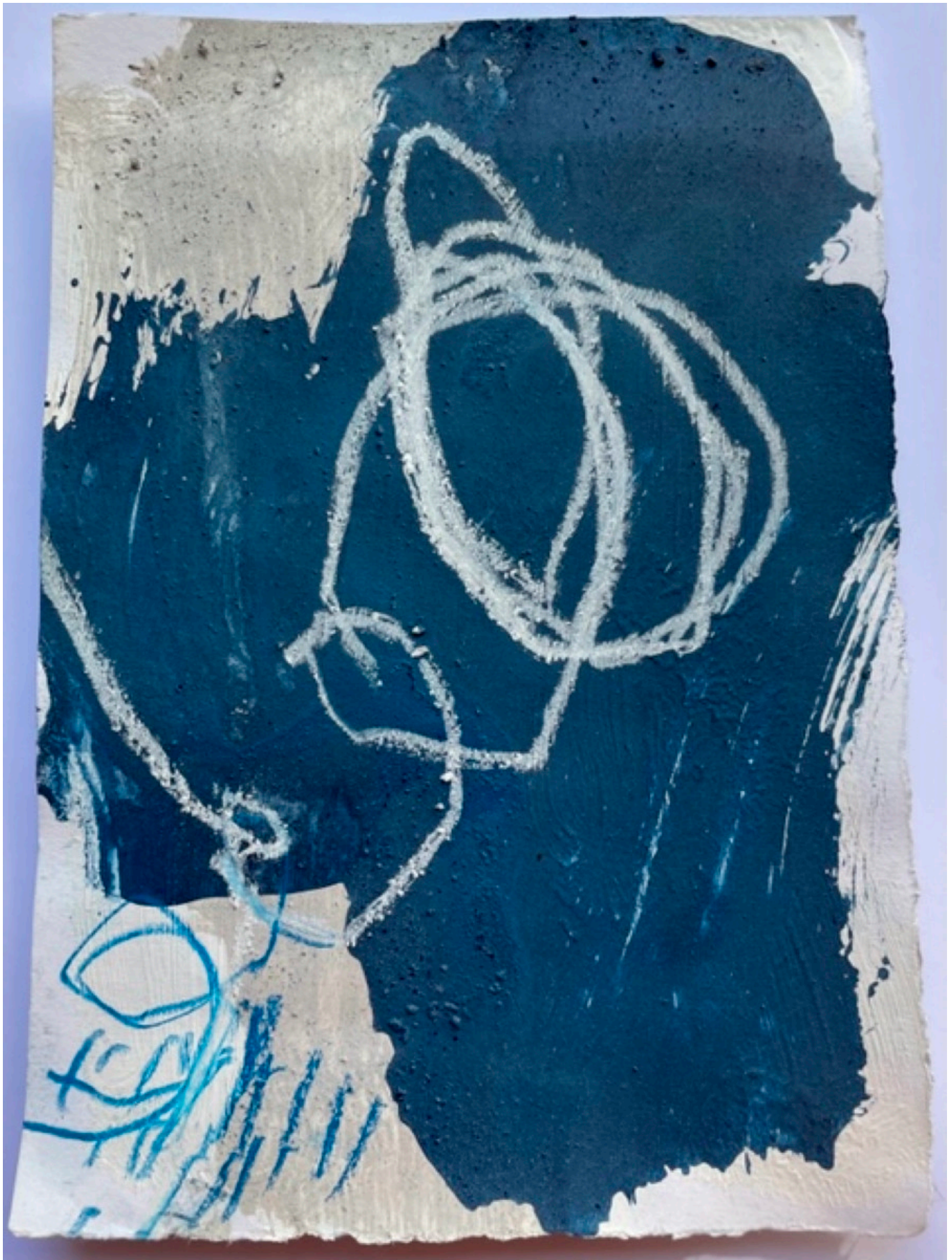
15x18 collage acrylique crayon