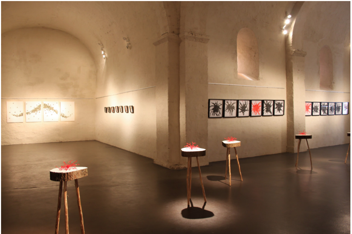
vue d'expo Eglise Saint Etienne Beaugency (45)