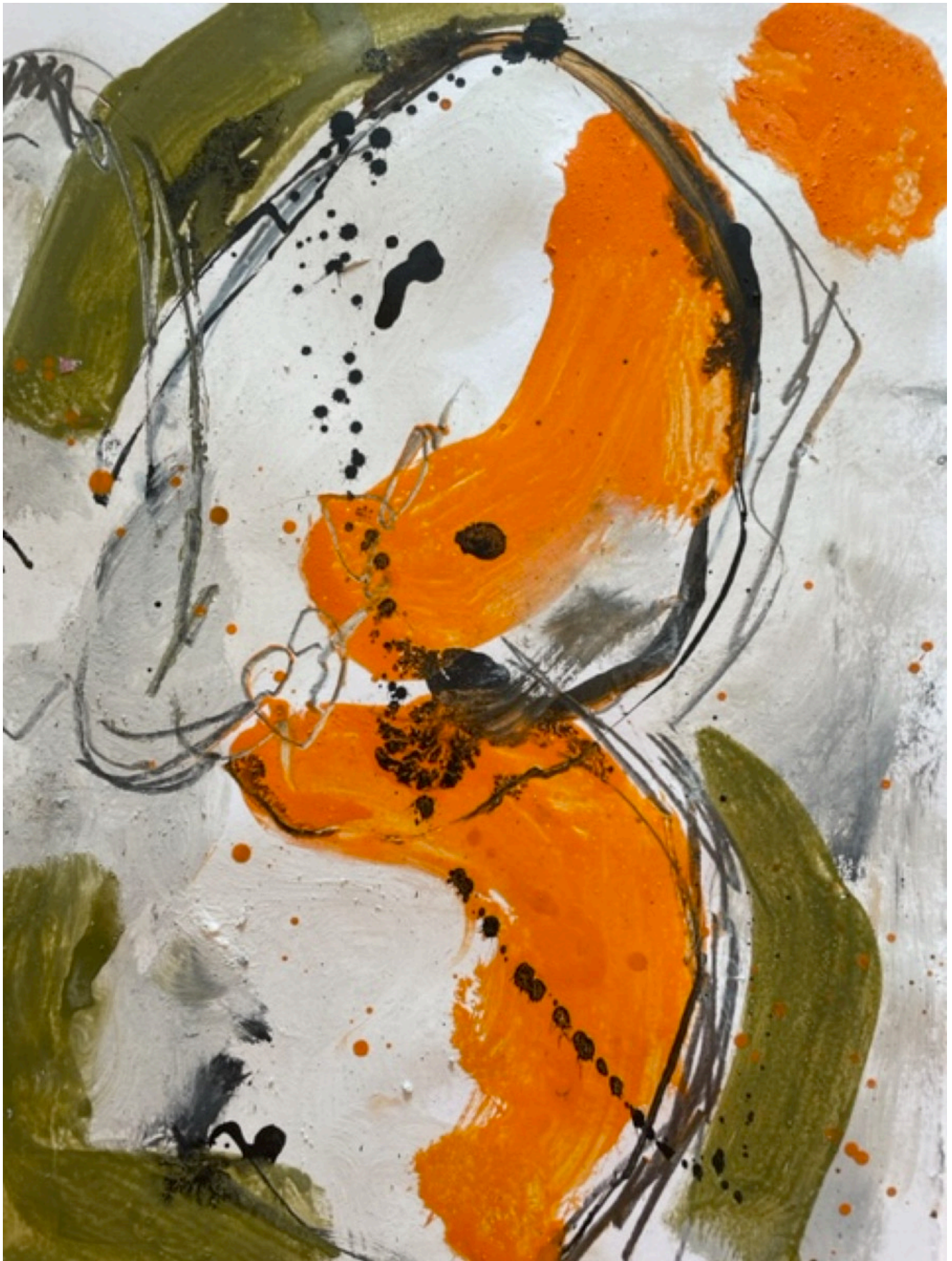
32x43 encre crayon pigment sur papier