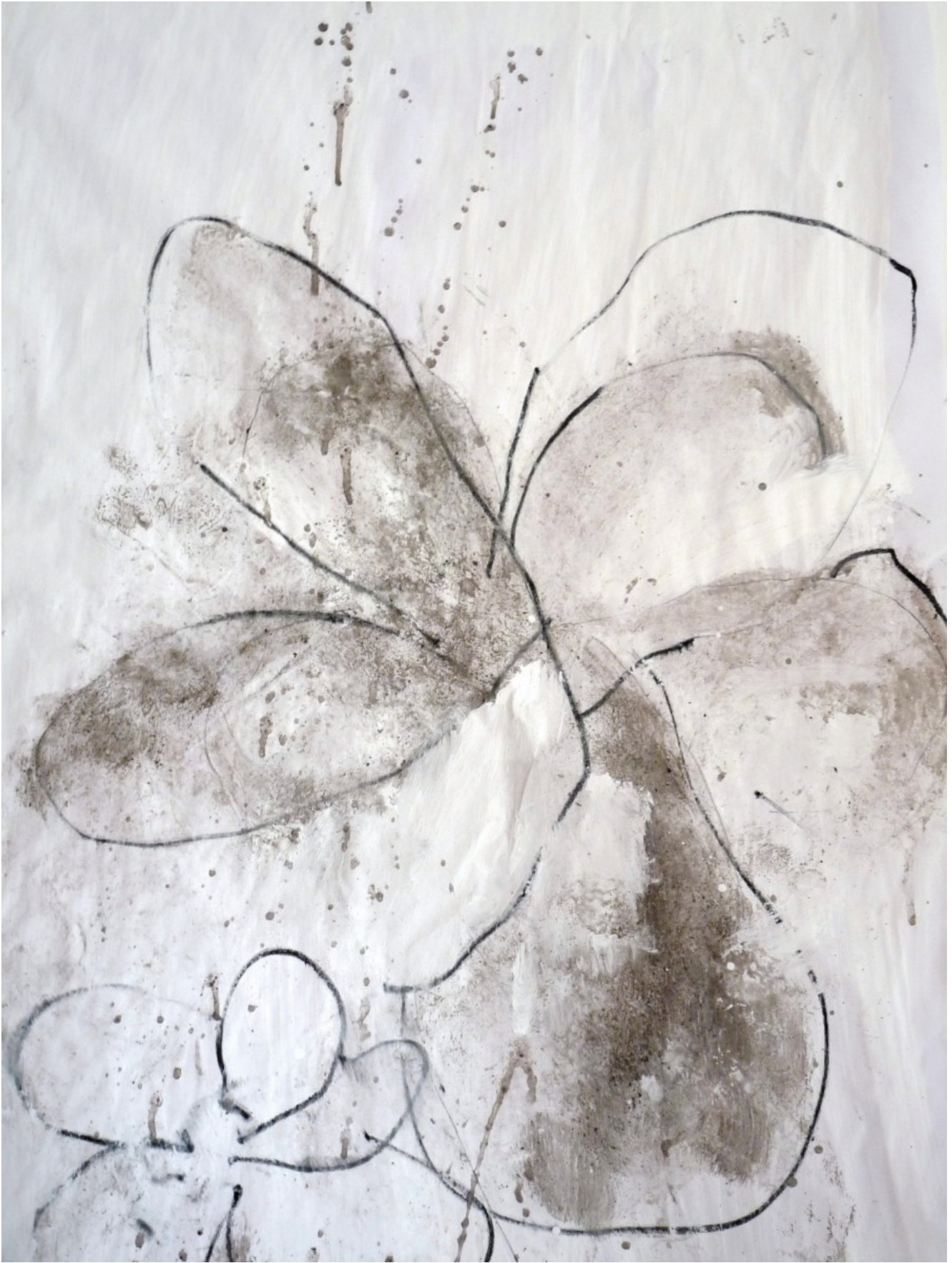
60×100 technique mixte sur papier