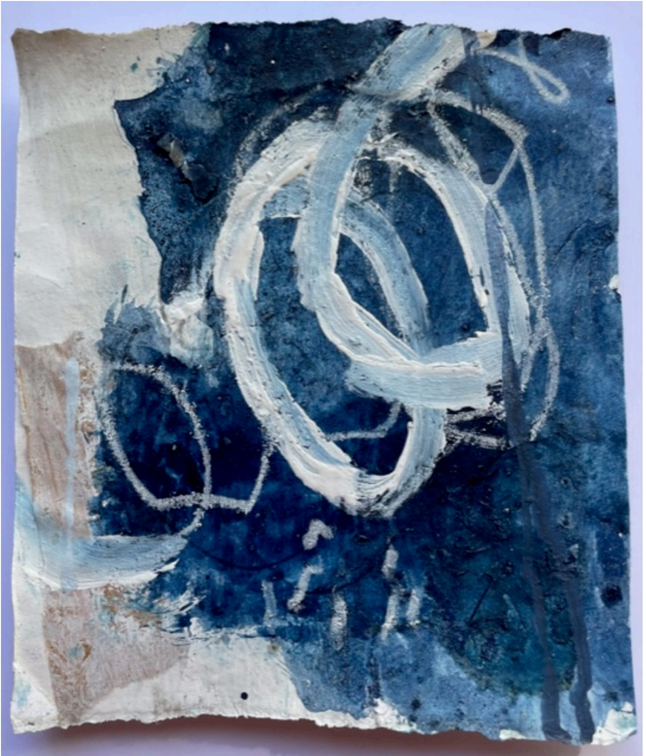
15×18 collage acrylique crayon