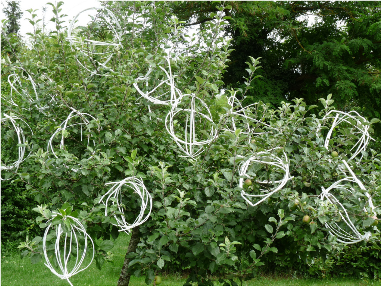
installation branches peintes sur fruitier