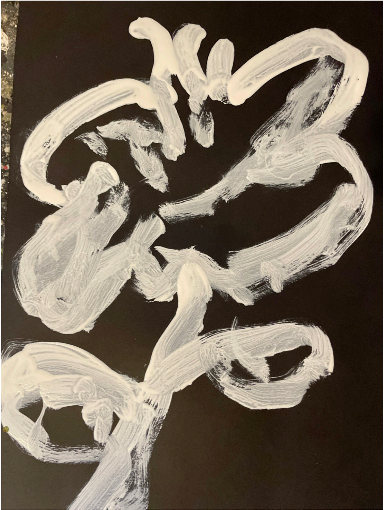
20x30 dessin gouache sur papier