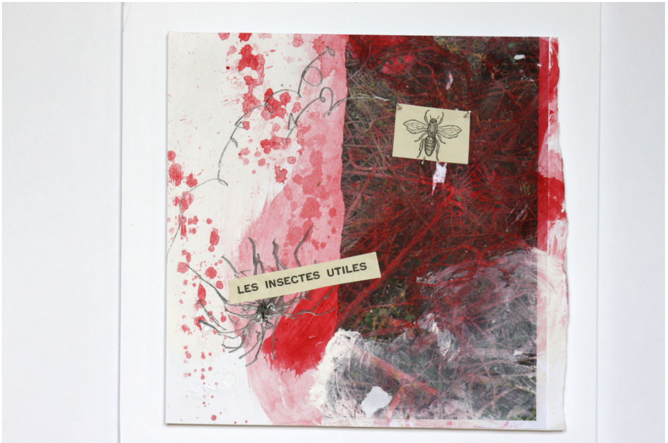
25x25 collage encre pigment