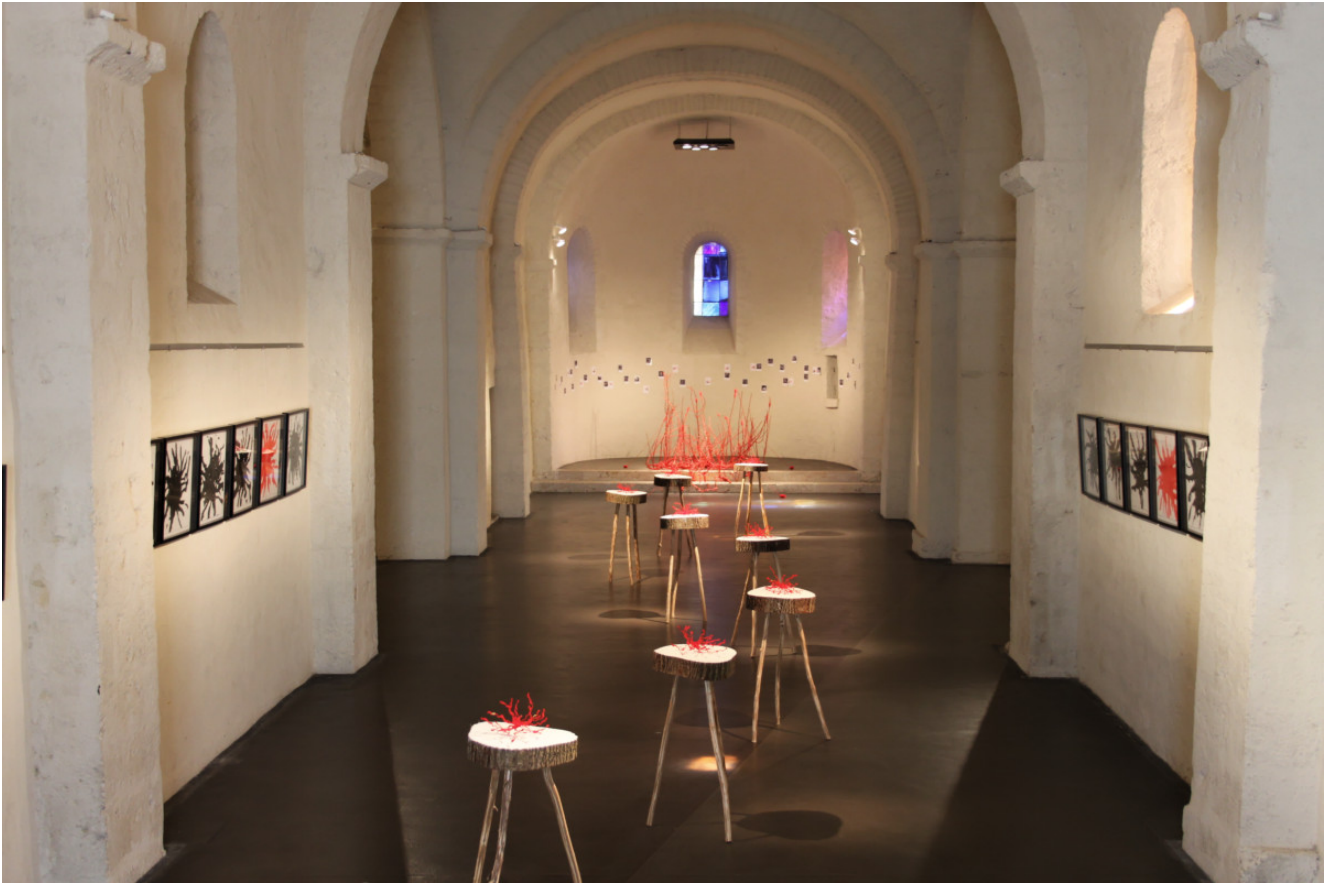
vue d'expo Eglise Saint Etienne Beaugency (45)