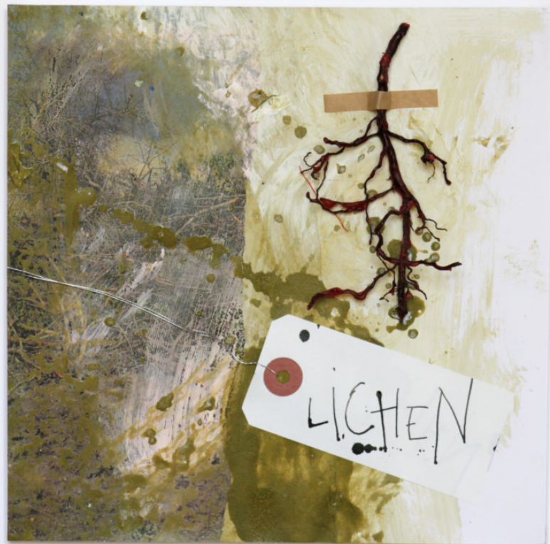
25x25 collage encre pigment