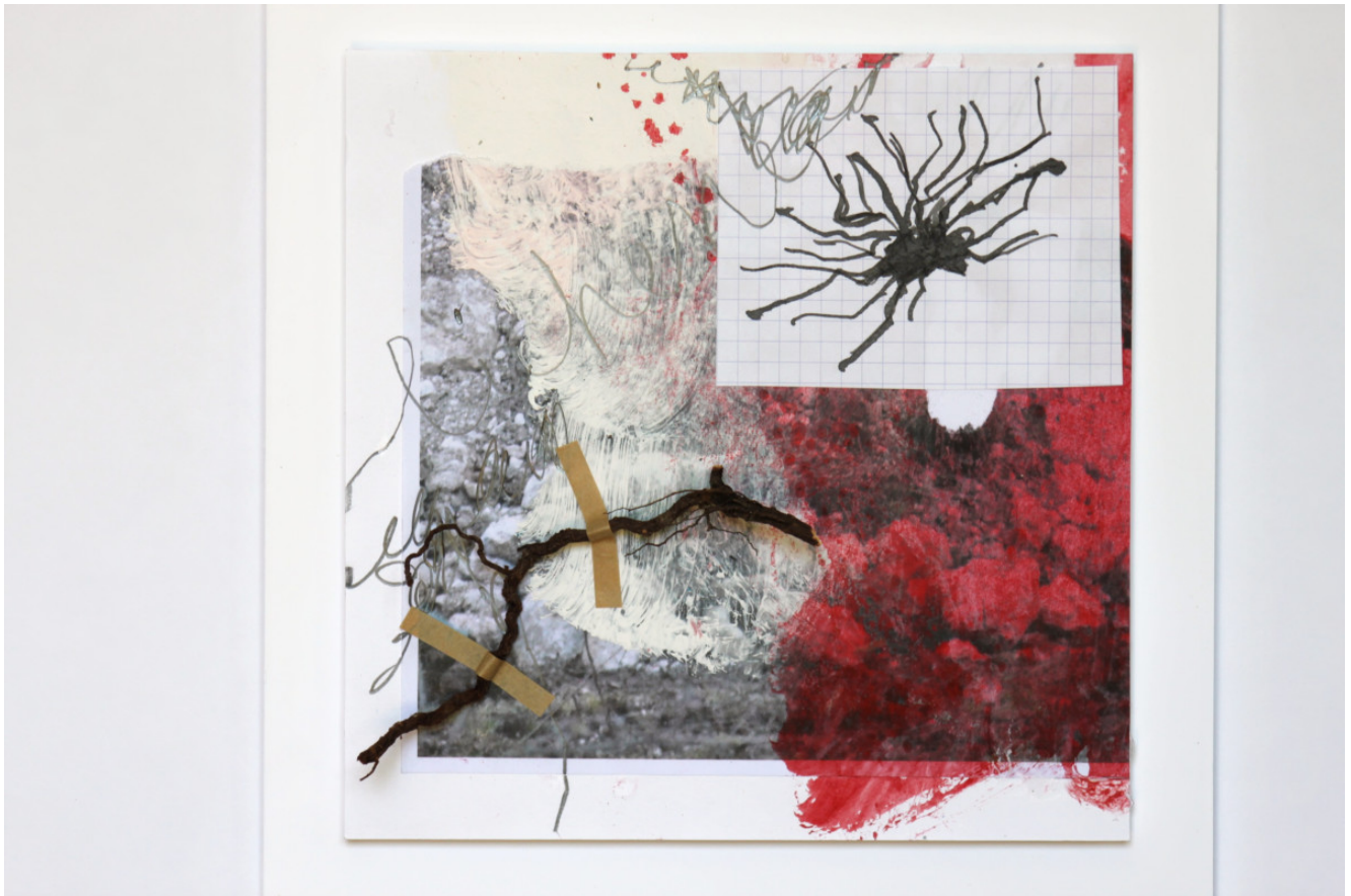
25x25 collage encre pigment