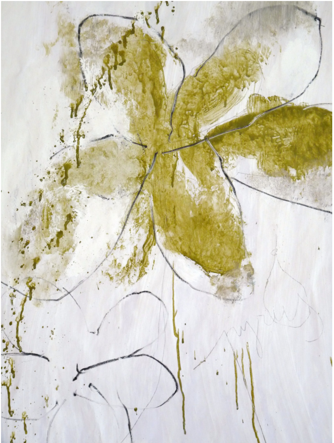
60×100 technique mixte sur papier