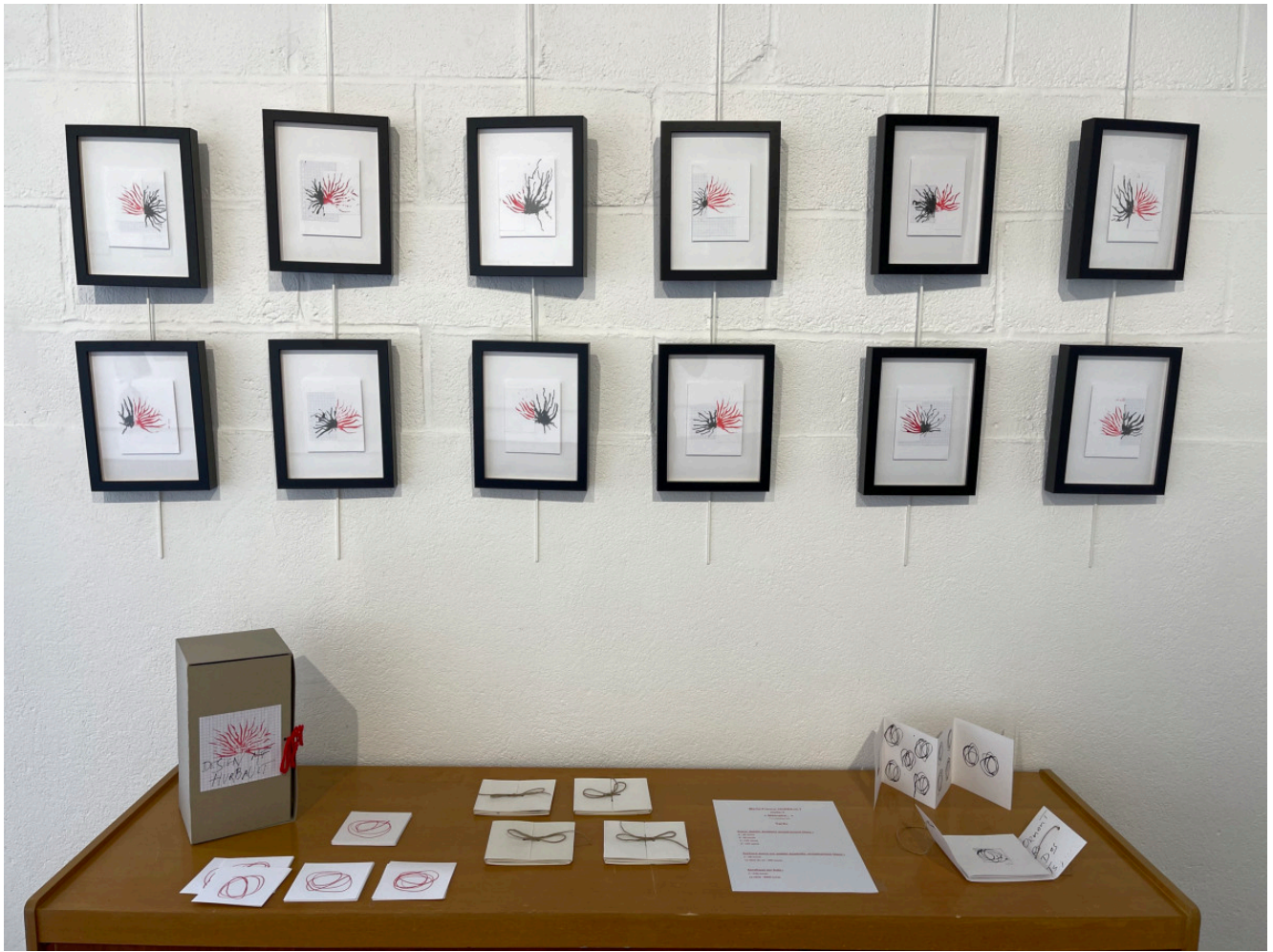
vue d'expo Atelier 6