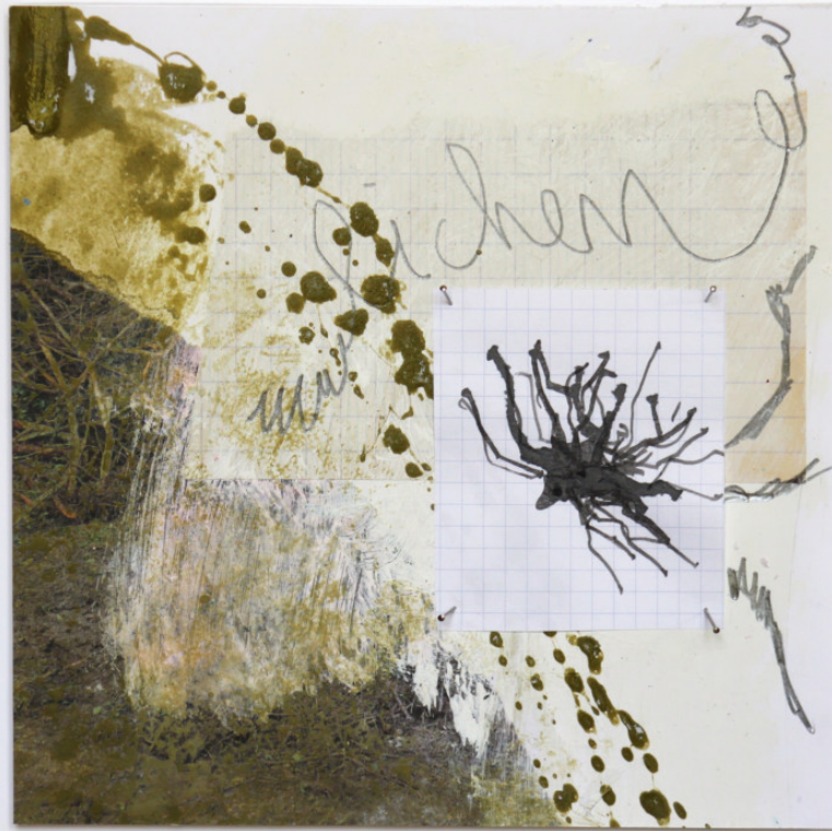
25x25 collage encre pigment