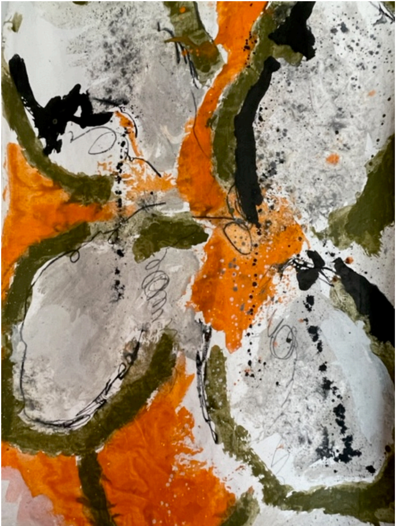
100×150 encre crayon pigment sur toile