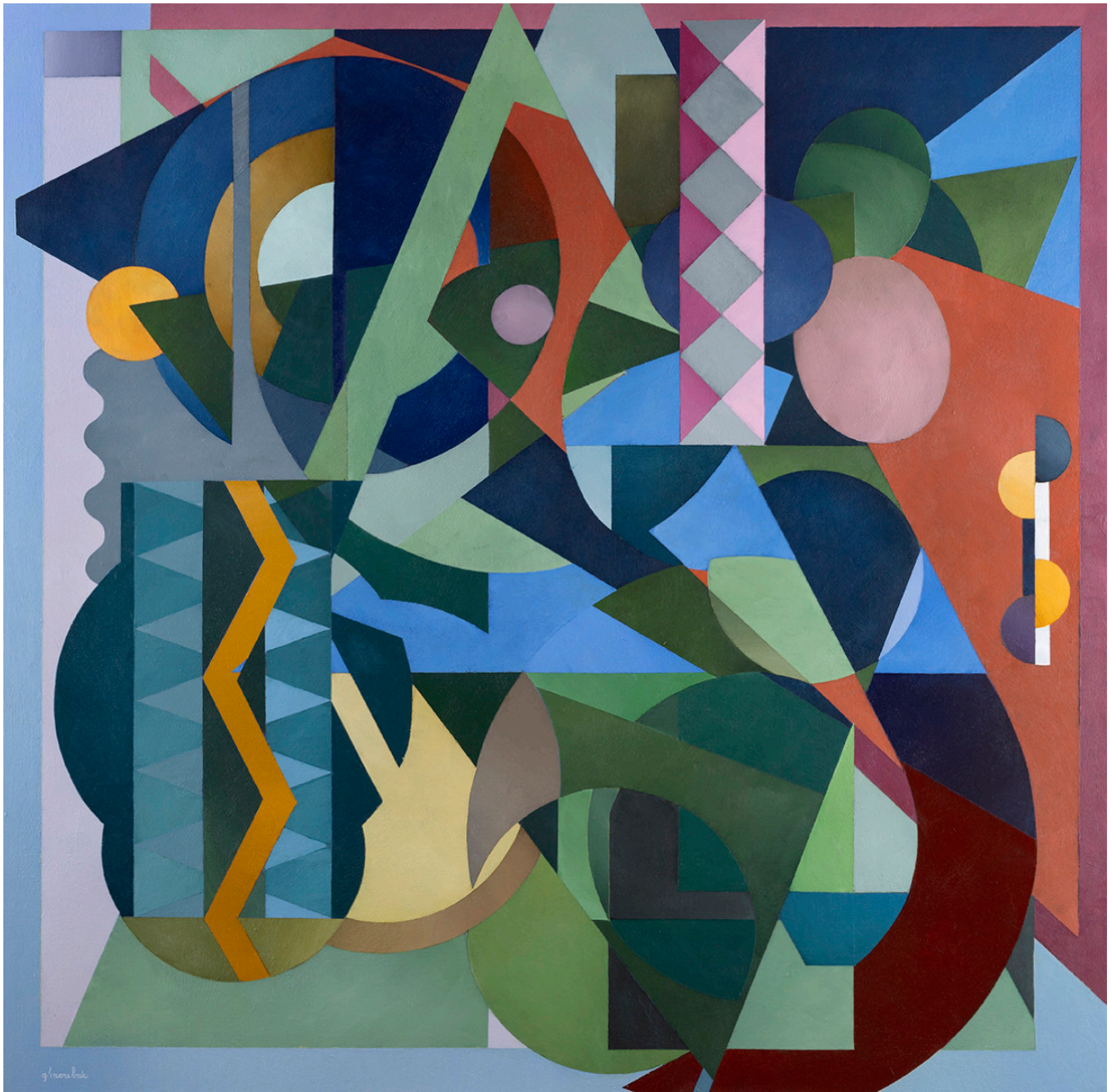
« Freedom road » Acrylique sur toile 120x120cm