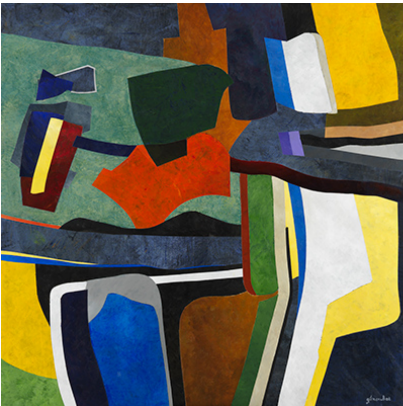
« Valparaiso » Acrylique sur toile 100x100cm