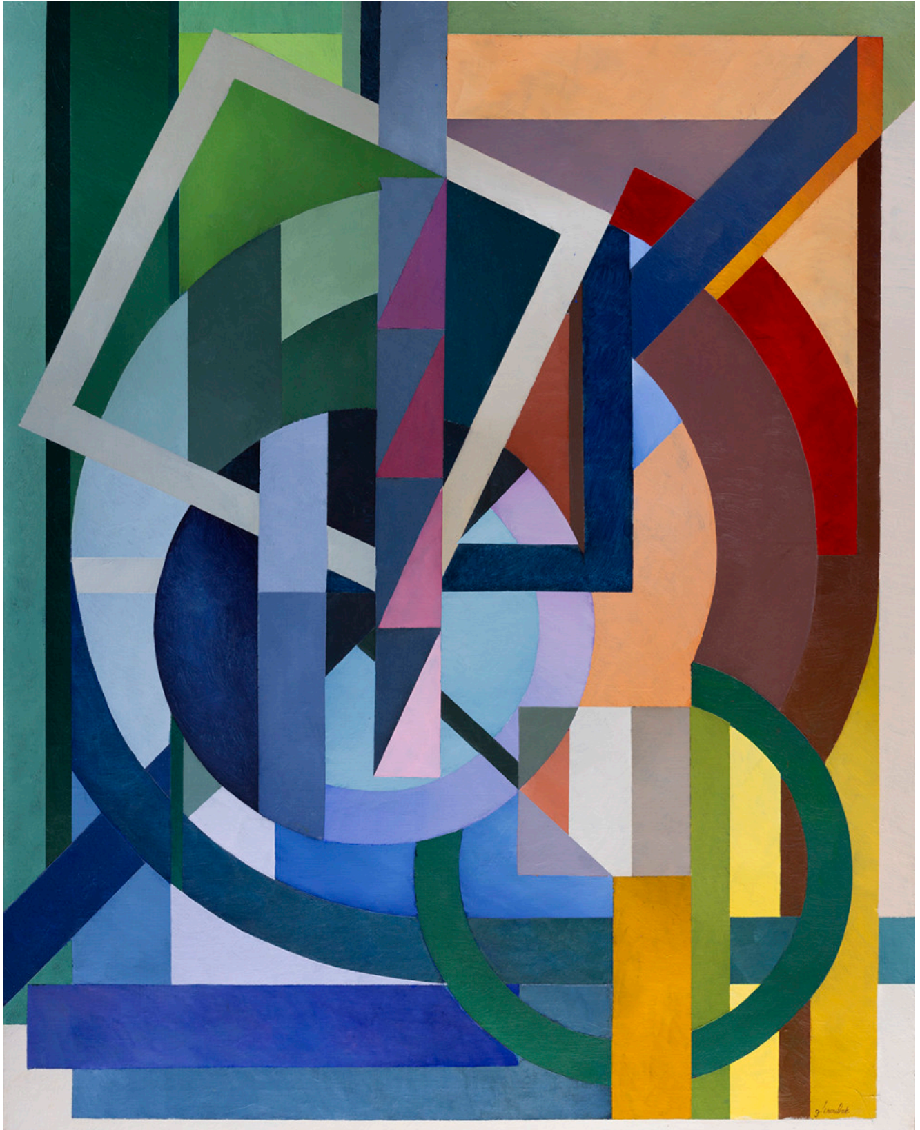
« Blue Gate » Acrylique sur toile 92x73cm