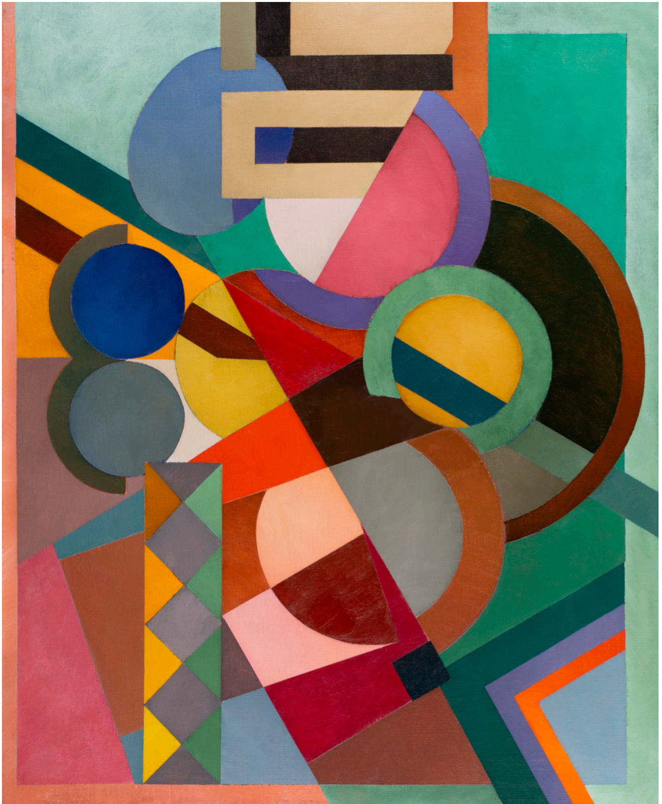
« CAMINITO » Acrylique sur toile 81x65cm