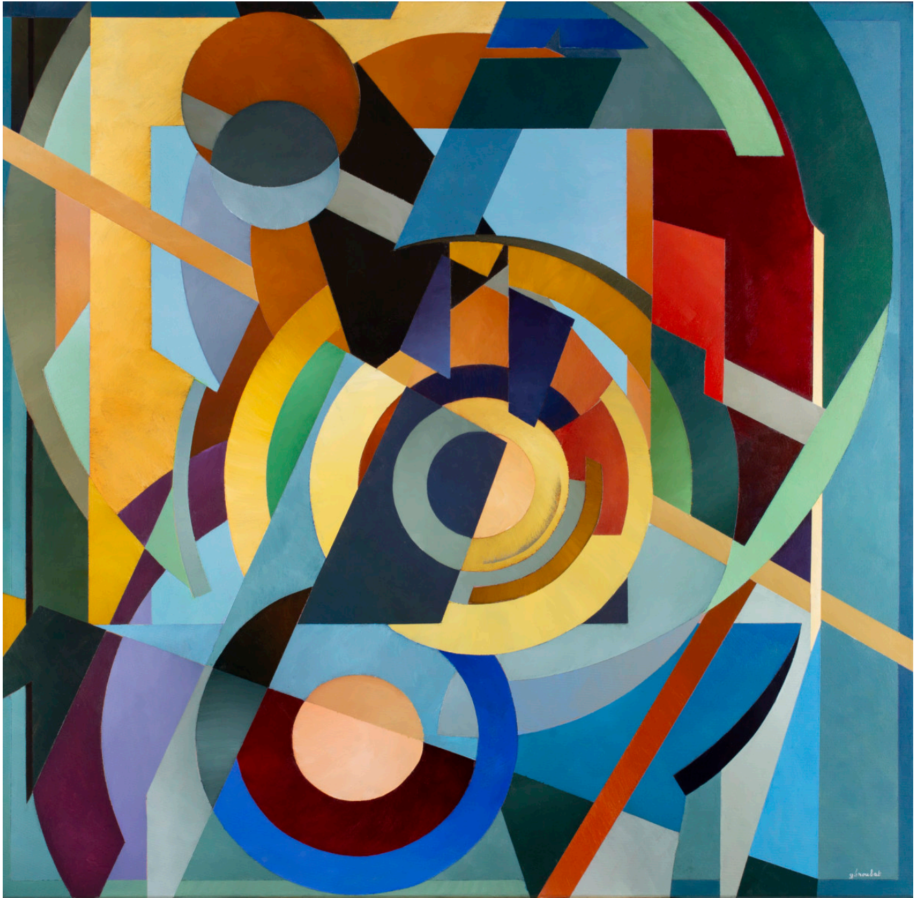
« ASTORIA » Acrylique sur toile 100x100cm