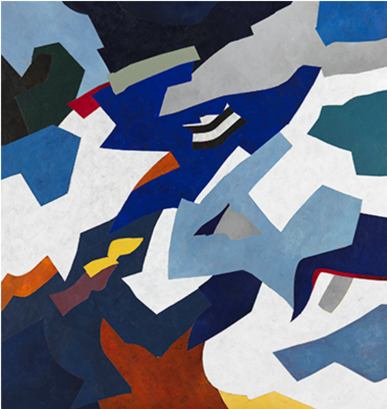
« Stairway to the Stars » Acrylique sur toile 100x100cm