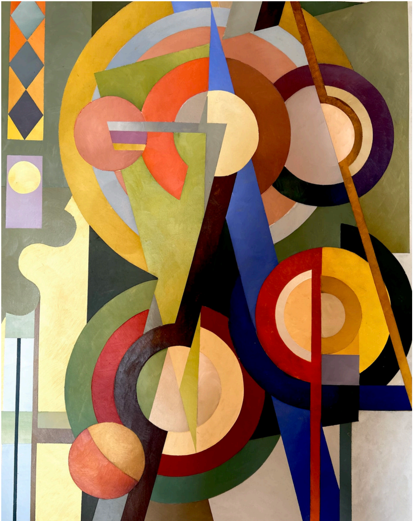
« LES METEORES » Acrylique sur toile 89x116cm