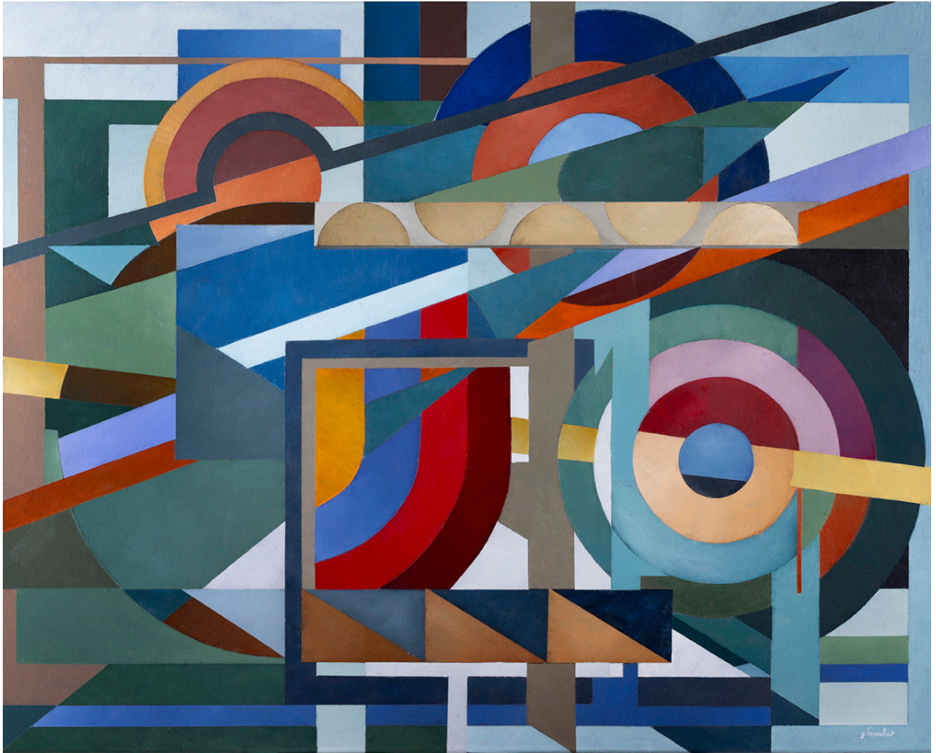
« Circle line » Acrylique sur toile 81x100cm