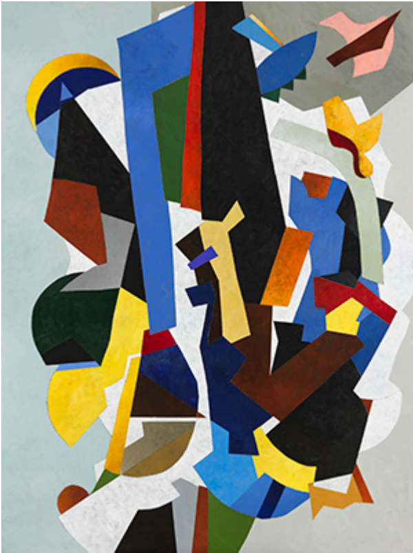
« Emergence » Acrylique sur toile 130x97cm