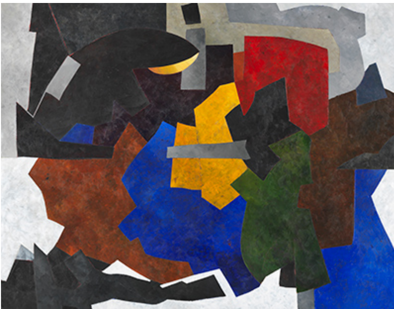
« Noirlac » Acrylique sur toile 89x116cm