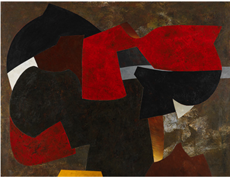
« Autumn Leaves (Les Feuilles Mortes) » Acrylique sur toile 89x116cm