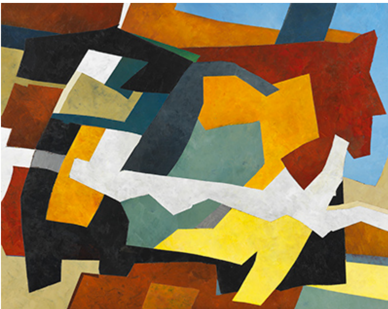
« Tinos » Acrylique sur toile 73x92cm