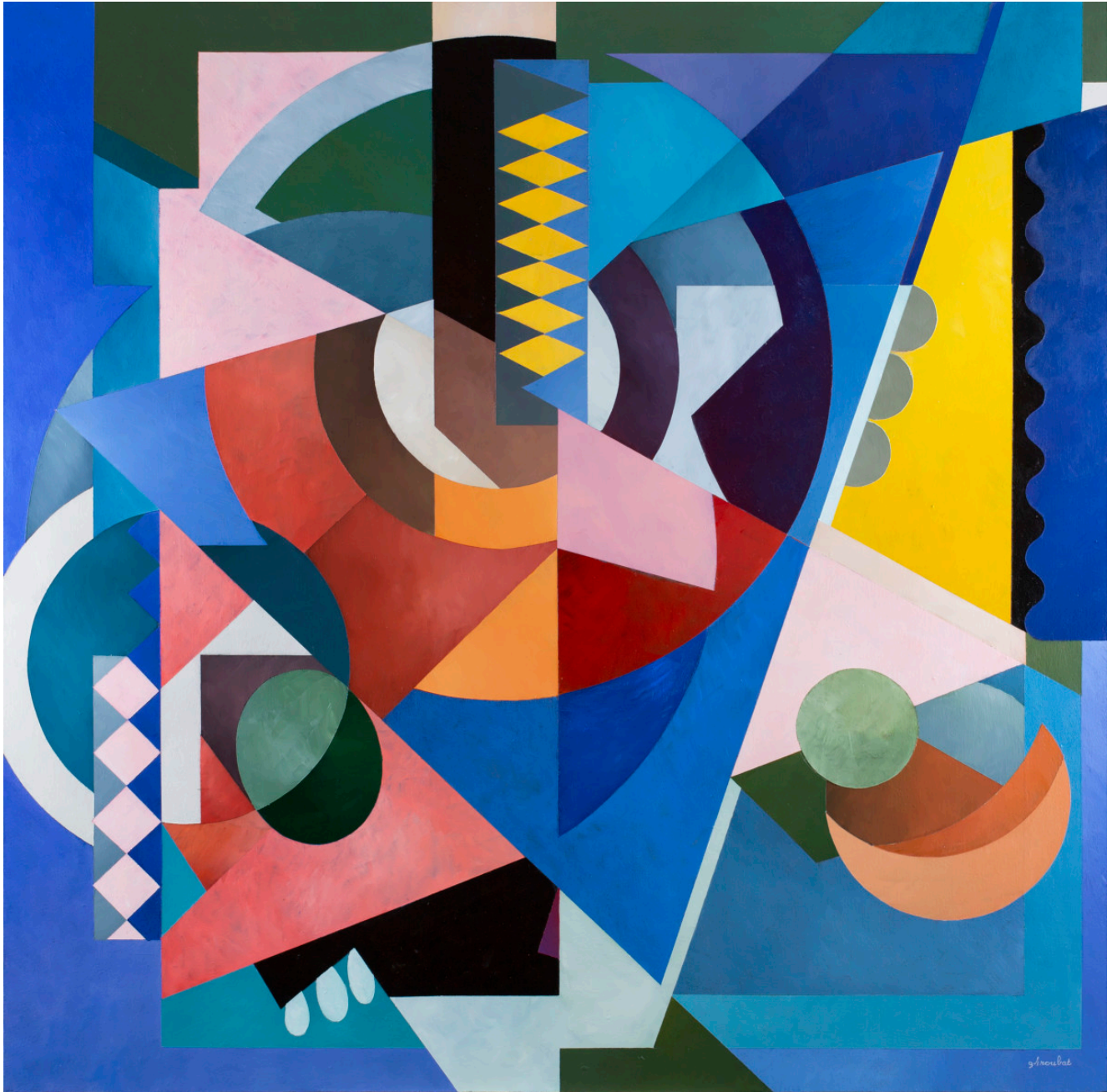
« AT3121 Bubble days » Acrylique sur toile 120x120cm