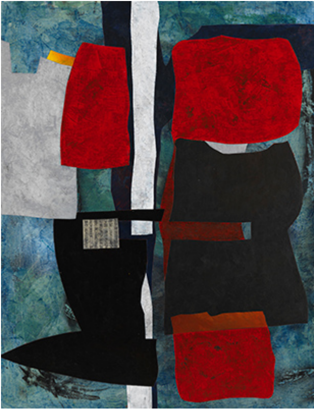
« Ultimate Red » Acrylique sur toile 116x89cm