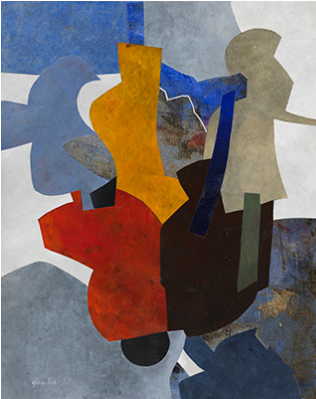
« La Conversation » Acrylique sur toile 73x92cm