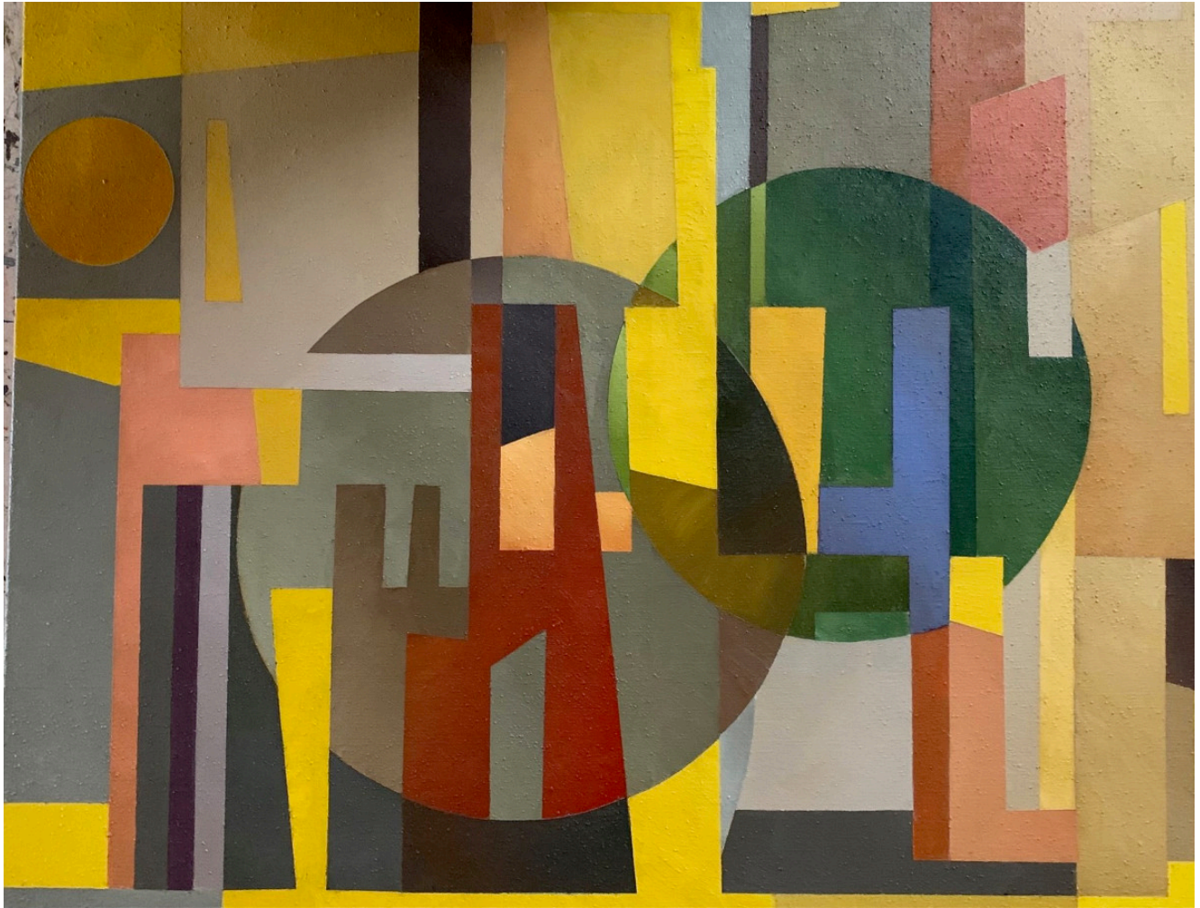
« RAMATUELLE » Acrylique sur toile 81x100cm