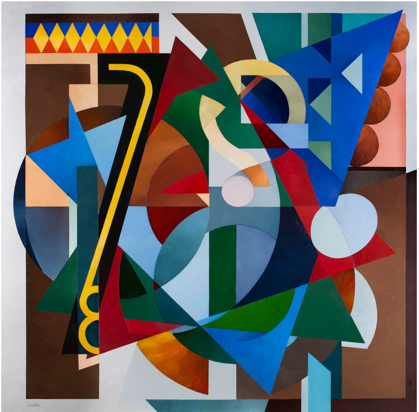
« AT3221 SWEET DREAMS » Acrylique sur toile 120x120cm