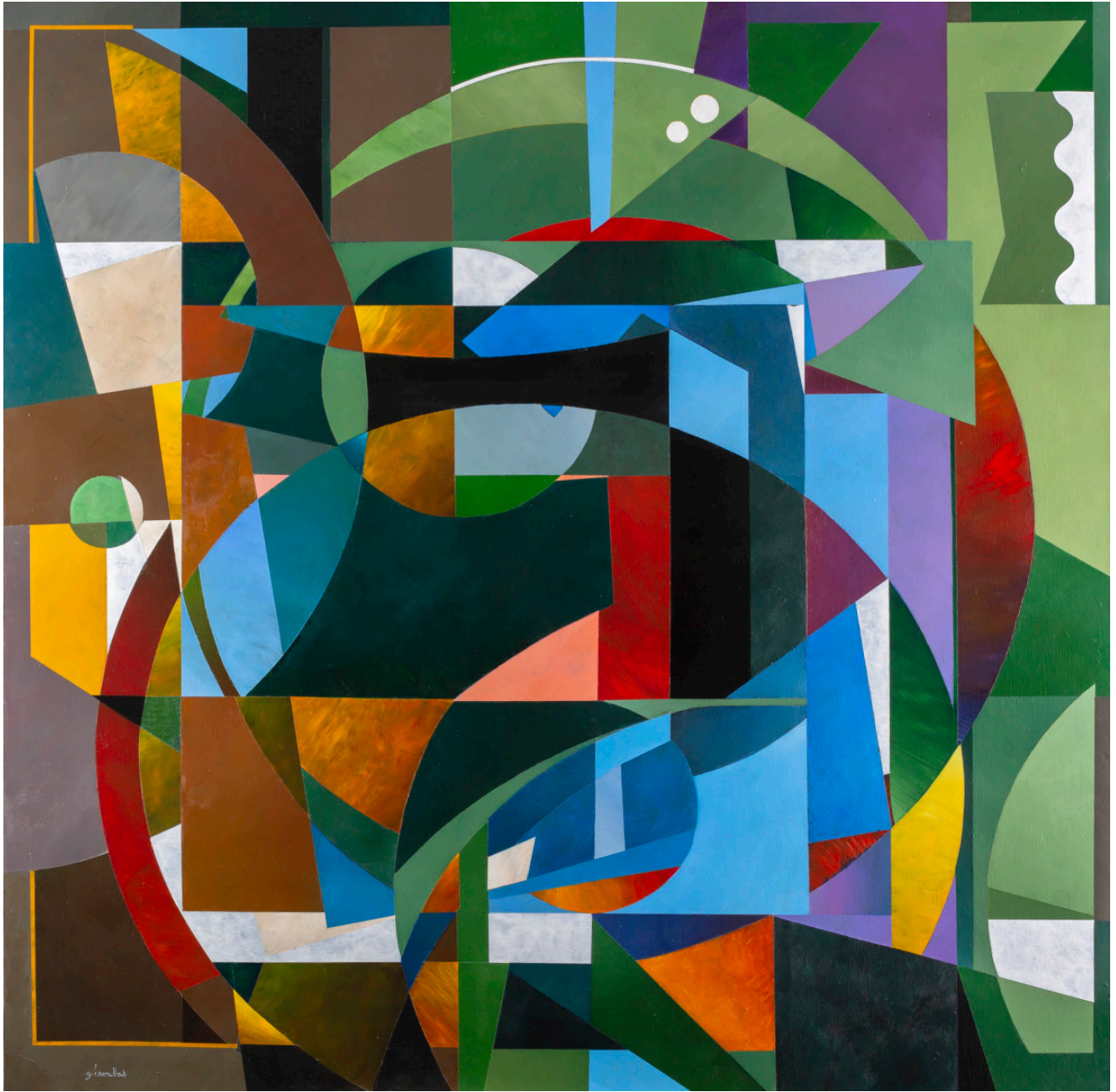
« Le cercle rouge » Acrylique sur toile 120x120cm