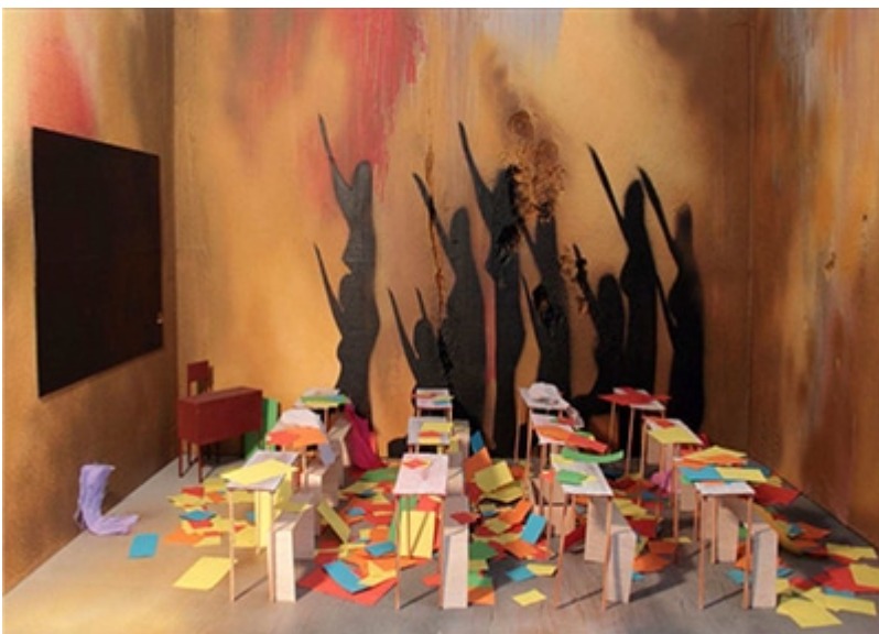
« Installation », Photographie numérique De l'enlèvement d'étudiantes au Nigeria par les islamistes au désert éducatif subi par les jeunes filles de certaines contrées (2014)