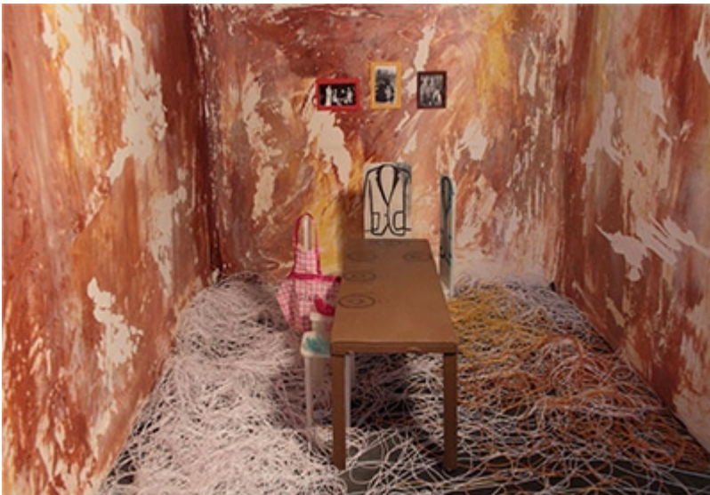
« Famille » Installation, Photographie numérique Série « lieux d'autorité » : scène de repas familial où les membres de la famille ont une place définie en fonction de celle du père (2015)