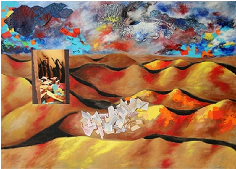
« Bring back our girls » Acrylique sur toile de lin brute, toile froissée cousue, collage papier et bois, photographie sur toile coton cousue, pastel à huile et encre, 150x100cm