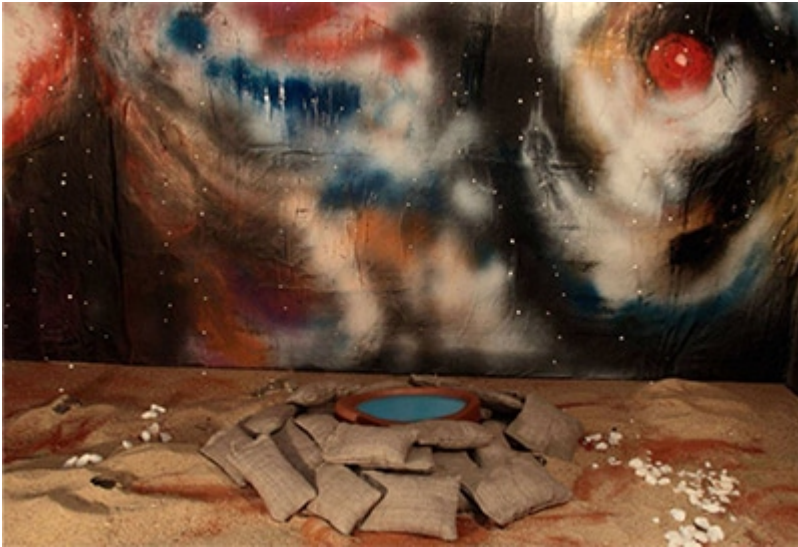
« Origine » Installation, Photographie numérique Aux origines de la vie sur terre (2015)