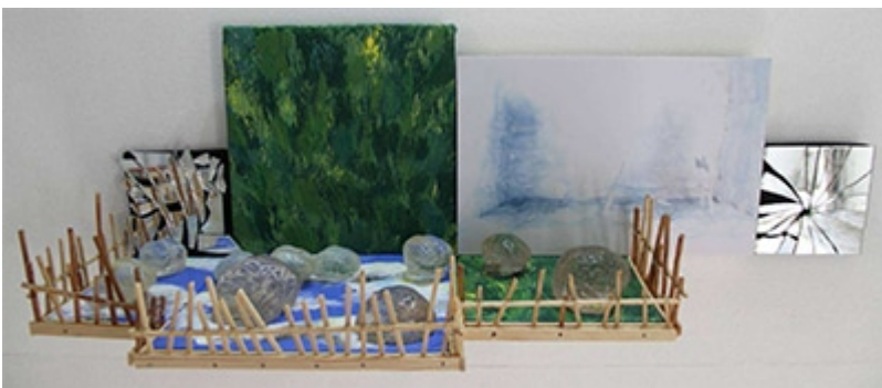
« Folie Intime » Structure murale avec assemblage de toile sur châssis, photographie numérique couleurs sur PVC, miroirs brisés collés sur bois peint, résine transparente, bois. 22x68x21cm Normalisation des limites de la folie. De leur évolution au fil des époques et de la difficulté à les comprendre, tant elles touchent à notre intimité (2015)