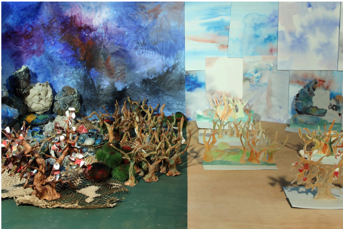
« Forêt cartonnée » Photographie numérique couleurs sur papier Fine Art 40x60cm (2020)