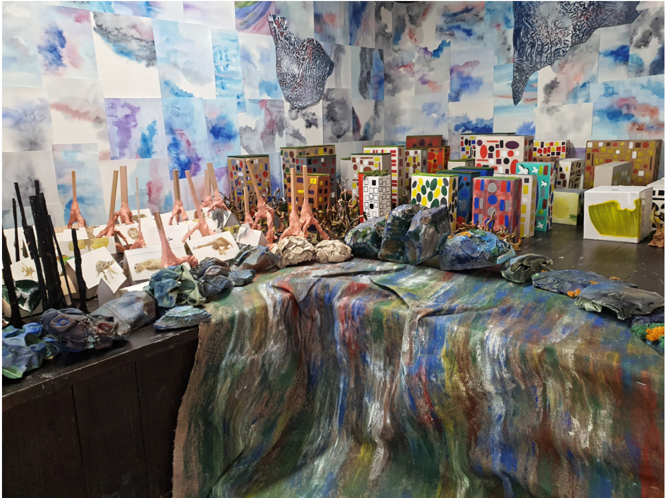
« Paysages » Installation bois, papier, aquarelle, collage, fil de laine (2020)