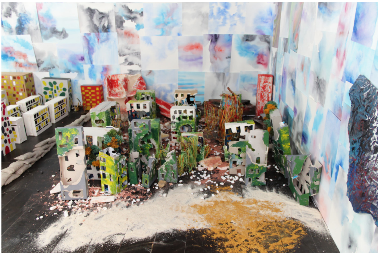
« Paysages » Installation bois, papier, aquarelle, collage, fil de laine (2020)