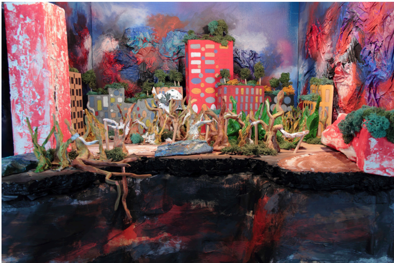
« Gouffre urbain » Photographie numérique couleurs sur papier Fine Art 50x75cm