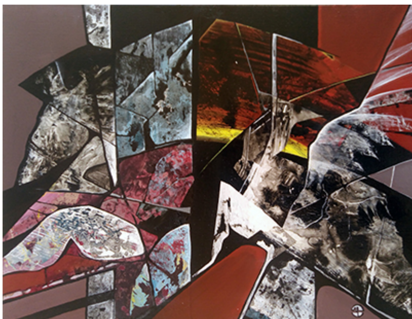
« Beast » Acrylique 65x50cm