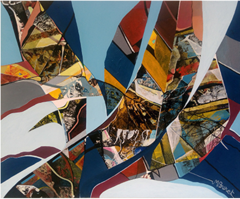
« Élytres » Acrylique 73x60cm