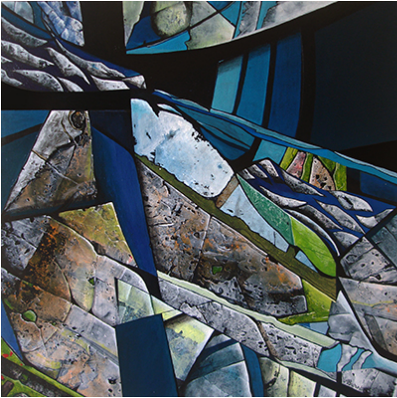
« Reach » Acrylique 120x120cm