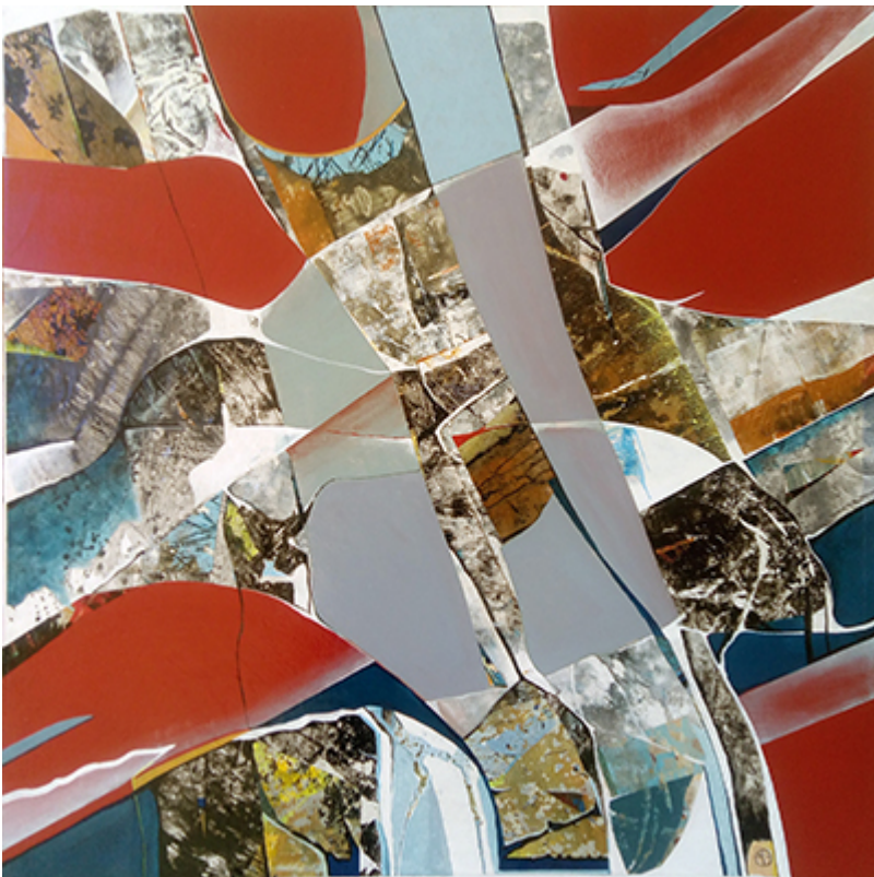
« Space rock » Acrylique 100x100cm