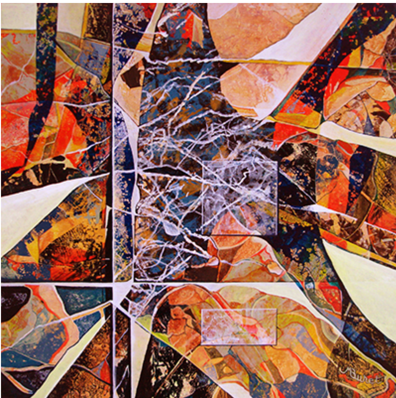
« L'écume des jours » Acrylique 80x80cm