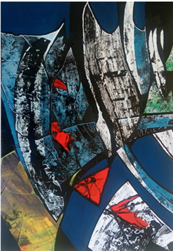
« Move » Acrylique 38x55cm