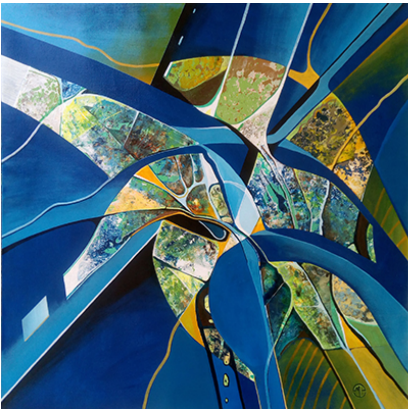
« Enigma » Acrylique 80x80cm