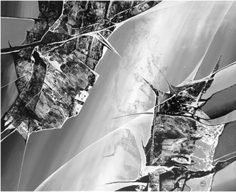
« Sirius » Acrylique 100x81cm