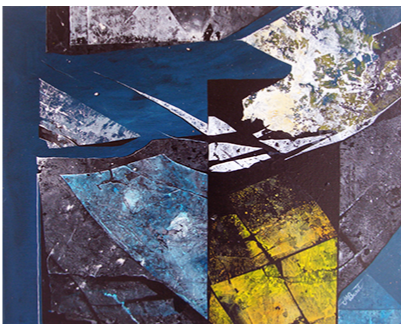
« Deep in space » Acrylique 81x65cm