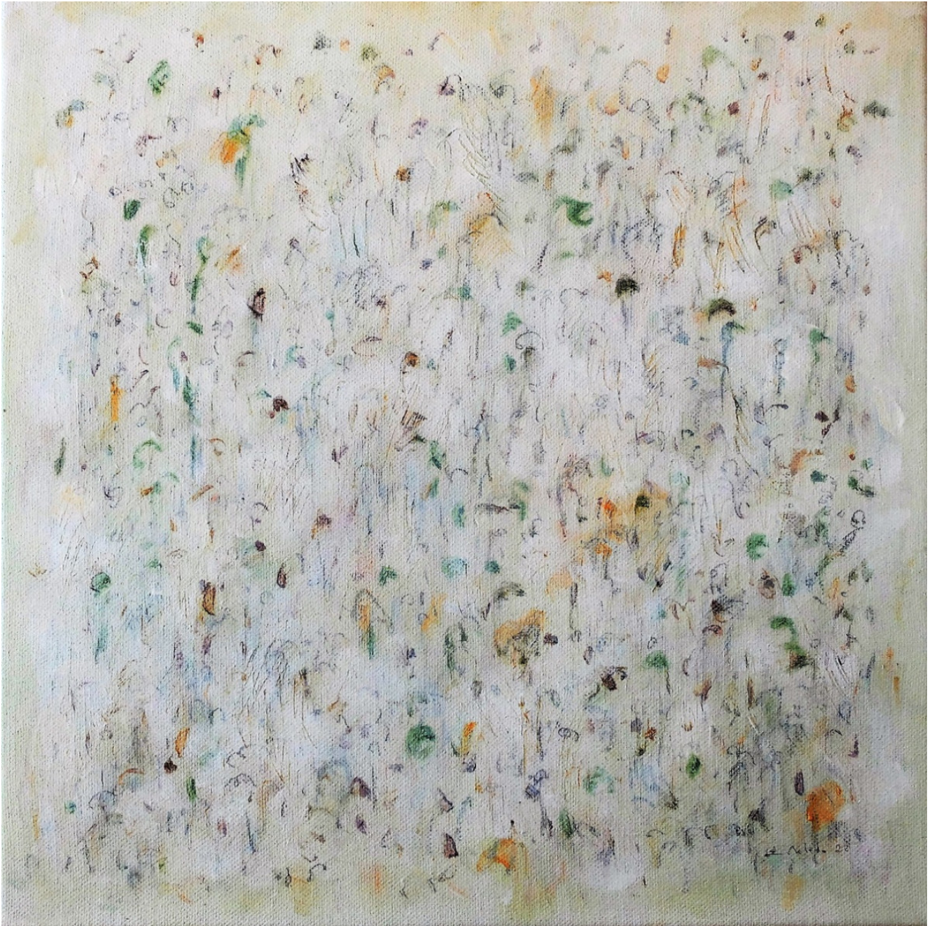
« Pois verts et ocres » 30X30cm Peinture sur toile – 2022