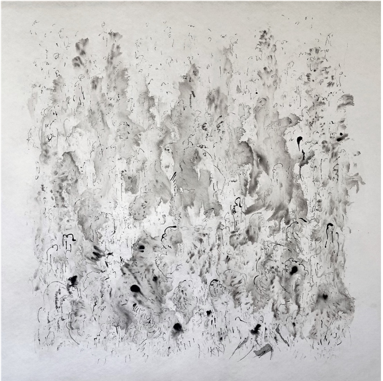
« Incendie » 80X80cm – Encre de Chine sur papier translucide – 2022