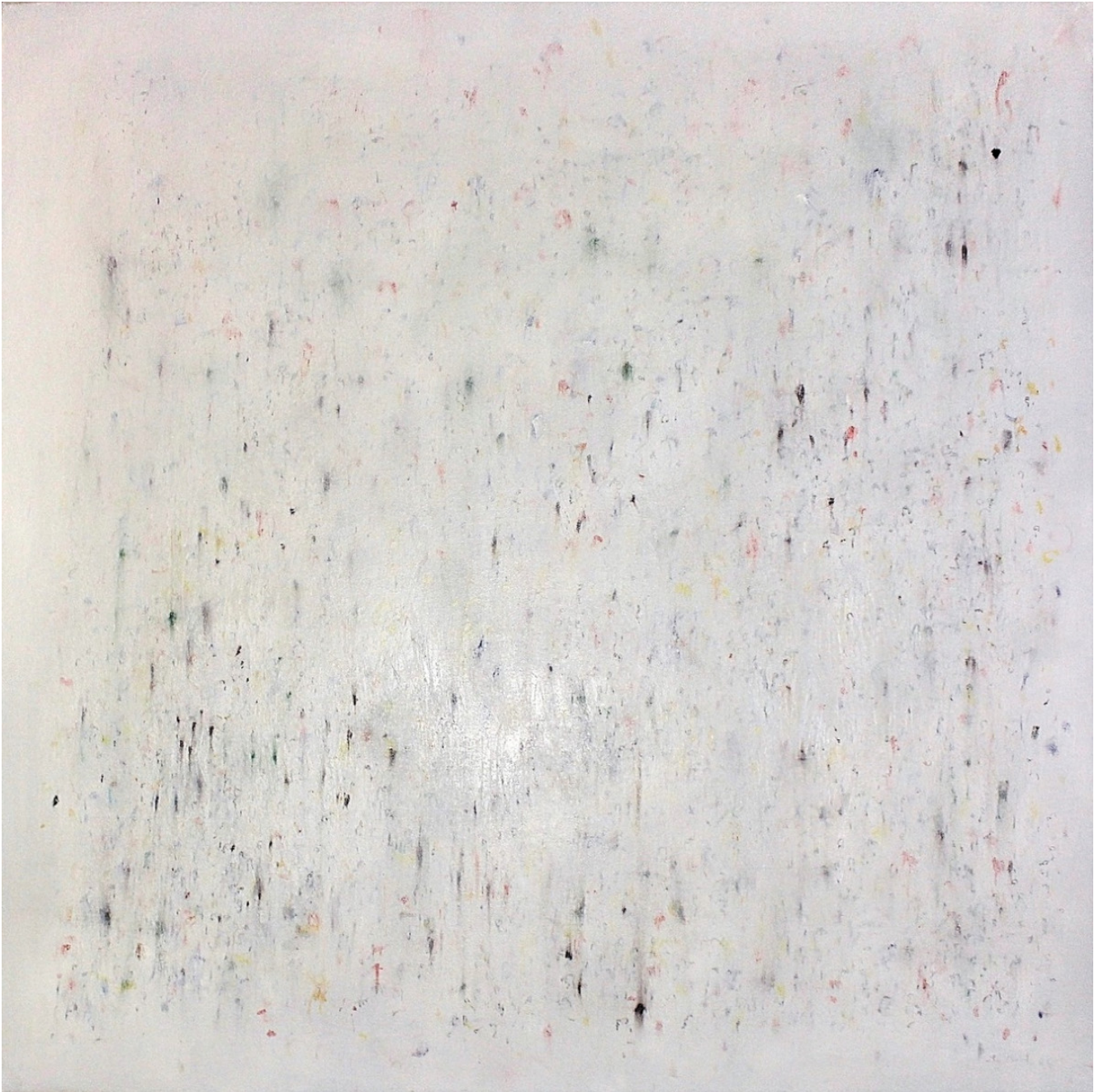
« Toile de septembre 22 » 80X80cm – Huile sur toile – 2022