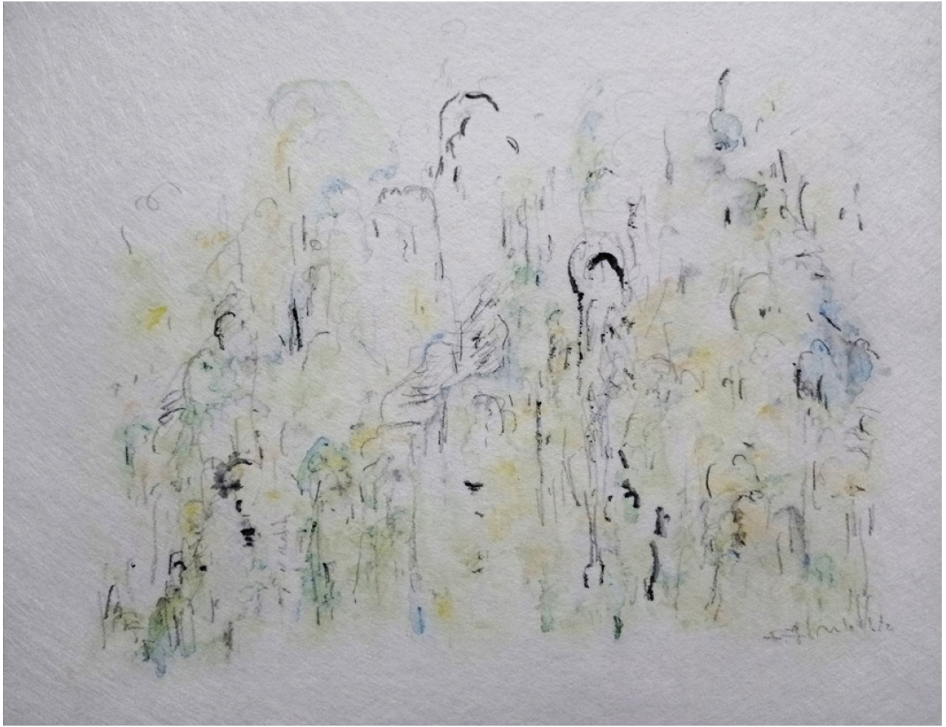
« Quinson » 20X25cm – Technique mixte sur papier – 2022