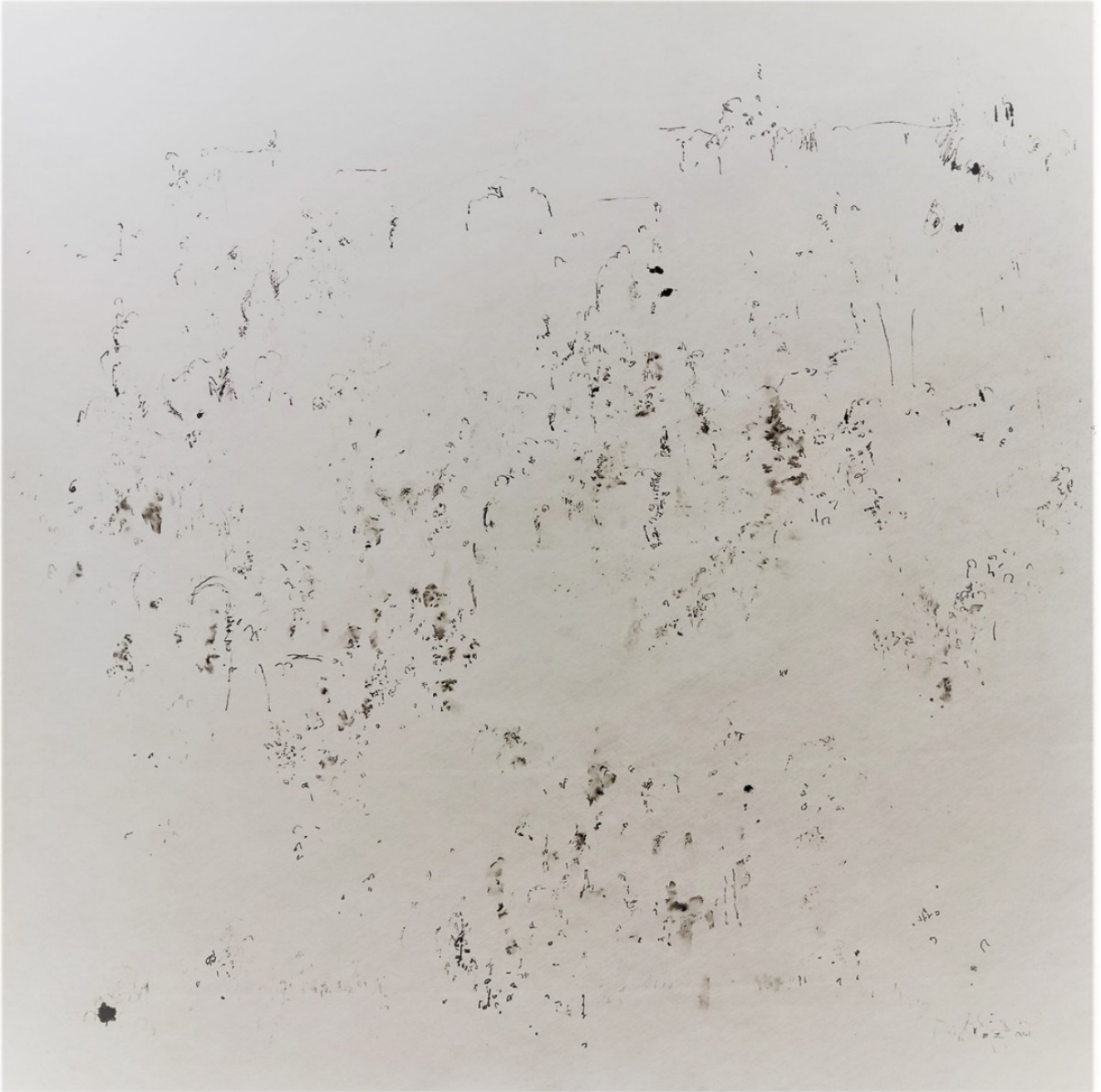
« Forêt devant la maison » 90X90cm – Encre de Chine sur papier translucide – 2022