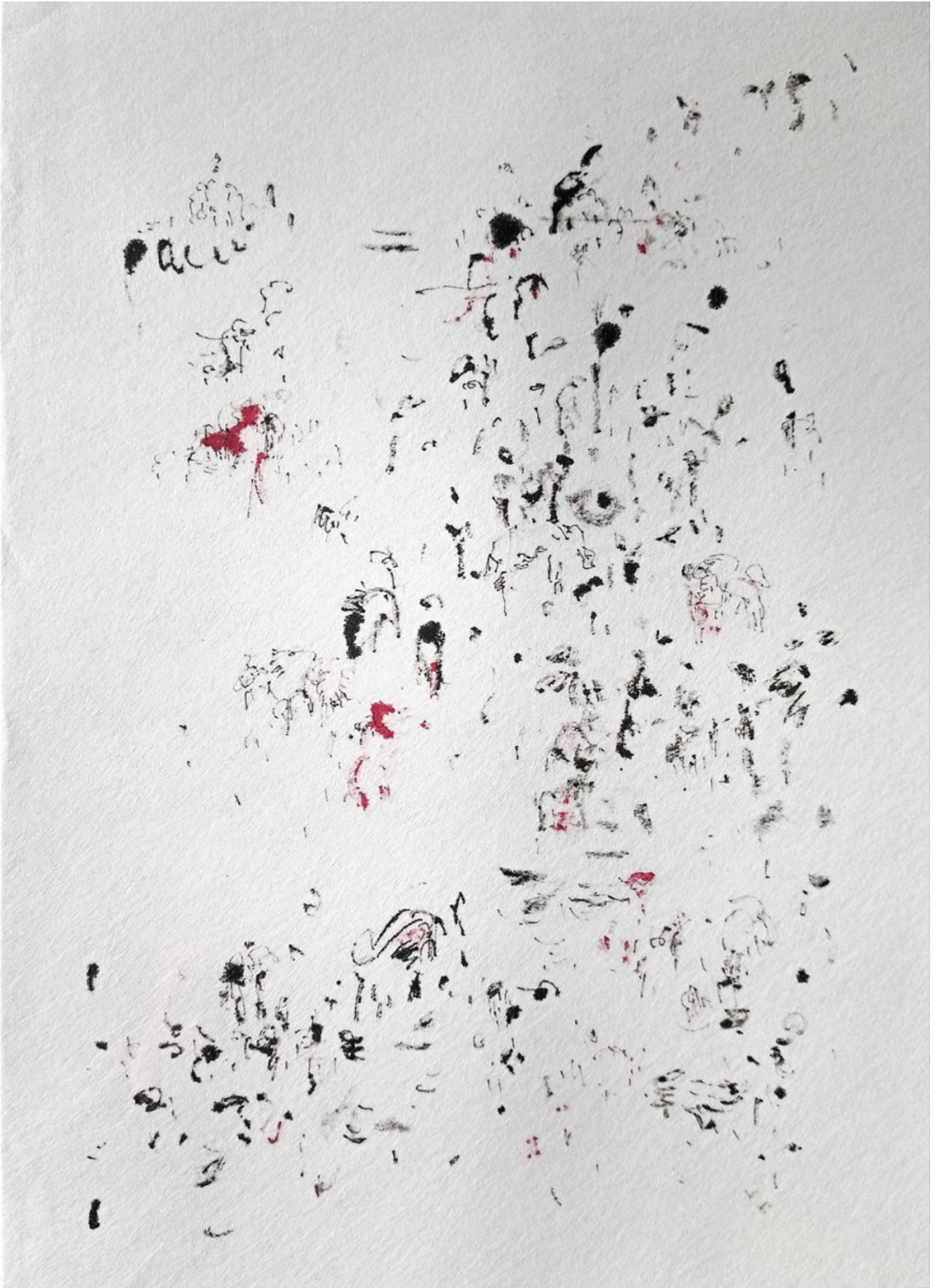
« Un 13 avril 2023 » 28X20cm – Encres de Chine sur papier – 2023