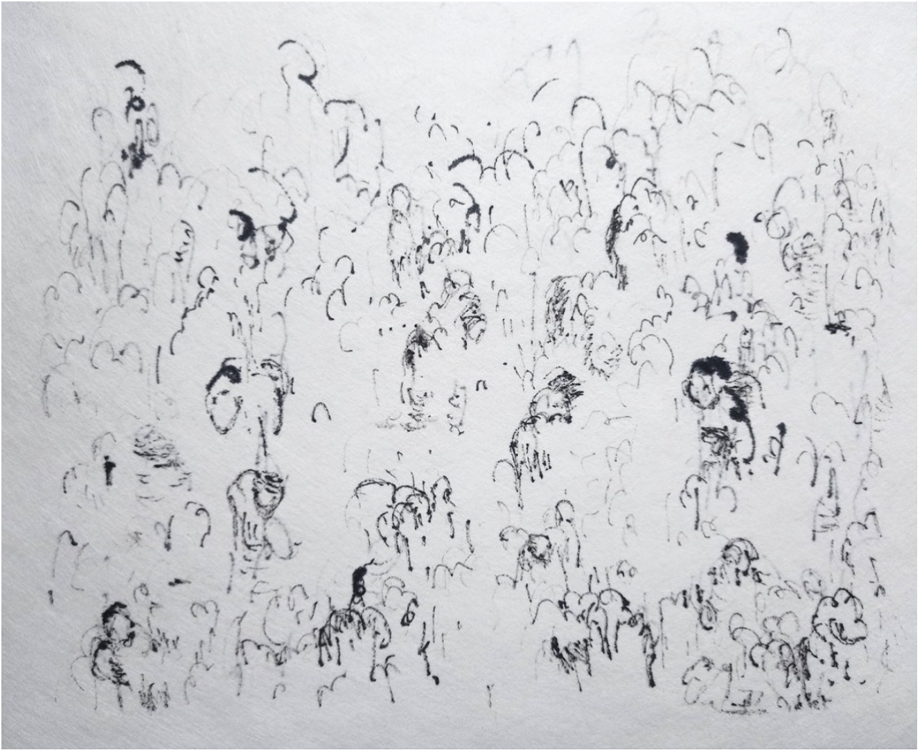
« L'abeille » 23X27cm – Encre de Chine sur papier – 2023