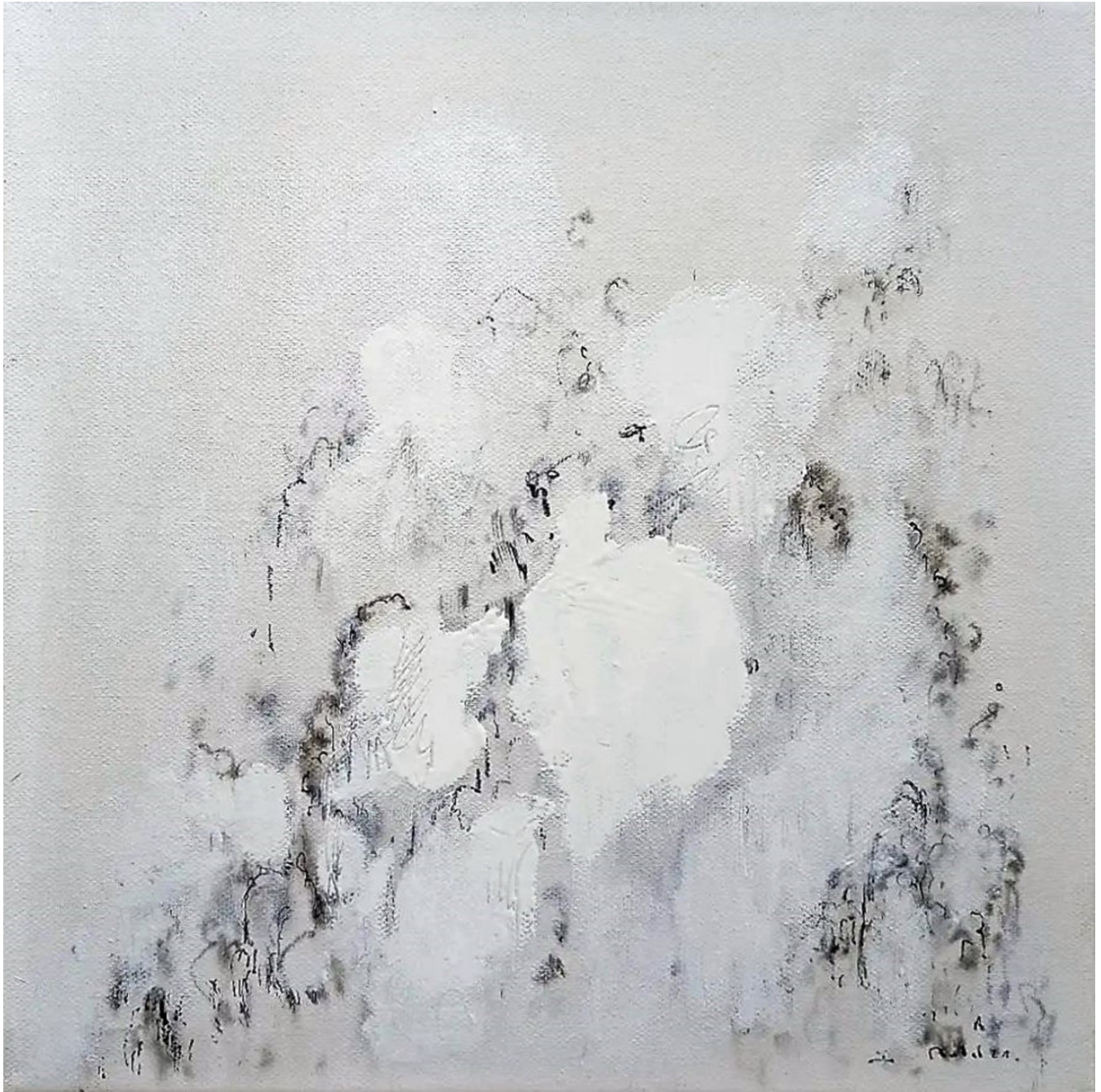
« Boules blanches » 30X30cm – Peinture et encre sur toile – 2022