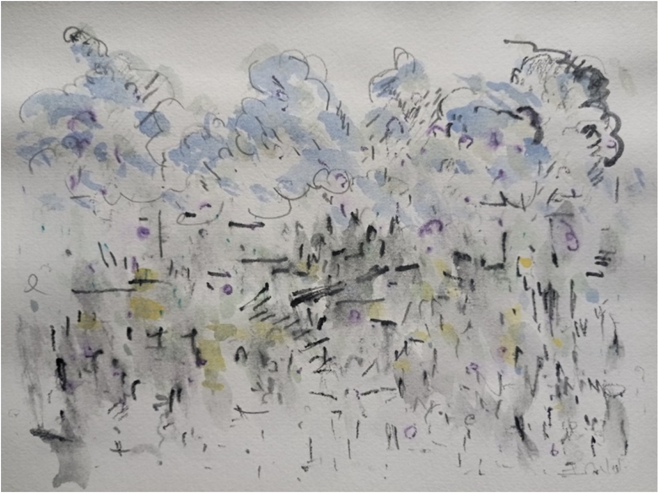
« Arbres bleus de mai » 15X20cm – Technique mixte sur papier de gravure – 2023