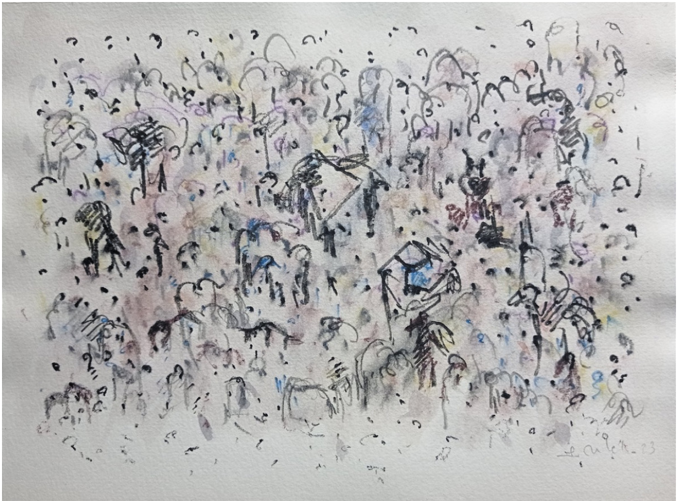
« Autour de la table » 15X20cm – Techniques mixtes sur papier de gravure – 2023