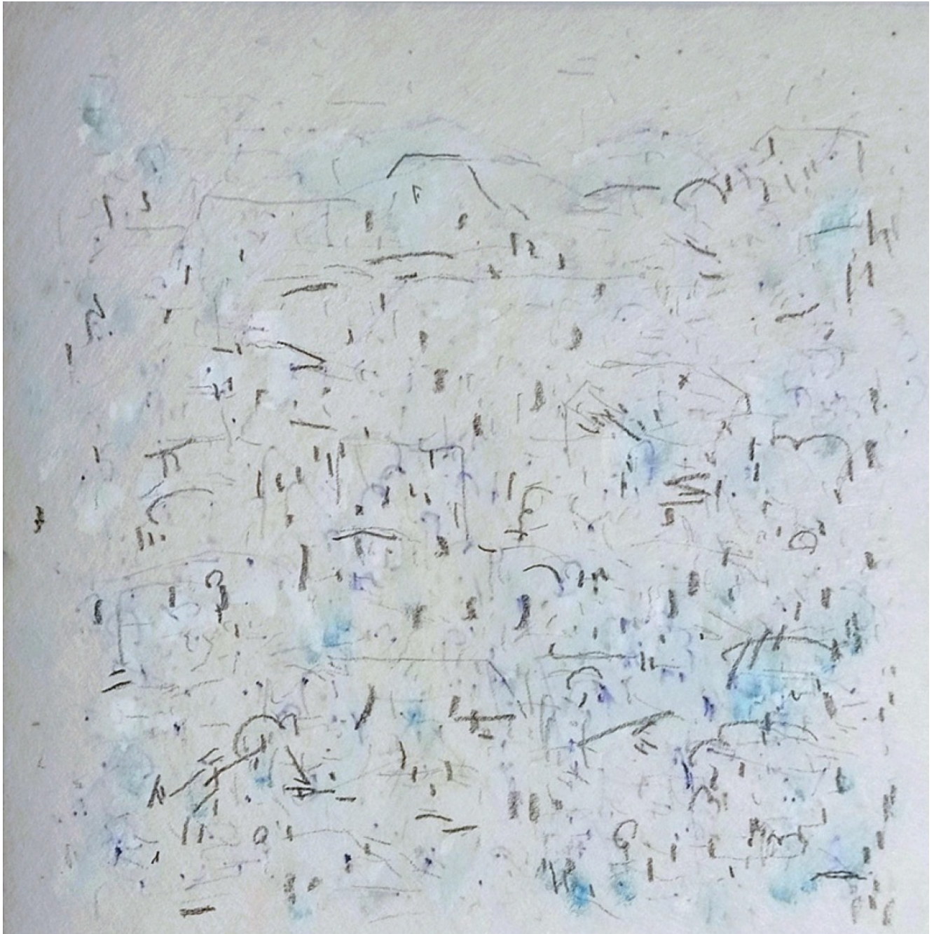
« Neige bleue » 20X20cm – Technique mixte sur papier – 2024