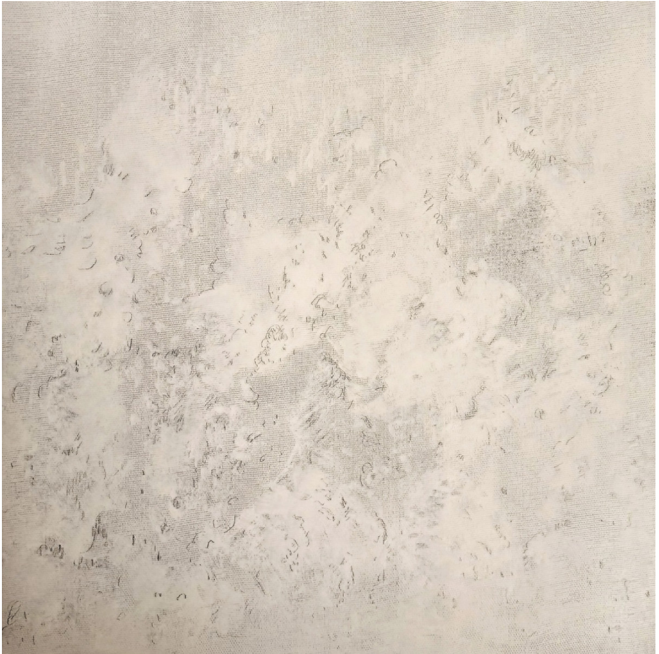
« Nuages » 40X40cm – Technique mixte sur toile – 2023