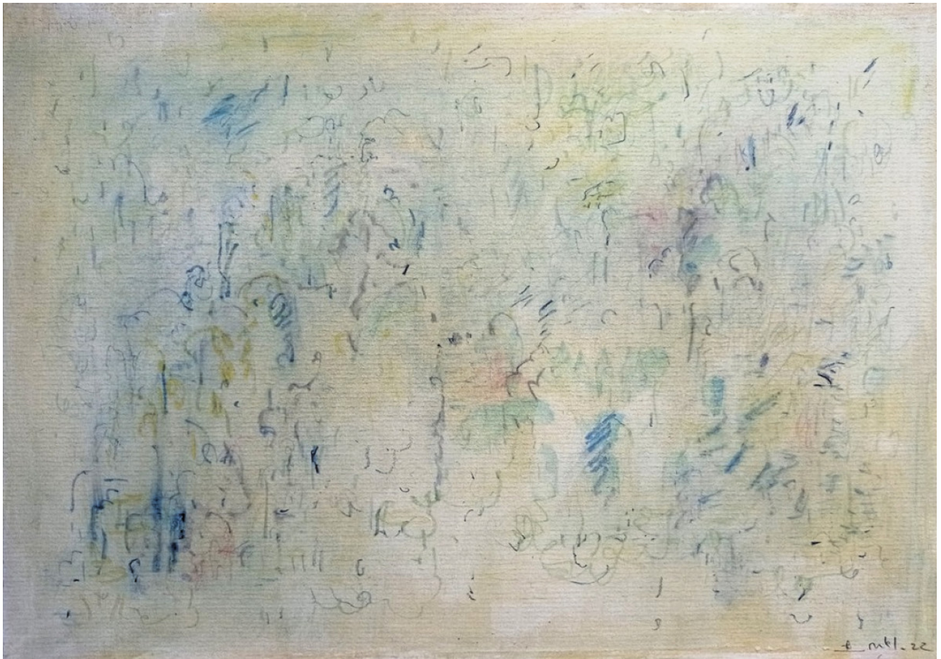
« Voile jaune » 20X29cm – Technique mixte sur carton – 2022