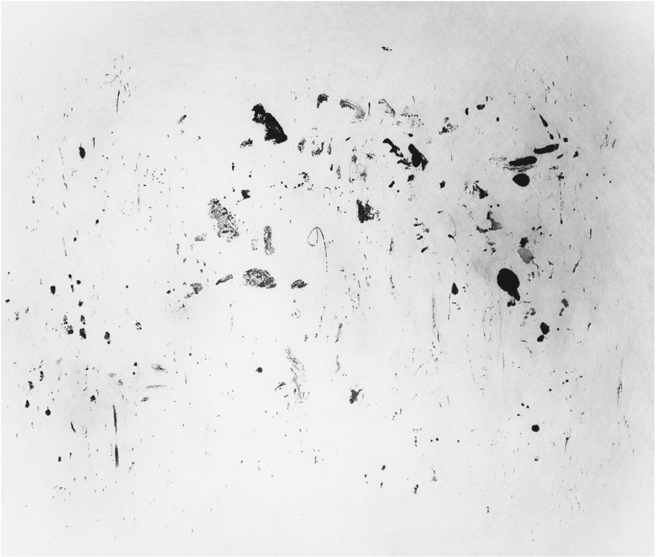
« Le lapin et son ombre » 60X72cm – Encre de Chine sur papier – 2023