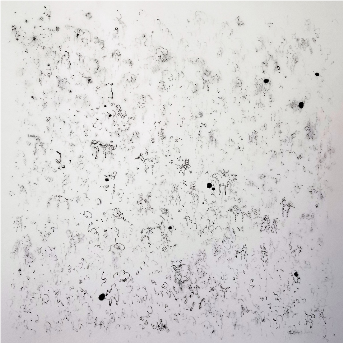
« L'envers du tableau » 70X70cm – Encre sur papier translucide – 2021