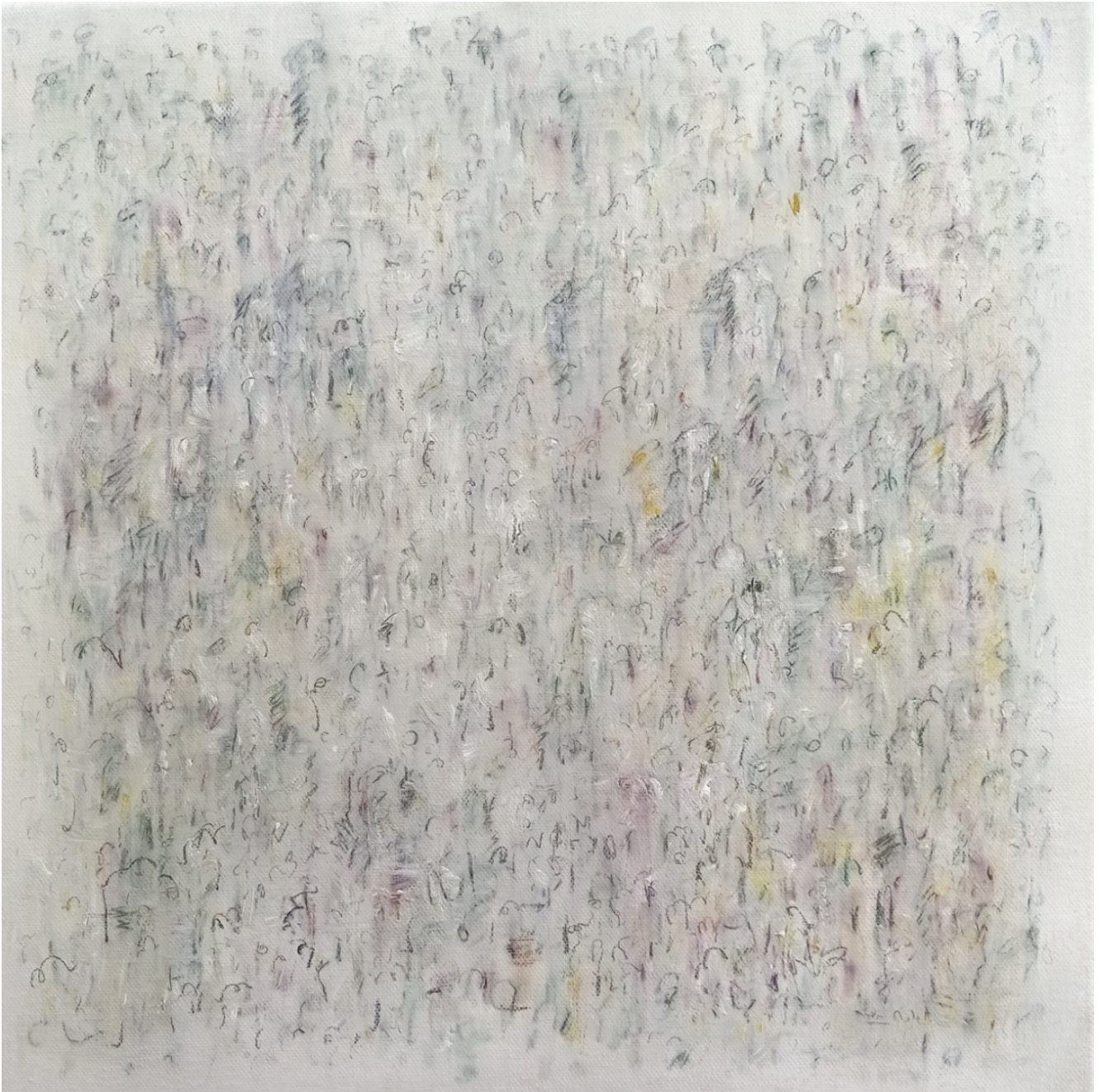
« 16 août 22 » 40X40cm – Peinture à l'huile et crayon sur toile – 2022