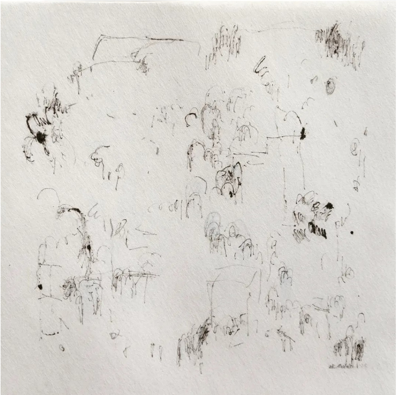
« Village méditerranéen » 25X25cm – Encre de Chine sur papier – 2021