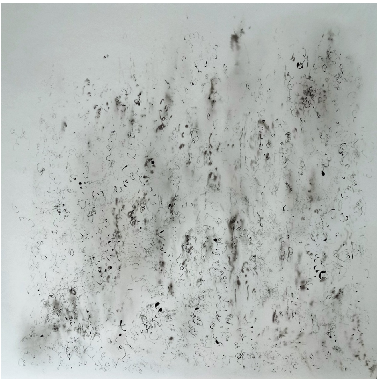
« Espace 12 10 20 » 100X100cm – Finaliste ARTE LAGUNA PRIZE 2021 – Encre + crayon sur papier translucide