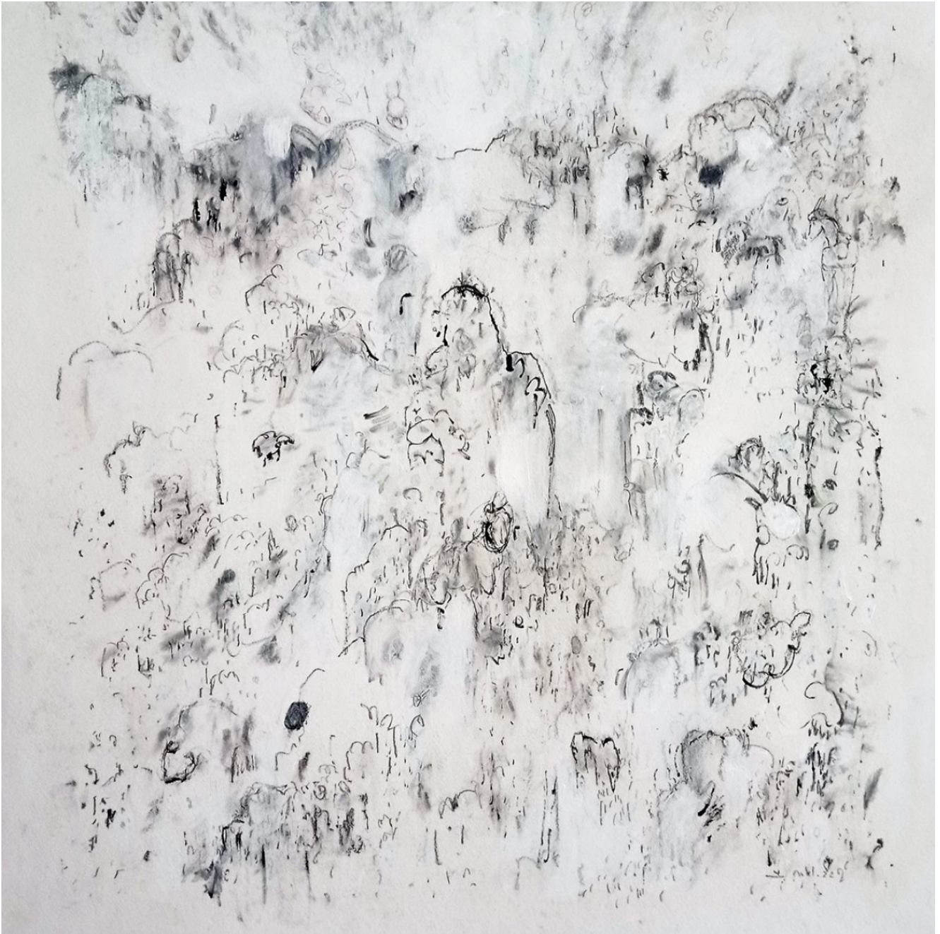
« La montagne blanche » 50X50cm – Technique mixte – 2022