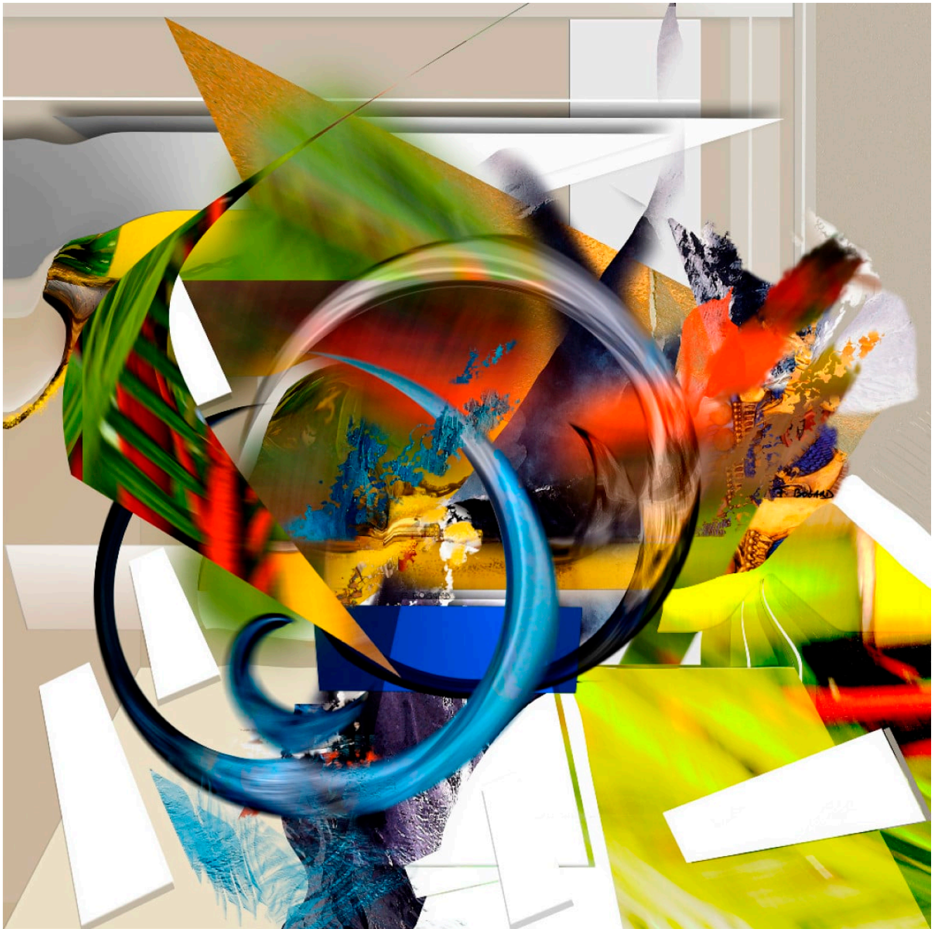
Série des entrelacs / Entrelacs 40.4 – 100x100cm – 2010/2023