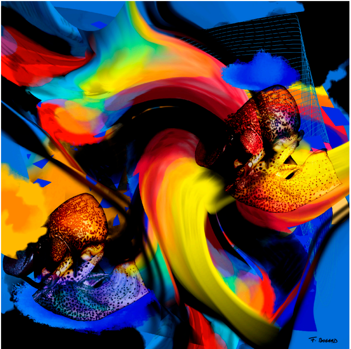
Série Introspection – Introspection 18-02 – 100x100cm – 2023