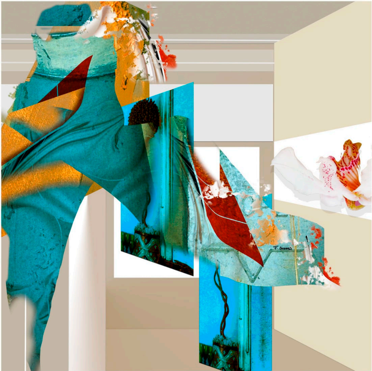
Série des entrelacs – Entrelacs 31 – 100x100cmm – 2010/2023