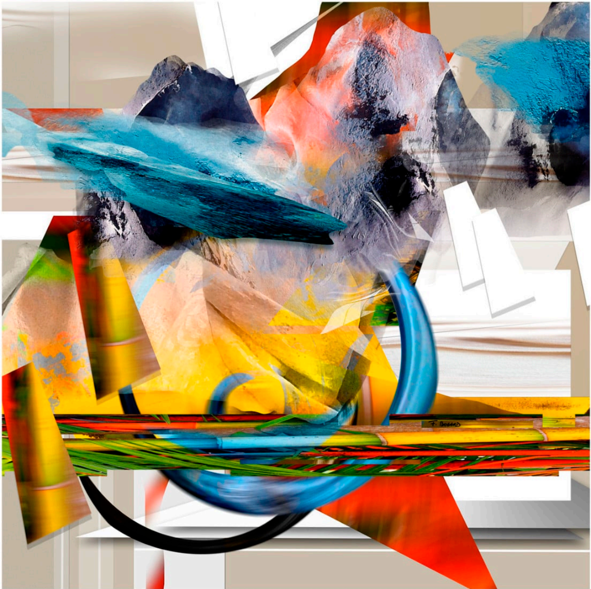
Série des entrelacs – Entrelacs 37-4 100x100cm – 2010/2023