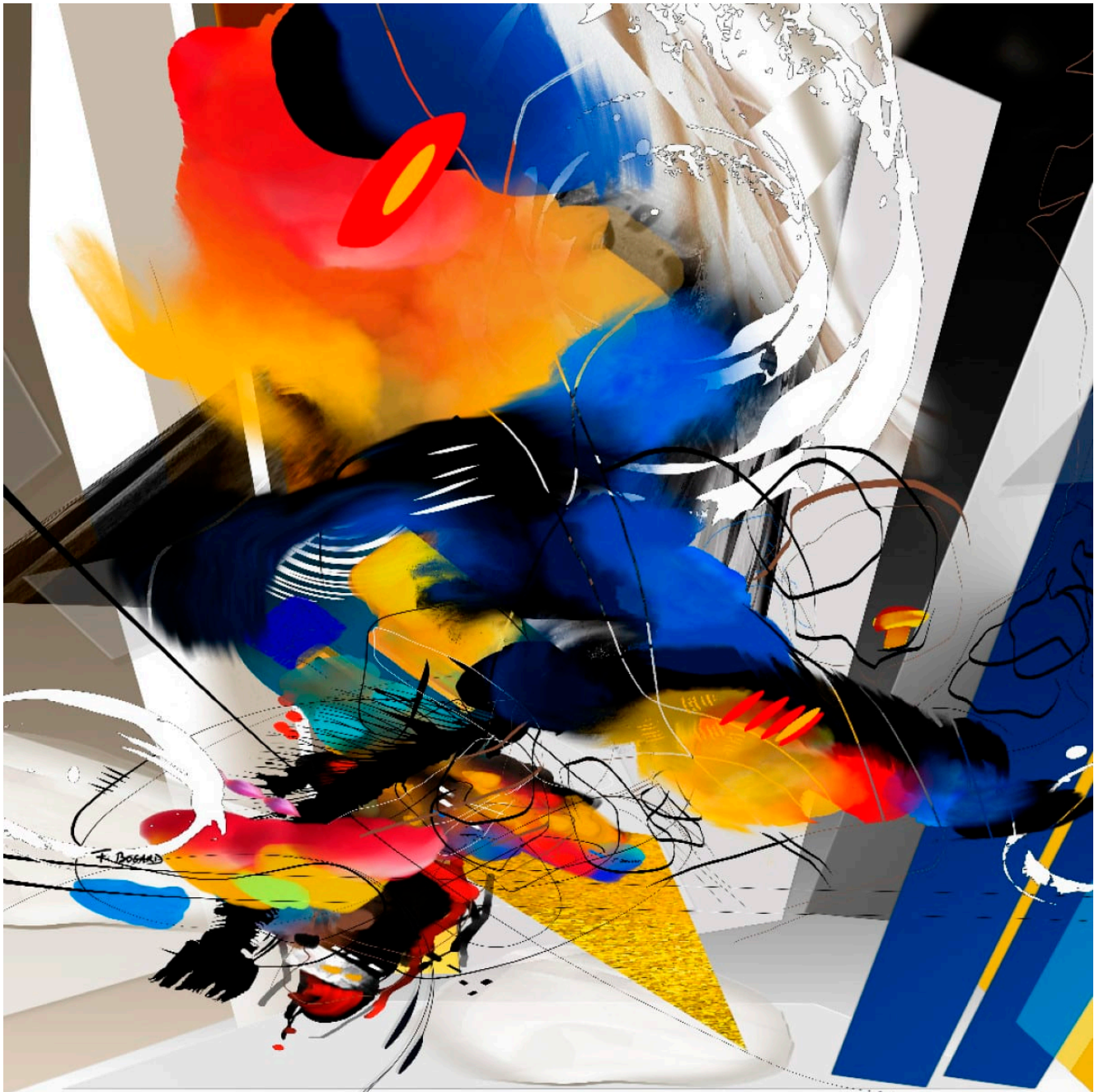
Série des petites agaceries – Agacerie 72 – 100x100cm – 2023