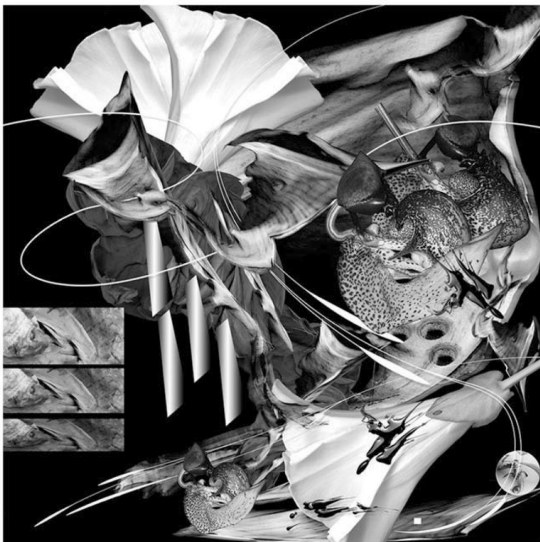
Série en végétal et en particulier – Entrelacs 169 – 50x50cm – papier d'art 300gr – 2014/2023