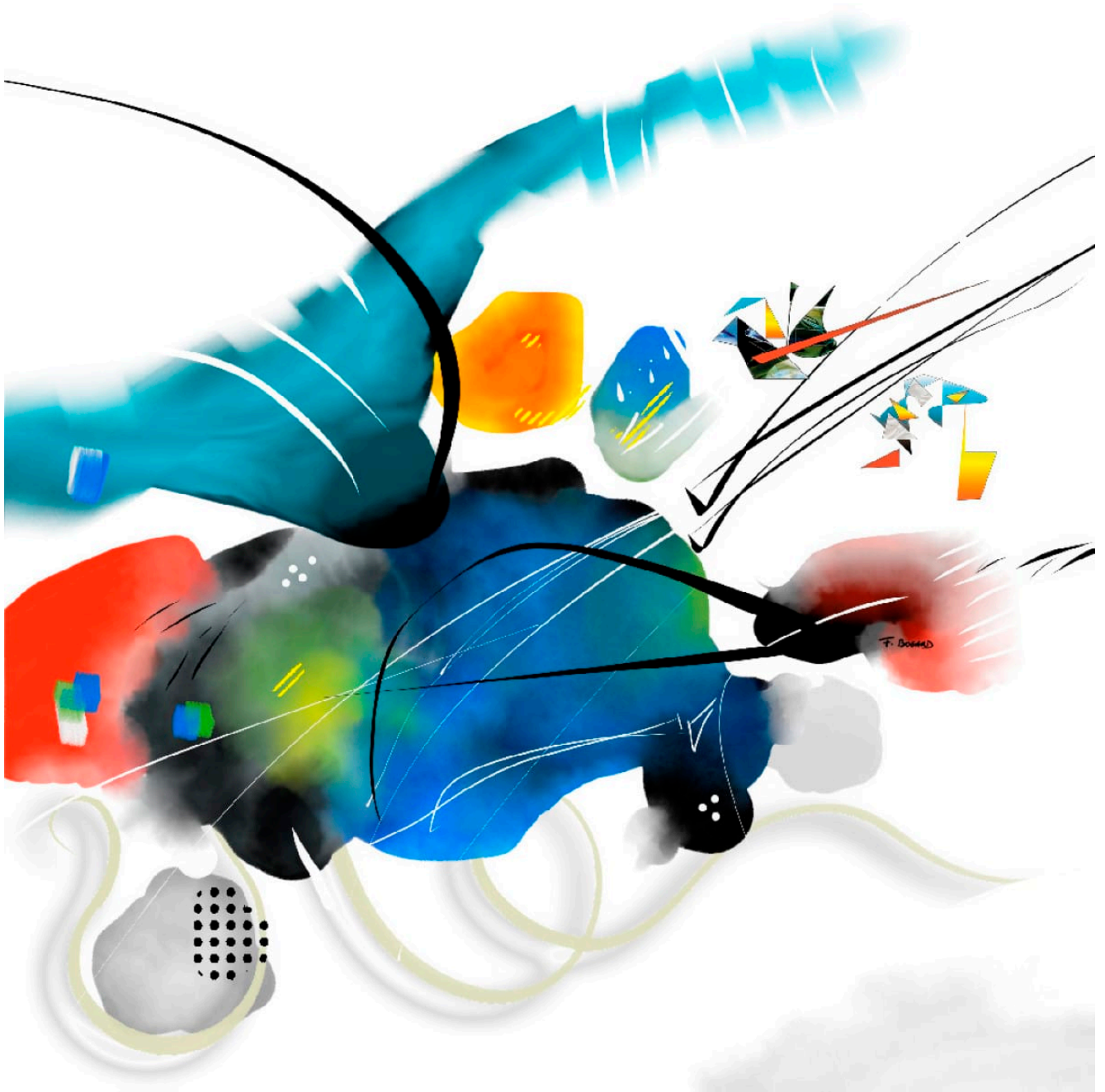
Série des petites agaceries – Agacerie 04 – 50x50cm – 2022/2023