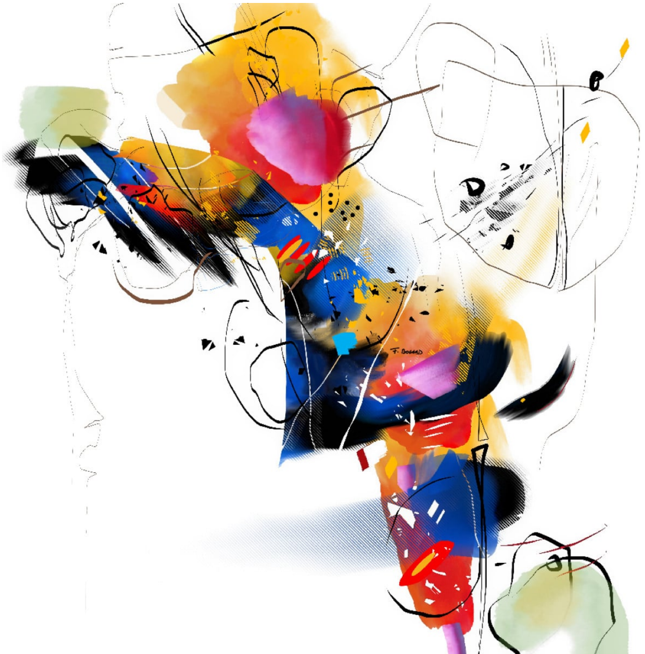
Série des petites agaceries – Agacerie 15 – 100x100cm – 2022/2023