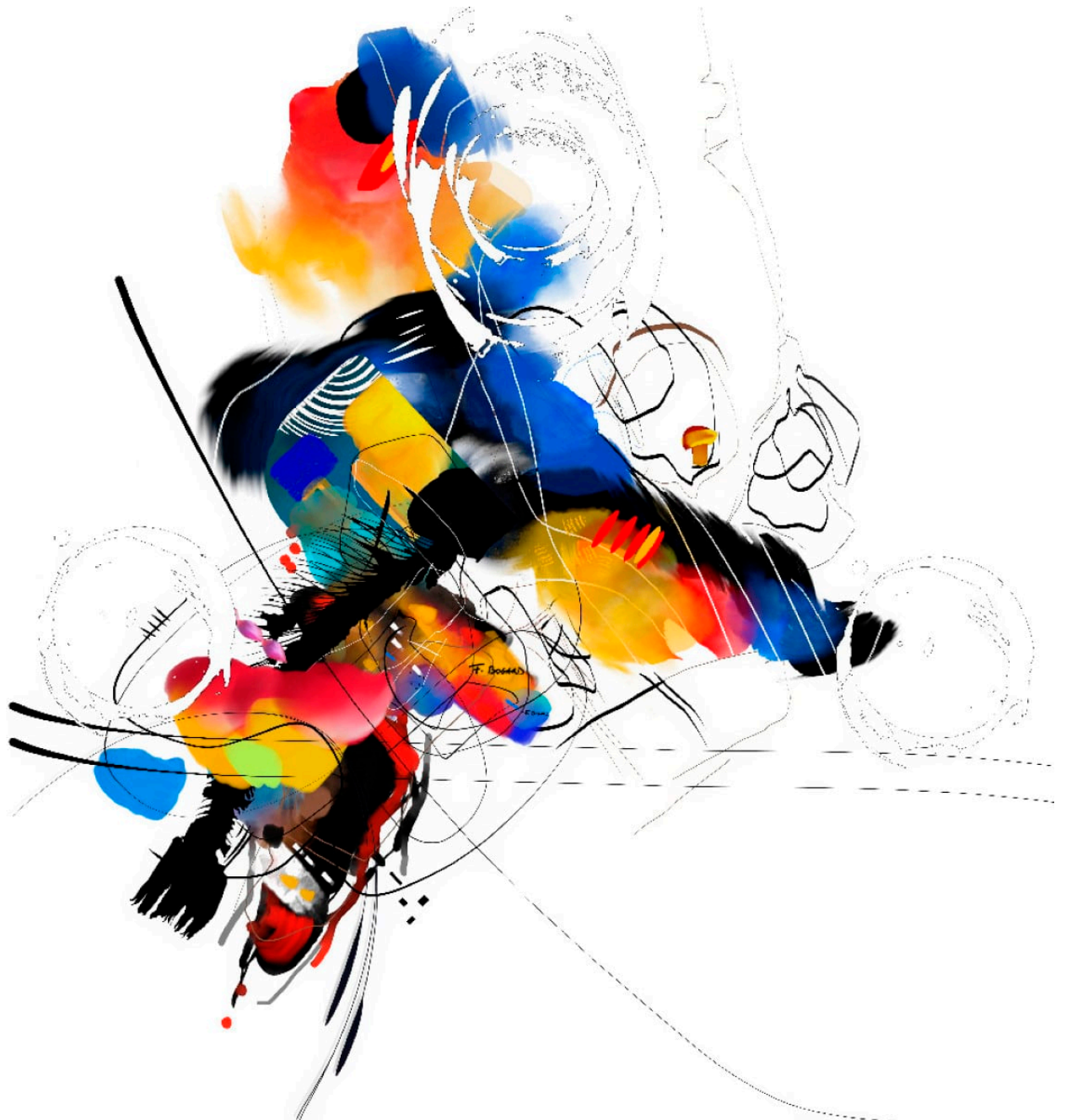
Série des petites agaceries – Agacerie 16 – 100x100cm – 2022/2023