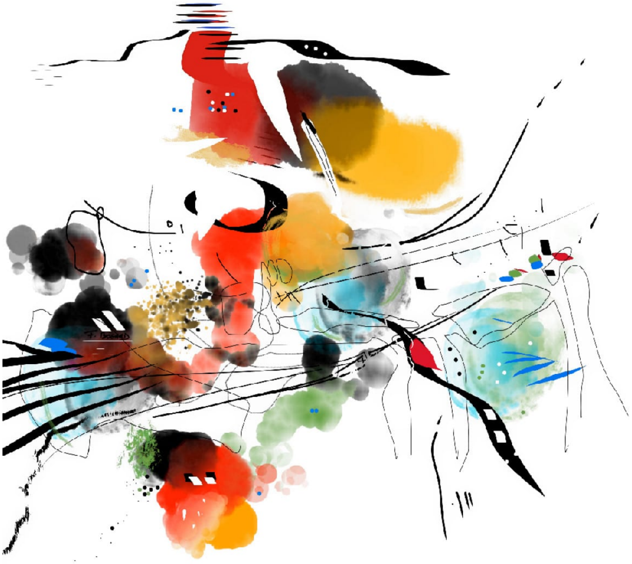
Série des petites agaceries – Agacerie 03 – 50x50cm – 2022/2023