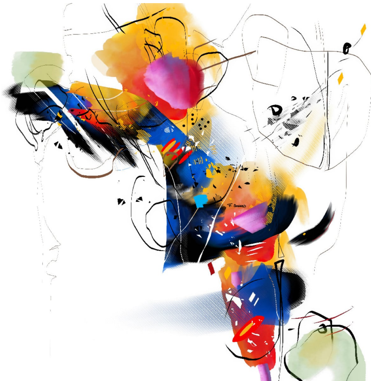
Série des petites agaceries – Agacerie 15 – 100x100cm – 2022/2023