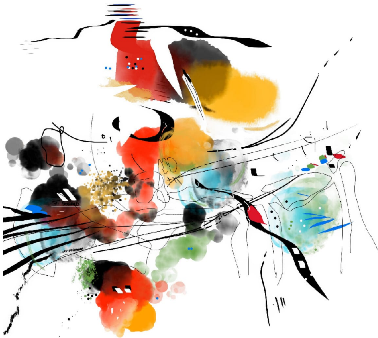
Série des petites agaceries – Agacerie 03 – 50x50cm – 2022/2023