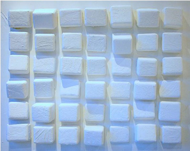
« Cubisme Conceptuel » Tableau conceptuel peinture blanche et collage sur bois symbolisant la métamorphose d'une surface. Assemblage et technique mixte 120x120cm