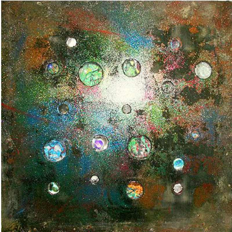
« Cosmos Eclairé » Peinture abstraite sur support mixte avec optiques en verre symbolisant la pollution atmosphérique et plus généralement une perception personnelle du Cosmos ou de la Voute céleste. Assemblage et Technique mixte 100x100cm