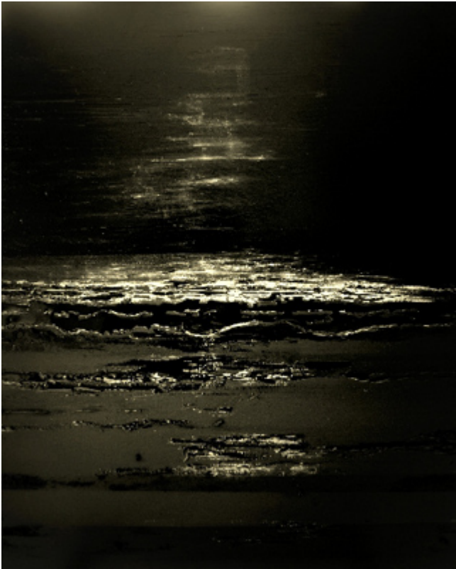
« Noire Marine » Tableau Marine Abstraite noire symbolisant l'océan au clair de lune. Technique mixte 100x80cm sur toile de Lin