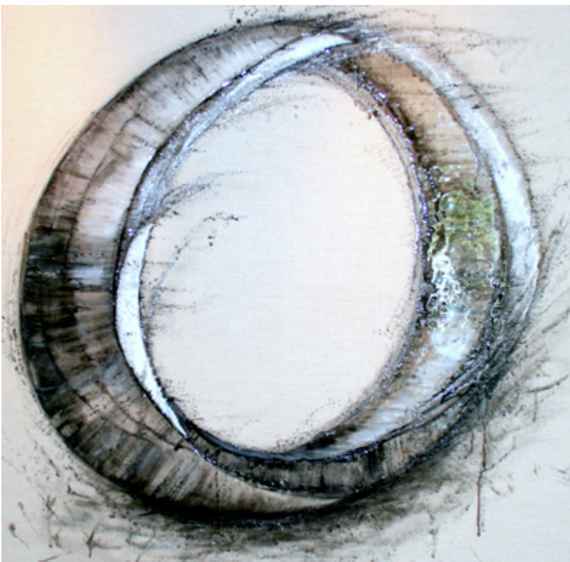
« Fluidité Circulaire » Tableau Abstrait sur Toile de Lin symbolisant la fluidité, le mouvement vers l'avant, la vitalité. Peinture, Encre et Résine – 100x100cm