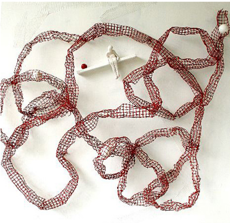
« Fil de la Vie et son Labyrinthe » Tableau sculpturale abstraite sur tableau bois symbolisant les chemins poétiques de la vie d'un homme et le labyrinthe qui l'accompagne.