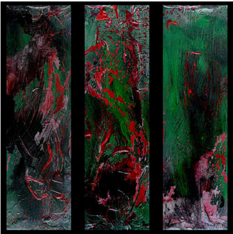
« Triptyque N° IX.2017 » Assemblage 74,2x60cm de 3 toiles 20x60cm