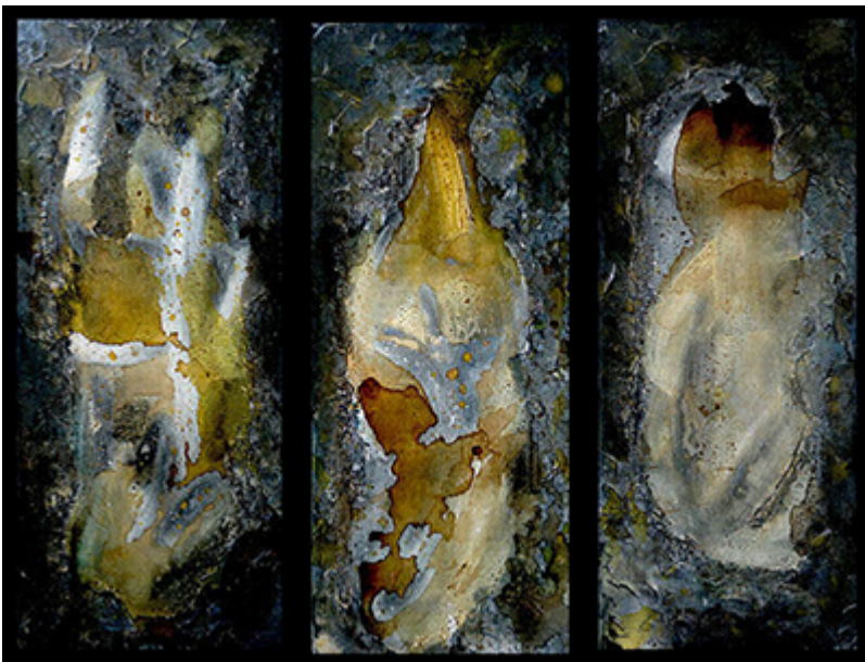
« Triptyque N° II-2019 » Assemblage 74,2x60cm de 3 toiles 20x60cm