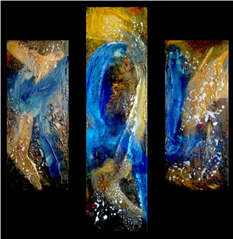
« Triptyque N°III.b-2018 » Assemblage 109,9x90cm toiles 30x60cm / 30x90cm / 30x60cm