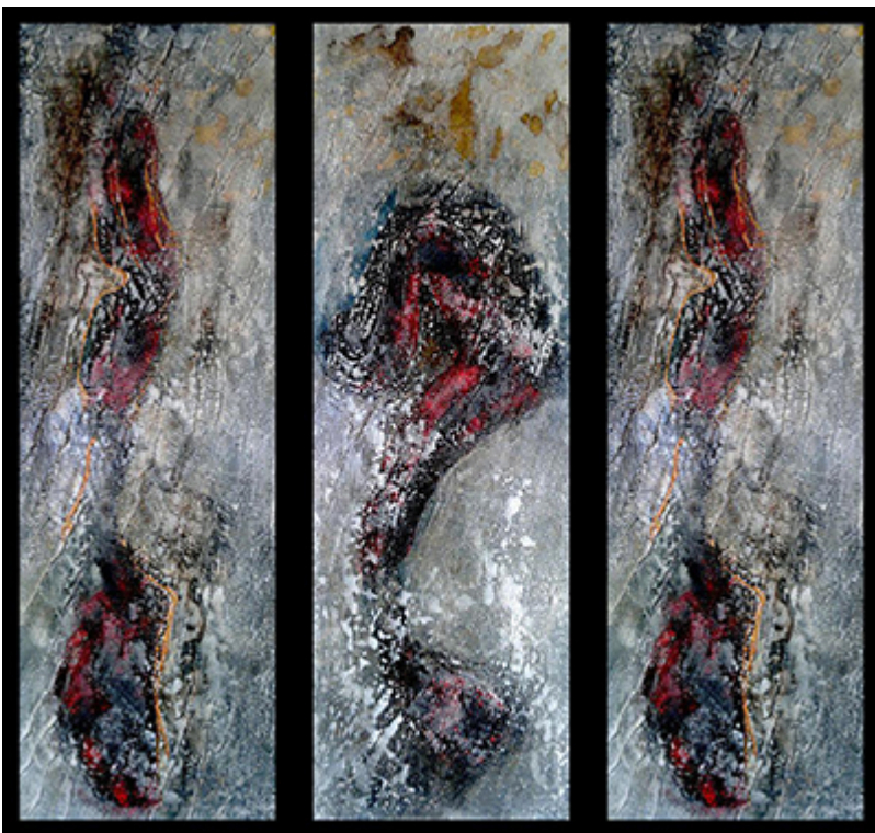
« Triptyque N° III.2019 » Assemblage 146x120cm (3 toiles 40x120cm)