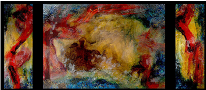
« Triptyque N° VIb.2019 »