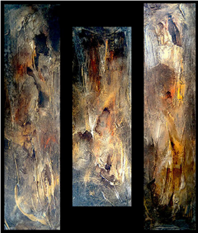
« Triptyque N° III-2017 » Assemblage 93,2x80cm toiles 20x80cm / 30x60cm / 32x80cm