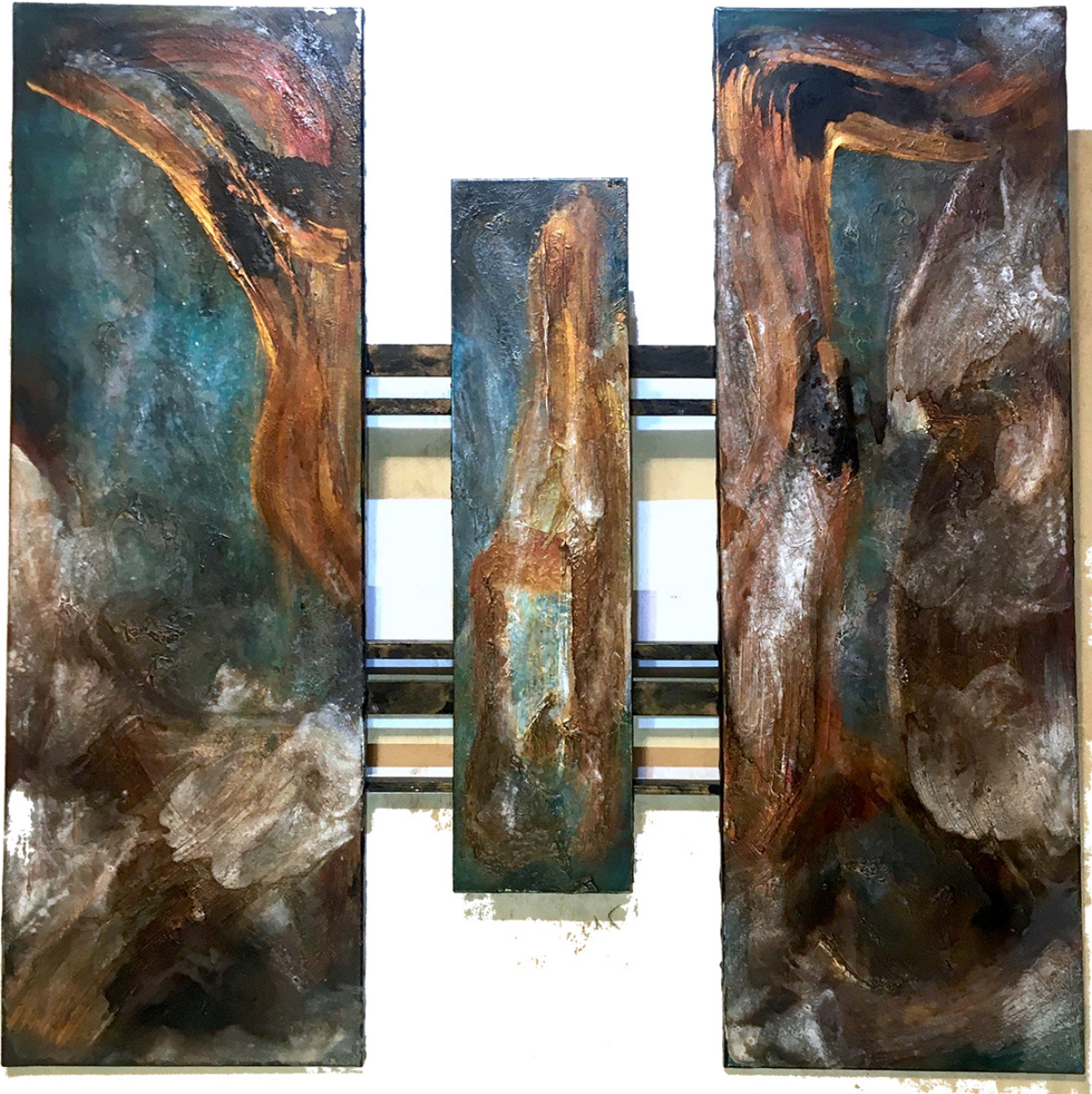
« Triptyque N° II-2023 » Version II : 19.II.2023 – Version I : 06.XI.2016. Acrylique, encres de couleur, pigments purs et autres substances non répertoriées. Toiles : 40 x 120 cm / 20 x 80 cm / 40 x 120 cm. Assemblage : 120,5 x 120cm.