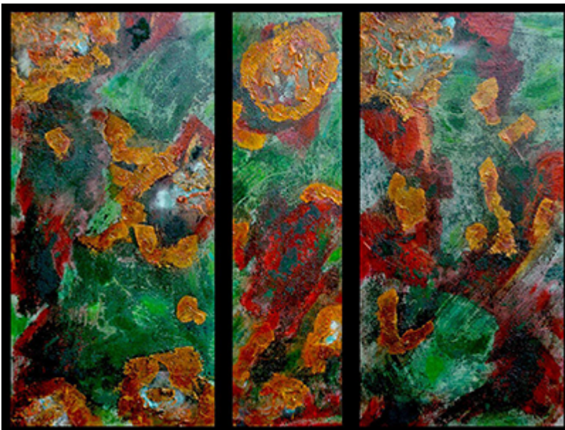
« Triptyque N° XV.2017 » Assemblage 95,2x60cm toiles 30x60cm / 20x60cm / 30x60cm