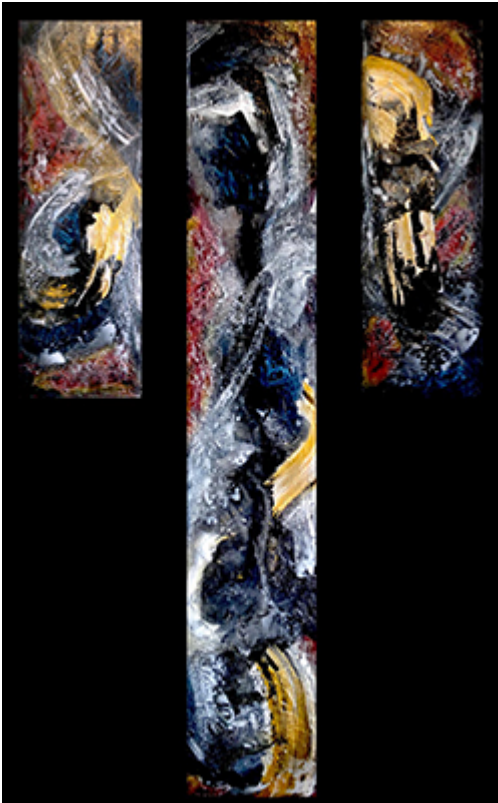
« Triptyque N° I-2016 » Assemblage 103,2x165cm toiles 30x90cm / 30x165cm / 30x90cm