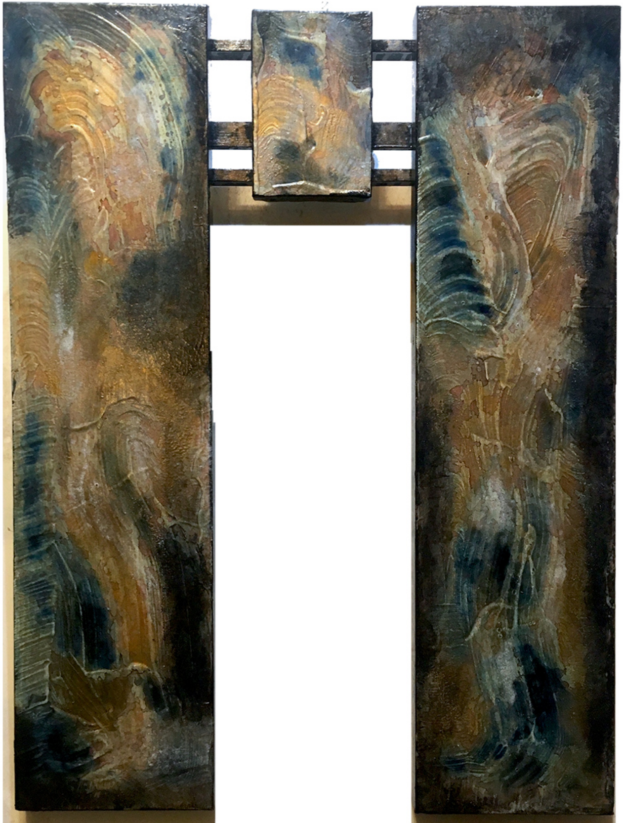
« Triptyque N° III.2023 » Version I : 01.VII.2014 Version II : 05.III.2023. Encres de couleur, acrylique et autres substances non répertoriées. Toiles : 20 x 80 cm / 18 x 16 cm / 20 x 80 cm. Assemblage : 80 x 80 cm