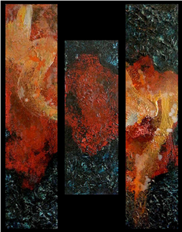
« Triptyque N° XVIIIa.2017 » Assemblage 70,6x80cm toiles 20x80cm / 20x60cm / 20x80cm