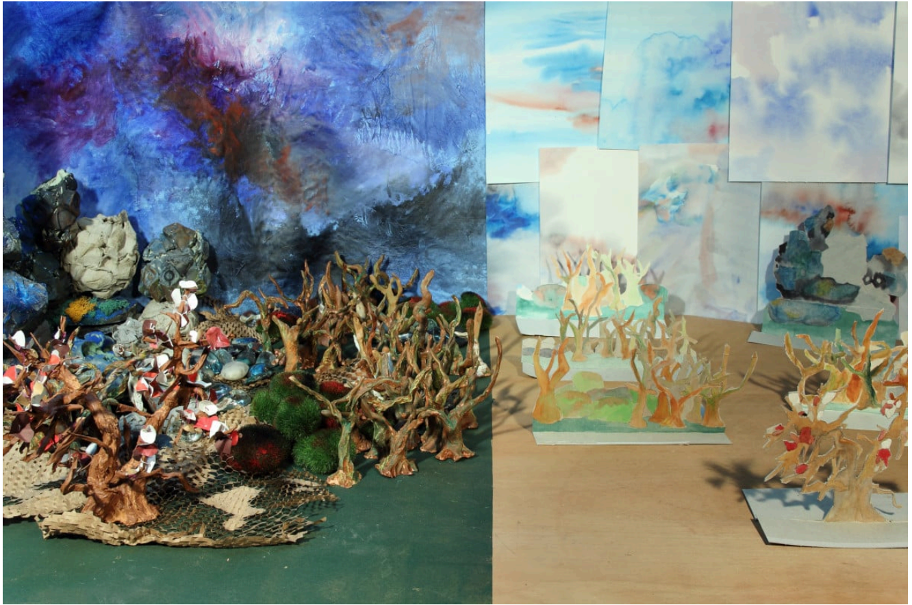
« Forêt cartonnée » Photographie numérique couleurs sur papier Fine Art 40x60cm (2020)