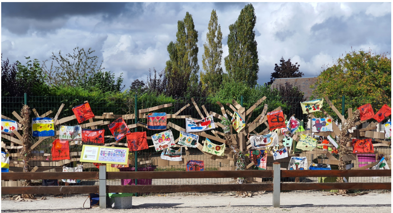
« Les arbres de vie » Œuvre participative (2021)