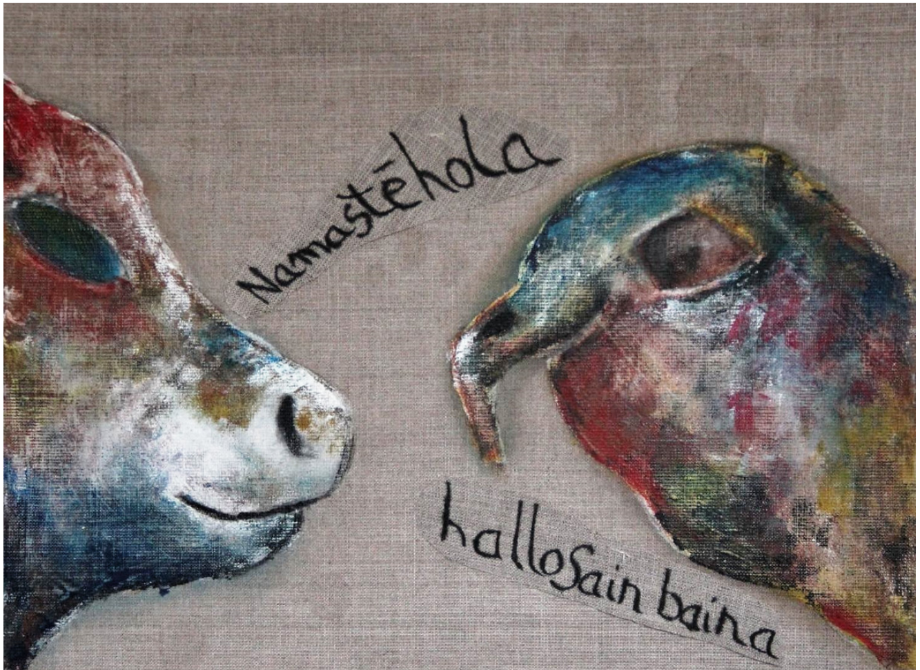
« Face à Face » 4 Acrylique sur toile et encre sur toile brute cousue, 30x40cm La possible rencontre de deux espèces inconnues (2012)