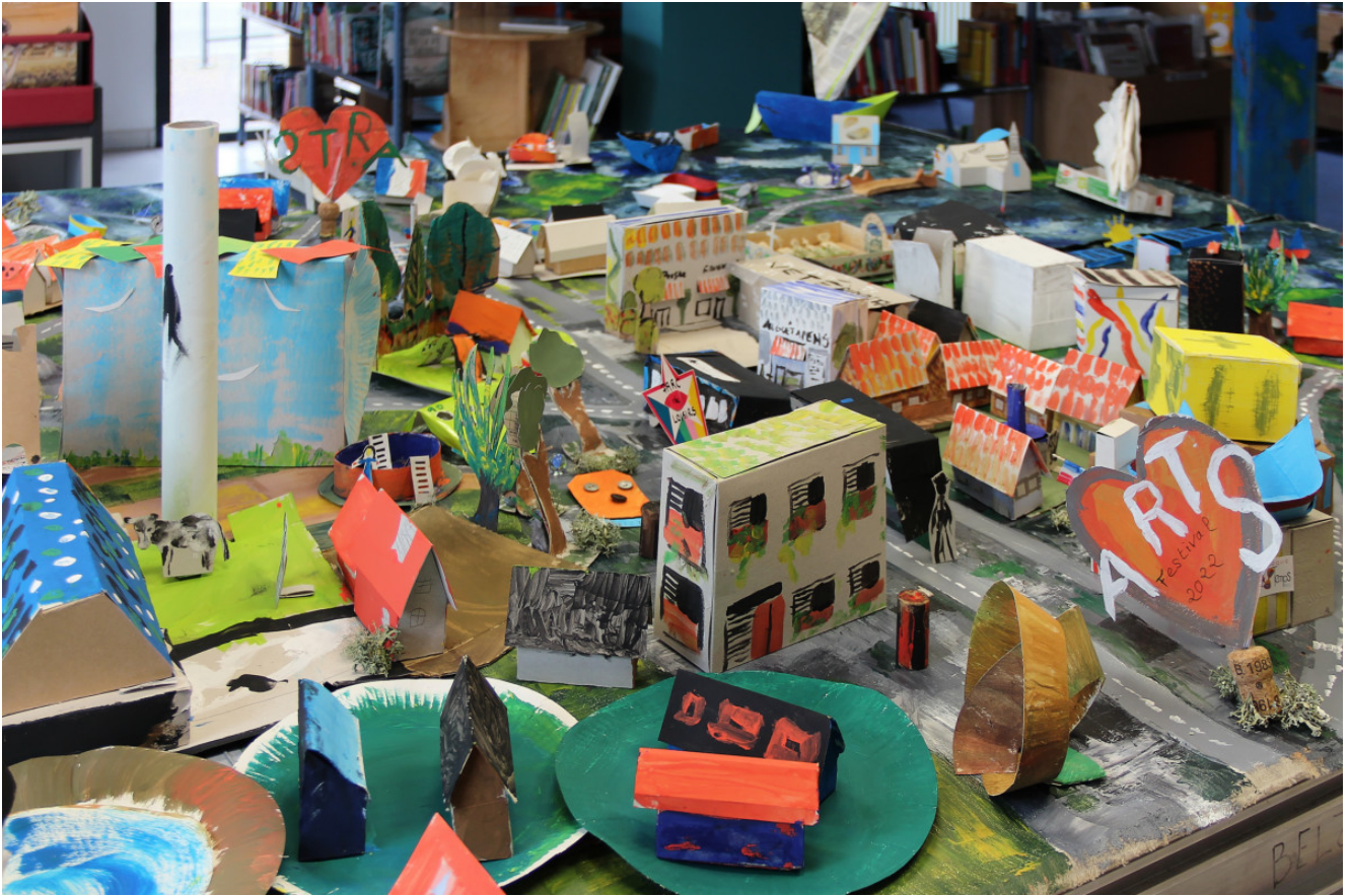
« Réinventer la ville » Œuvre participative (2022)