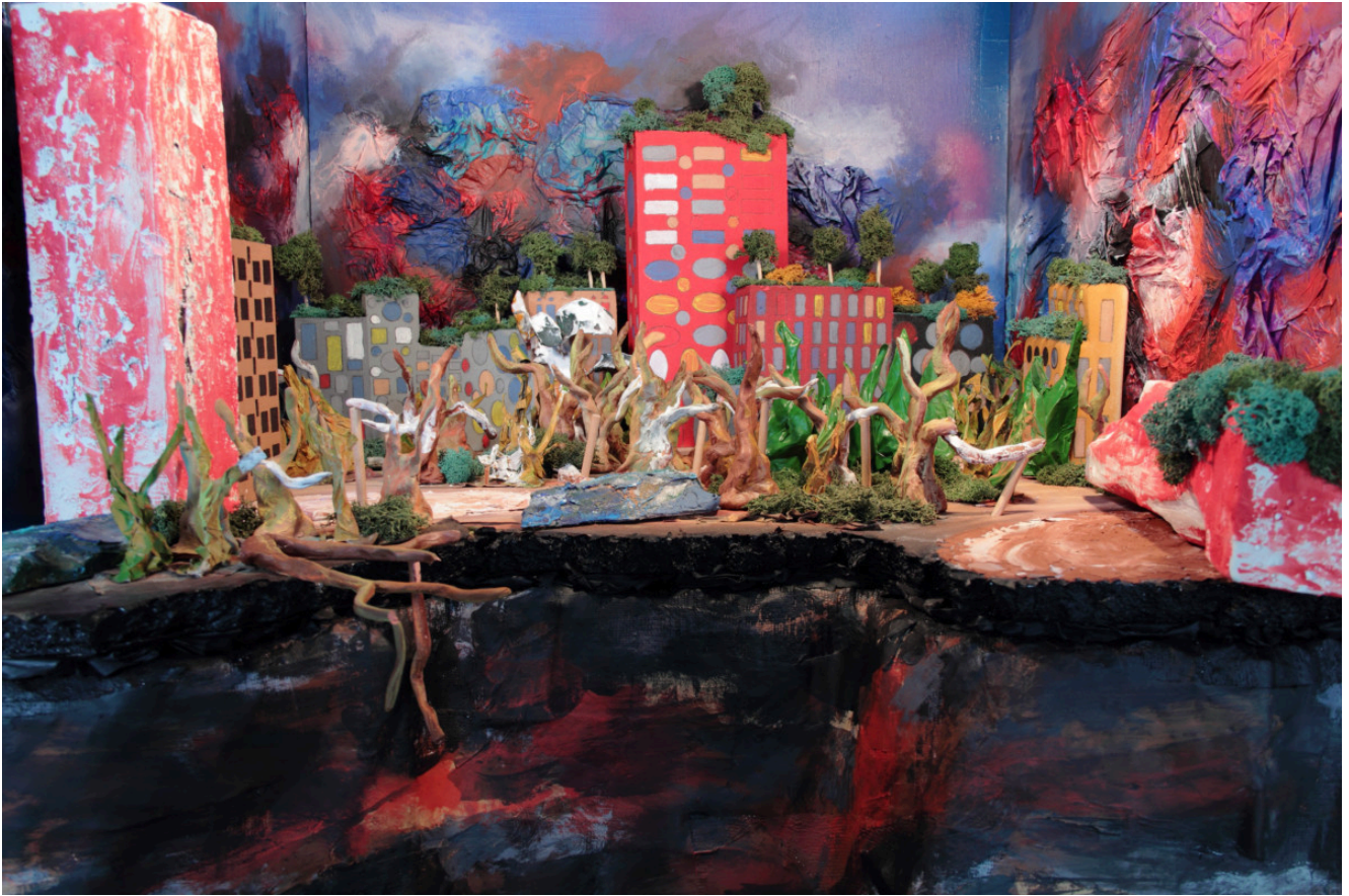
« Gouffre urbain » Photographie numérique couleurs sur papier Fine Art 50x75cm