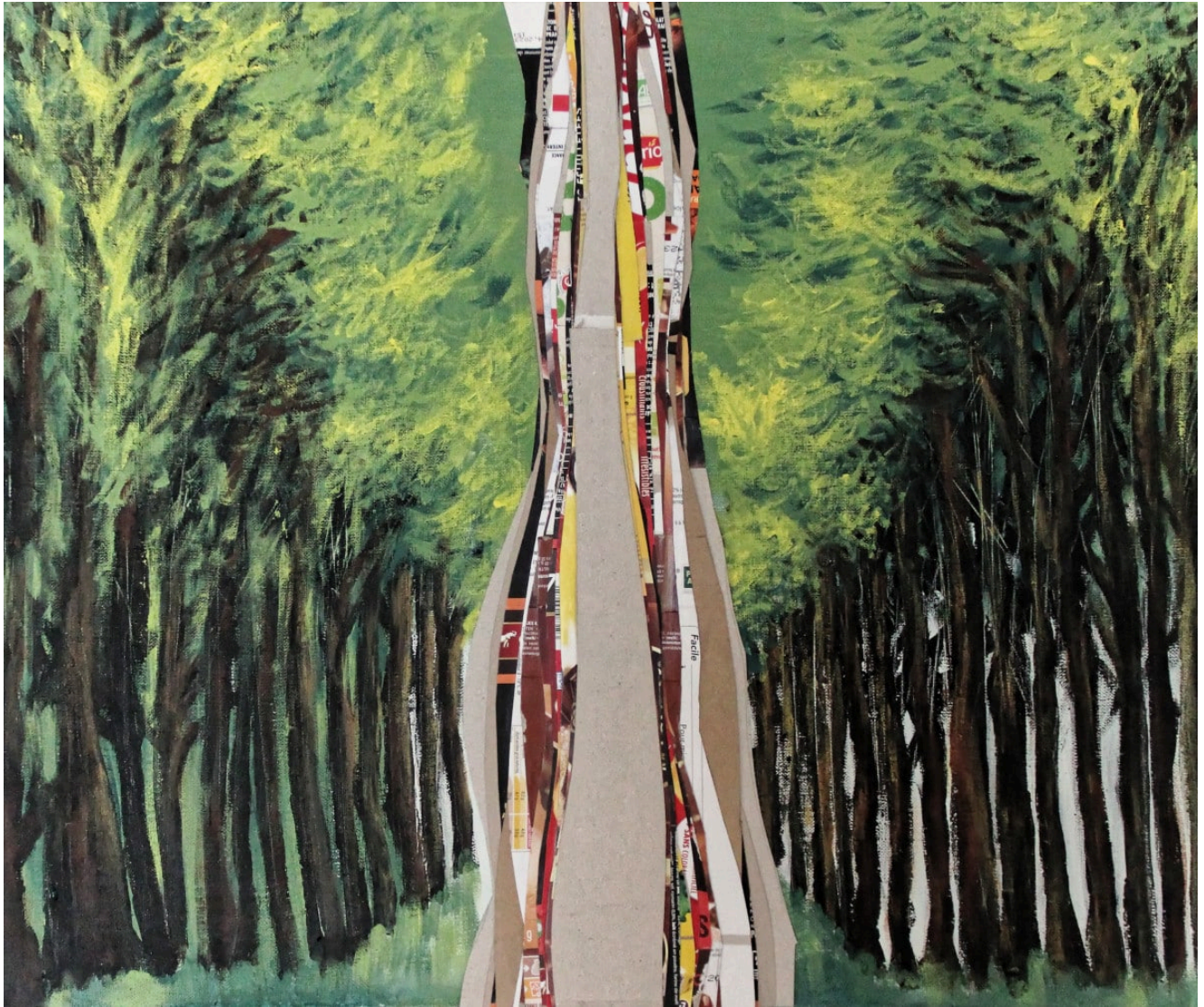
« Sans titre » Peinture acrylique sur toile 55x65cm (2021)