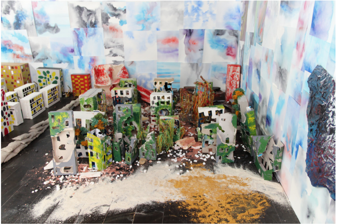
« Paysages » Installation bois, papier, aquarelle, collage, fil de laine (2020)