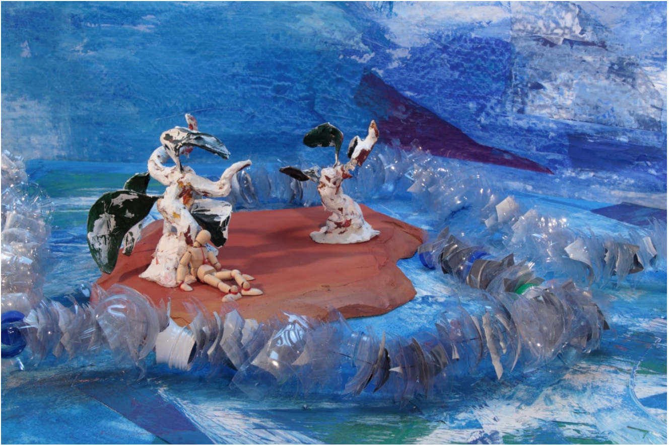
« Plastique marin » Photographie numérique couleurs 50×75 cm sur papier Fine Art (2018)