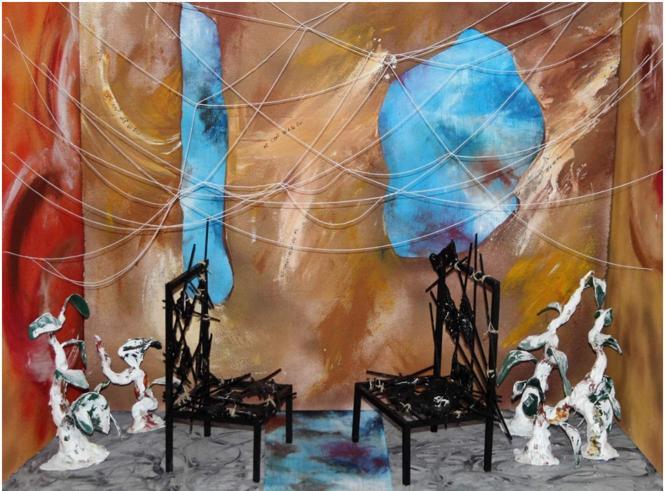
« Ne tient qu'à un fil » Installation, Photographie numérique Au hasard des rencontres, changer notre manière de voir les autres, faire évoluer les préjugés (2012)