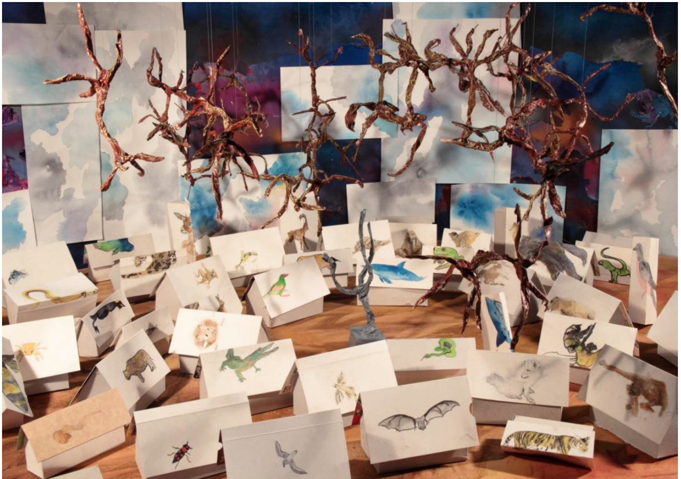
« Monument aux Arbres » Photographie numérique couleurs (2020)