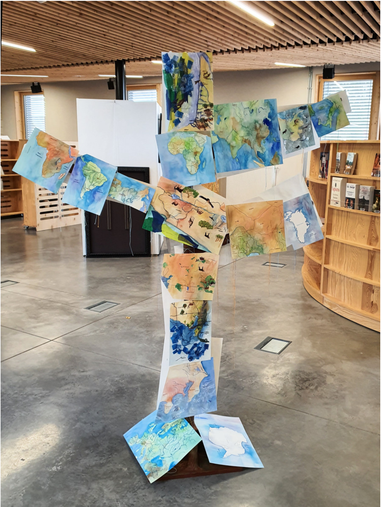
« L'arbre à cartes » Installation (2020)